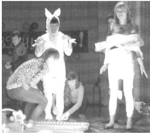
На празднике было много игр и развлечений.

Село Каменноозерское отмечало свой день рождения 11 июля.