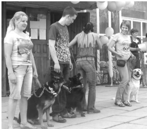
Байновцам особенно понравились собаки из клуба «Дарлинг».

На празднике чествовали в различных номинациях и вручали памятные сувениры жителям села. В этот раз в праздничной программе впервые при-