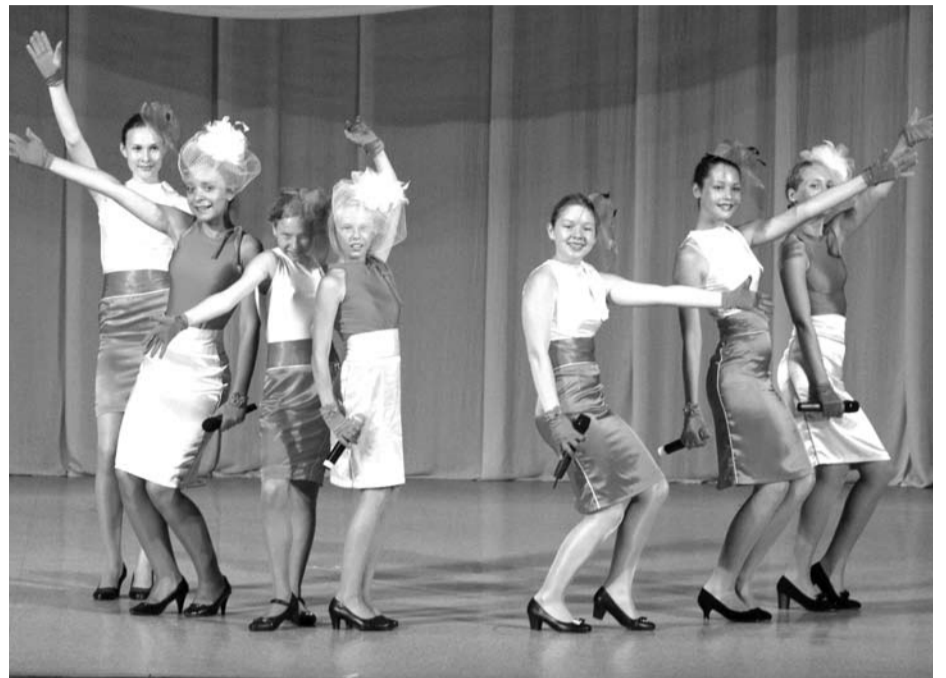
Талант, умение держаться на сцене, артистичность привели юных артистов к победе на крымской сцене.