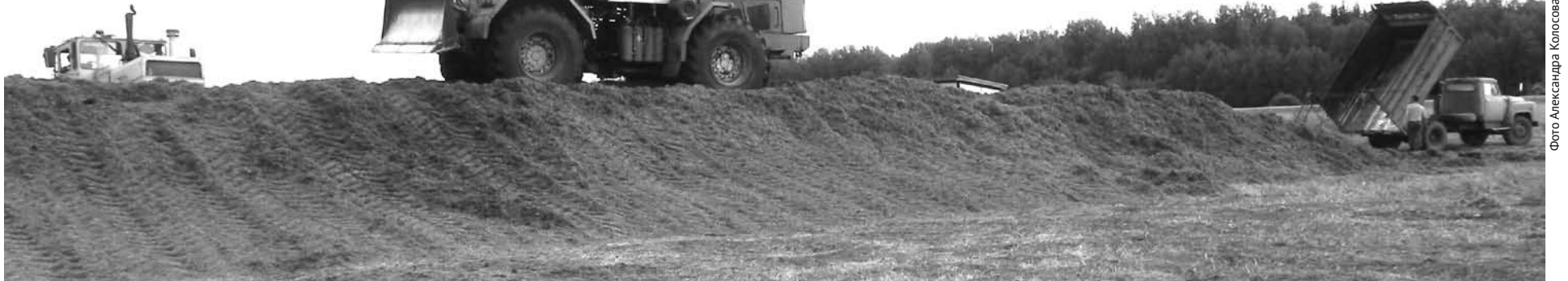
На трамбовке зеленой массы работают два мощных «Кировца».

- По состоянию на сегодняшний день мы выполнили план по селу на 117, а по сочным кормам на 50 процентов. На одну условную голову крупного рогатого скота заготовлено 18,3 центнера кормовых единиц или 68 процентов к плану.