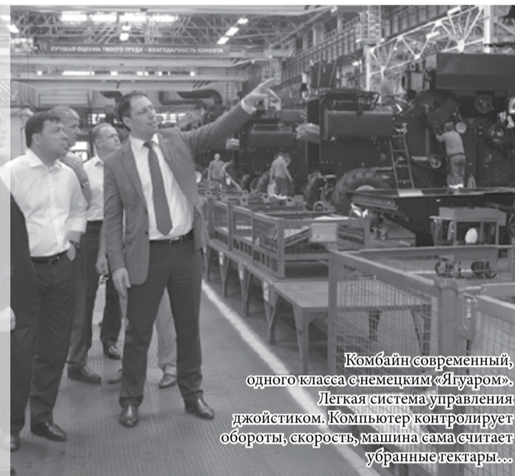
Комбайн современный, одного класса с немецким «Ягуаром». Легкая система управления джойстиком. Компьютер контролирует обороты, скорость, машина сама считает убранные гектары...