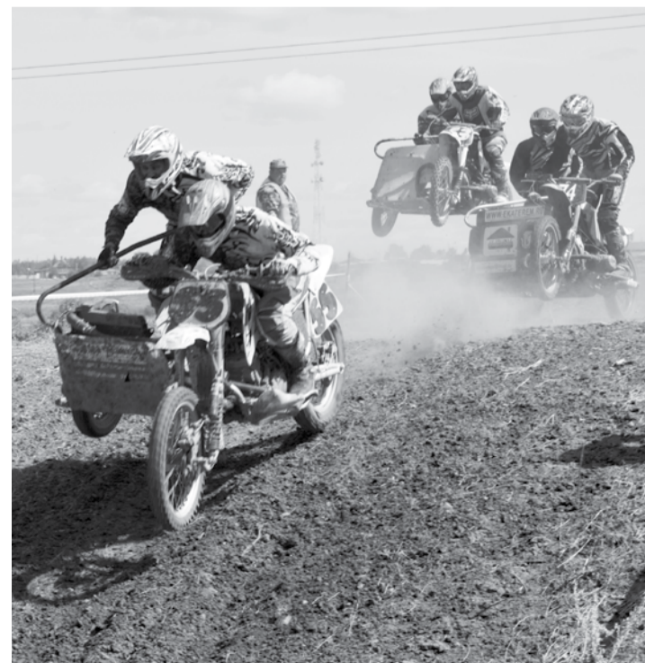
Драйв и адреналин сопровождают гонщиков во время заездов.

Фотографии с мероприятия смотрите на нашем сайте.