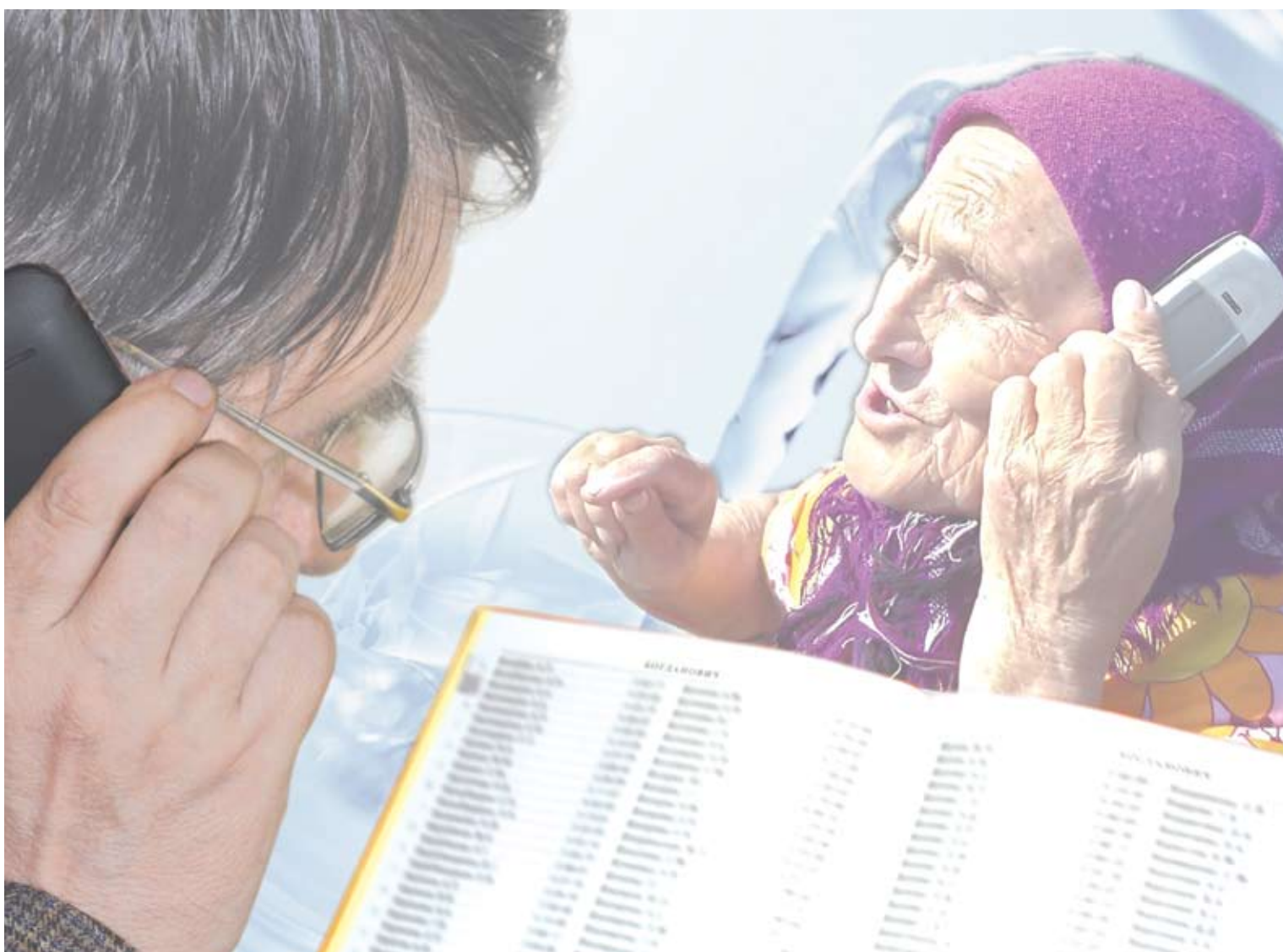
Фото Елены Пасюковой. Коллаж Марины Бурлаковой.