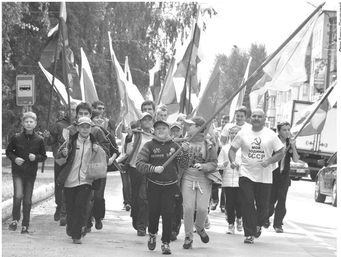
В честь Дня Государственного флага РФ богдановичские патриоты организовали и провели молодежную пробежку по улицам Богдановича.

После финиша собравшиеся познакомились с историей праздника, послушали музыкальные номера и с чувством выполненного долга отправились по домам.