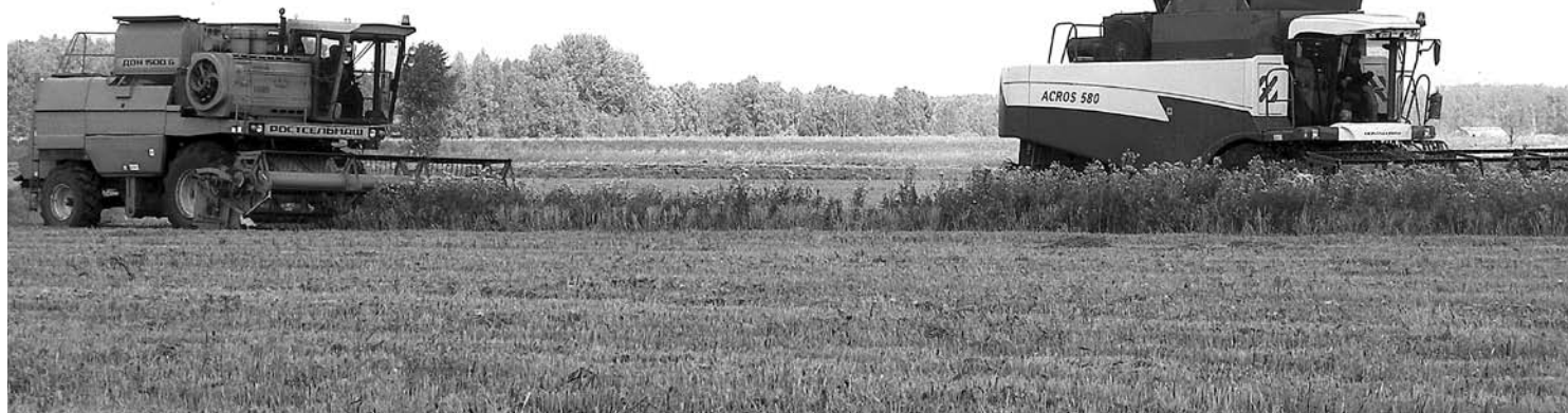
Фото Александра Колосова.

Пресс-служба администрации городского округа Богданович.