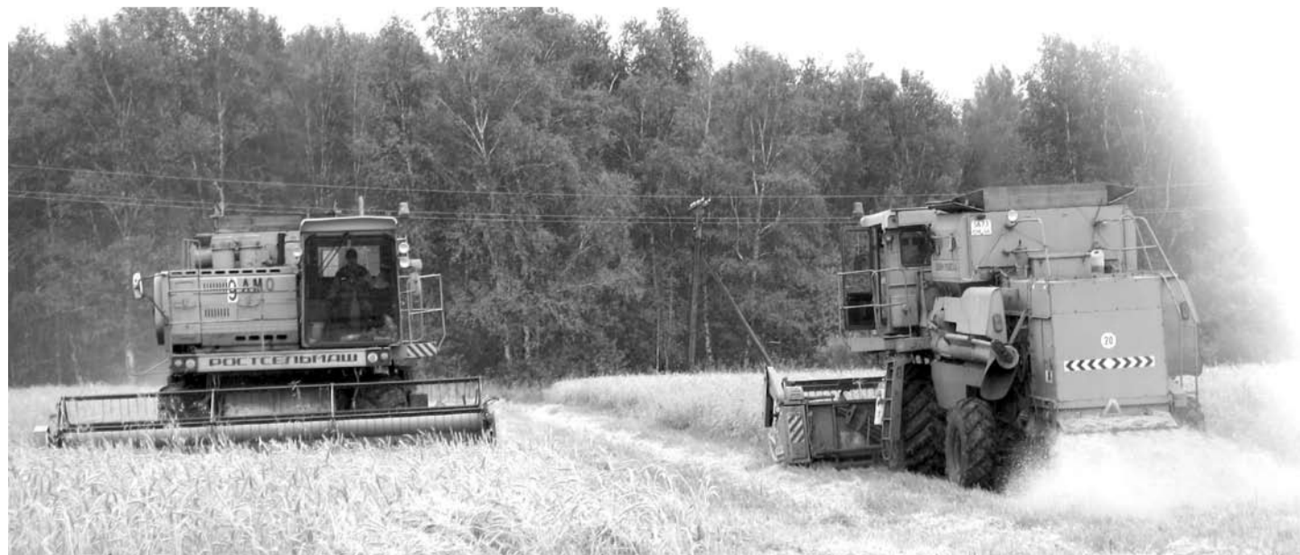
Зерноуборочные комбайны СПК «Колхоз имени Свердлова» в погожие дни работают дотемна.

- Я думаю, что зерна соберём на уровне прошедшего года.