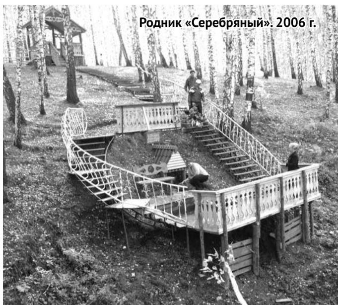
Родник «Серебряный». 2006 г.