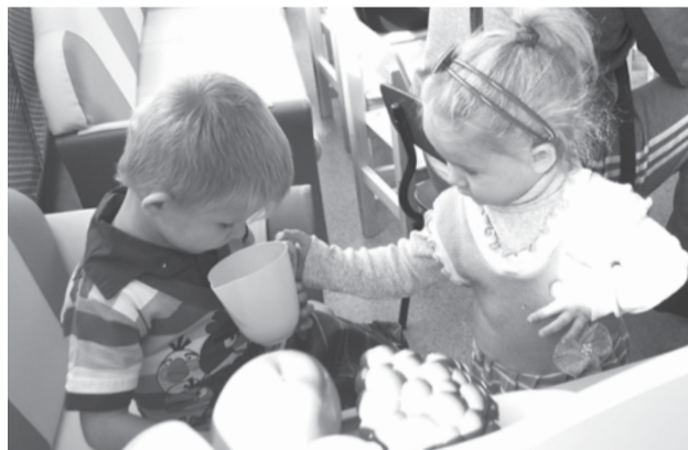
Дети быстро освоились в новой группе и принялись играть новыми яркими игрушками.

Казачий атаман остался доволен тем, как кадетский корпус подготовлен к началу учебного года, и уровнем подготовки юных казачат.