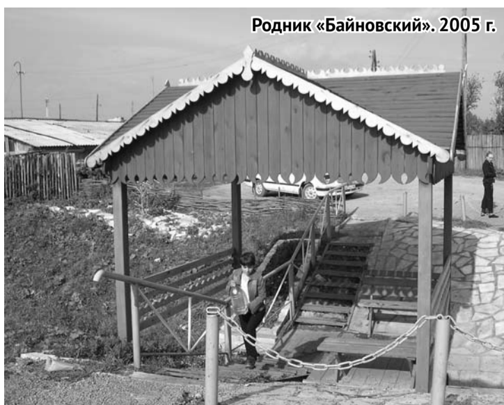
Родник «Байновский». 2005 г.

Конечно, кто-то может сказать: «Обустроивали родники по областной программе, работали все на показуху, а сейчас никому ничего не надо». Однако давайте задумаемся, откуда появляется мусор на родниках и кто ломает все декоративные элементы. Ответ очевидный: мы сами . Ни один металлический забор, ни одна деревянная конструкция, а соответственно, ни один родник в целом не выдержит такого разрушительного, безнравственного, безответственного поведения людей. Хочется верить, что все родники вновь приведут в порядок. И от нас зависит, как долго продержится этот порядок.