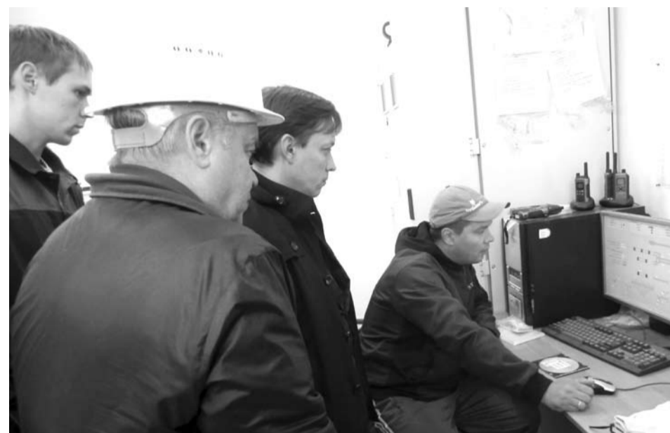
...и технологией производства нового завода.