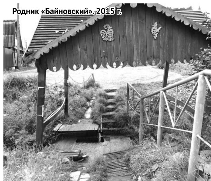
Родник «Байновский». 2015 г.