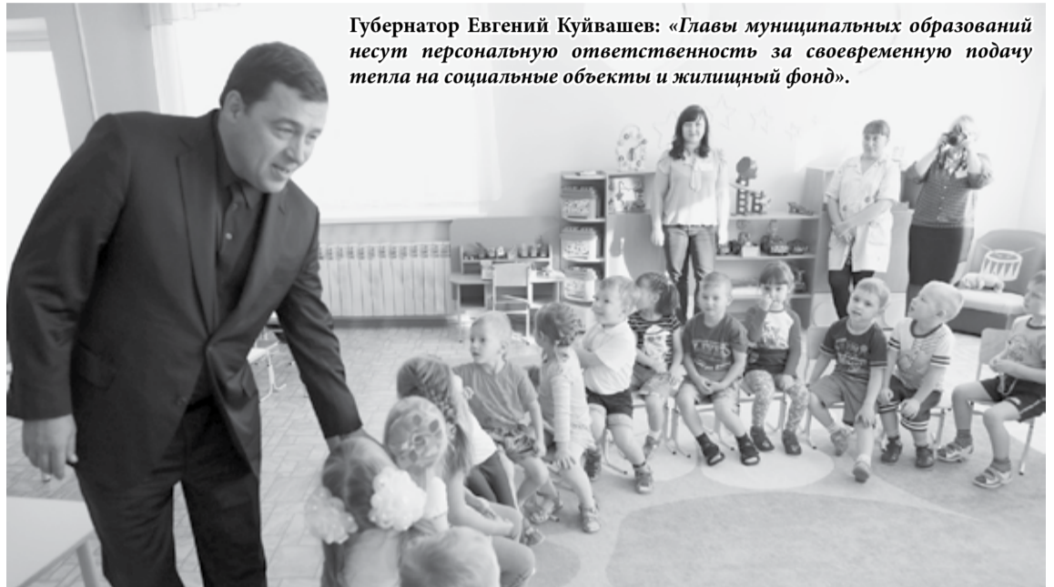
Губернатор Евгений Куйвашев: «Главы муниципальных образований несут персональную ответственность за своевременную подачу тепла на социальные объекты и жилищный фонд».

Отметим, аналогичная «горячая линия» будет открыта с 12 октября и в министерстве энергетики и ЖКХ области, номера телефонов будут сообщены дополнительно.