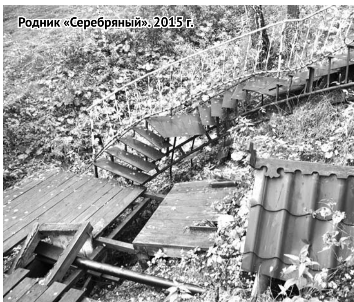
Родник «Серебряный». 2015 г.