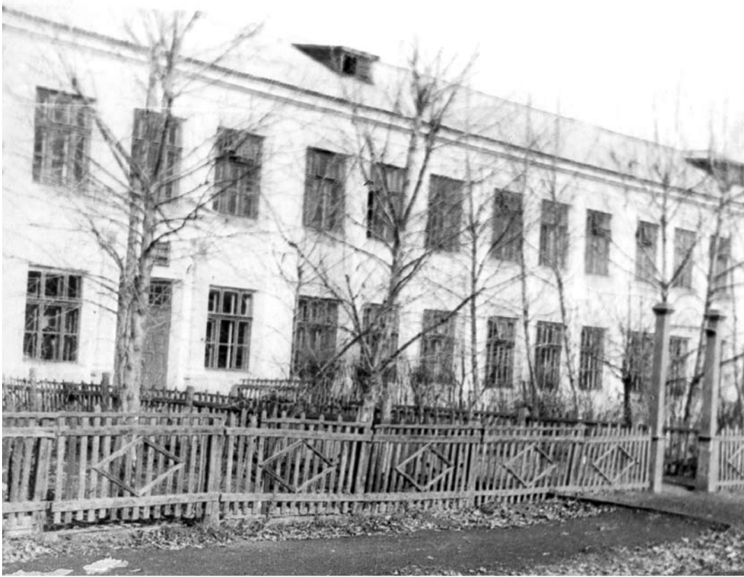
60-е годы. На какой улице находится это здание? Ответы принимаются по телефону - 2-25-92 (в рабочие дни, с 8:00 до 17:00).