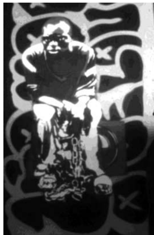
Африканец, закованный в цепи. Автор – Павел Бодрый.

В основном Павел использует для картин три цвета, находя изображения в Интернете, которые впоследствии переносит на трафарет из плотной бумаги, а далее уже переносит на «холст». В целом на изготовление одного трафарета у него уходит от трех часов до двух дней и порядка двух часов – на нанесение изображения на основу. Среди его картин можно встретить и пионера с трубой, и афроамериканца, закованного в цепи. Раньше о творчестве Павла знали только его родные и друзья, в скором