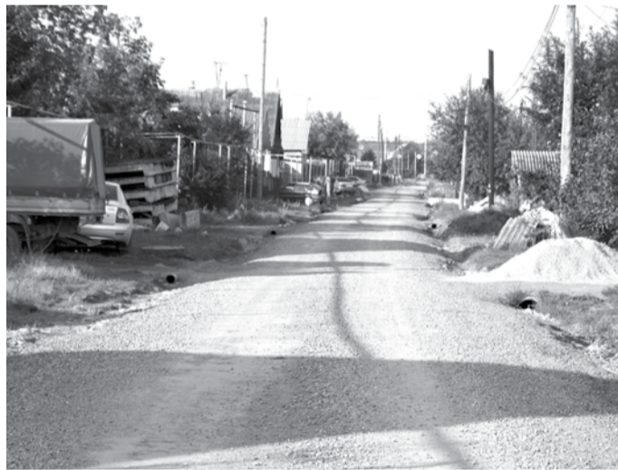
Щебёночные дороги стали лучше.

В городском округе Богданович на балансе находятся 350 километров автомобильных дорог, из них 120 километров дорог асфальтированных, 130 – со щебёночным покрытием (дороги переходного типа), остальные – грунтовые. Щебёночные дороги давно не ремонтировались, и в 2014 году эту ситуацию частично исправили – там, где наиболее интенсивное движение автотранспорта: улицы Пургина и Озёрная, переулки Александра Матросова и Олега Кошевого в городе, улицы Чкалова и Автомобилистов в Байнах, улицы Челюскинцев и Тимирязева в Троицком. Выполнялся и ремонт самых проблемных участков асфальтовых дорог: на улице Первомайской в районе Коменского переезда, на улицах Труда и Крылова в Богдановиче.