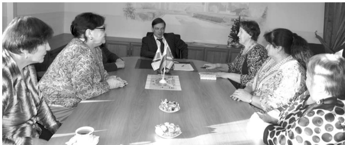
В ходе общения с главой солдатские матери задавали разные вопросы, в том числе по патриотическому воспитанию молодежи.