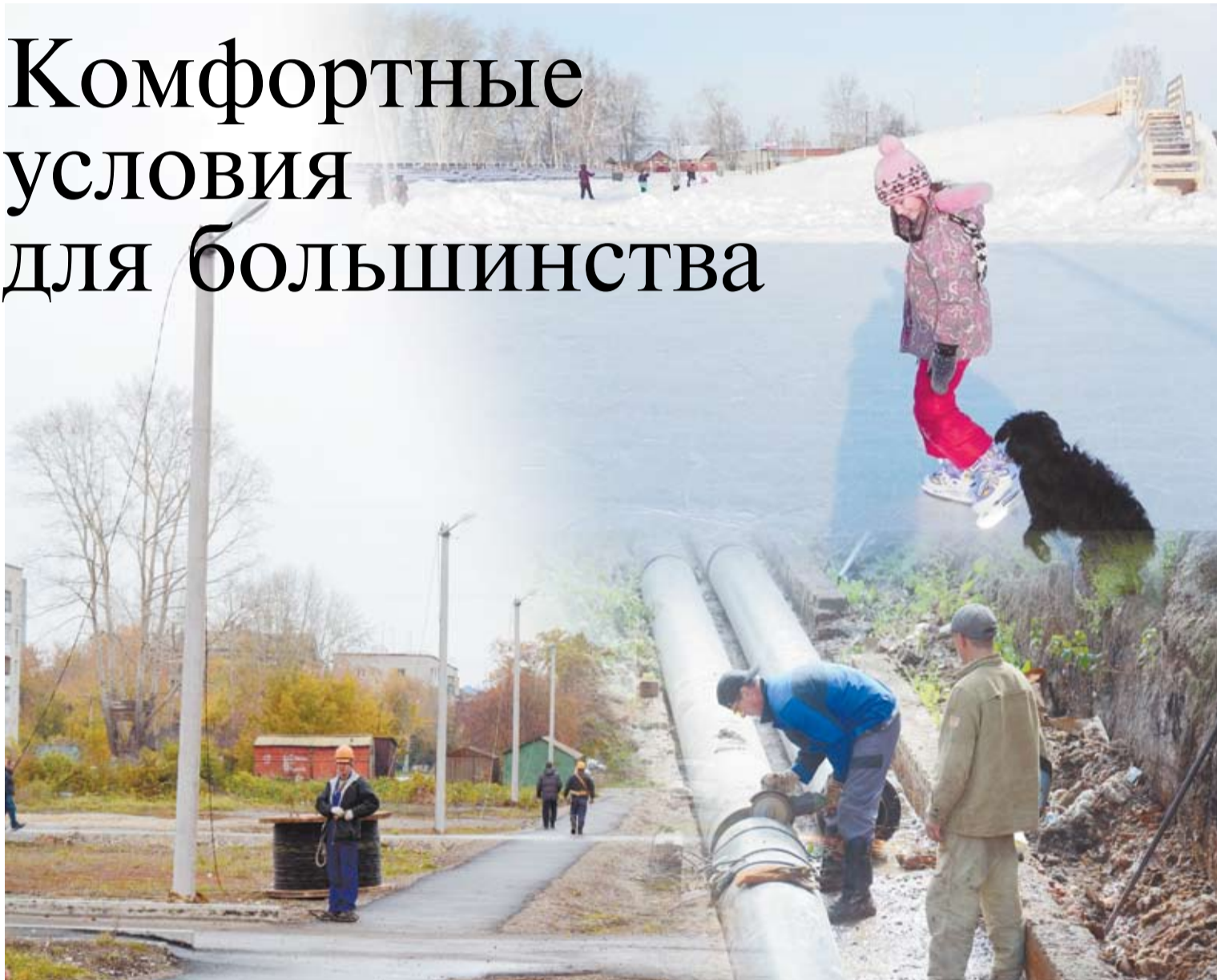
Коллаж Марины Бурлаковой.