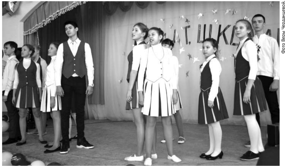
Учащиеся школы №2 выступили с презентацией, которую с блеском представили на олимпиаде.