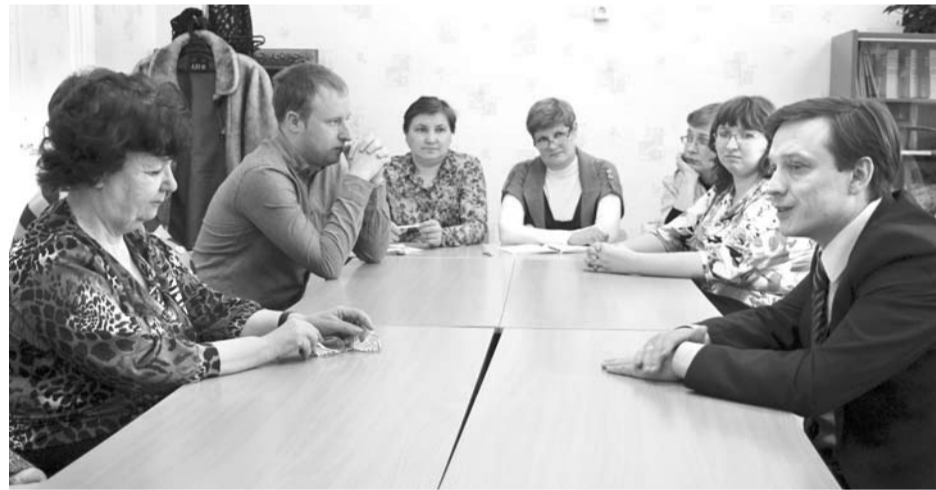
После своеобразной экскурсии по образовательному учреждению руководитель территории побеседовал с педагогами, ответив на все поступившие вопросы.

Нужно отметить, что на протяжении последних трех лет эта школа, как, впрочем, и другие сельские образовательные учреждения городс-