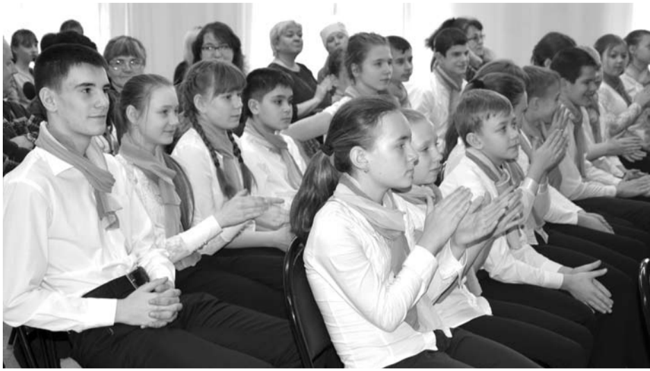
Успехам учеников школы №3 на торжественной линейке «Аплодисменты» радовались одноклассники, родители и педагоги.