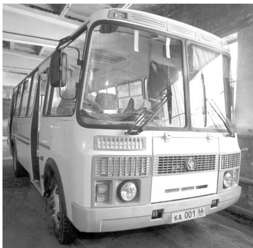
Последним приобретением ОАО «Транспорт» стал автобус с гордым номером 001.