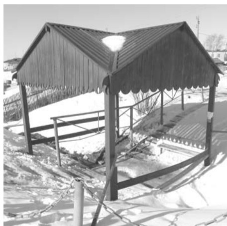
Отремонтированный родник в Байнах.

В 2015 году на сходе управлению территории были поставлены задачи по отлову бродячих собак в Байнах, поселке Полдневом и деревнях