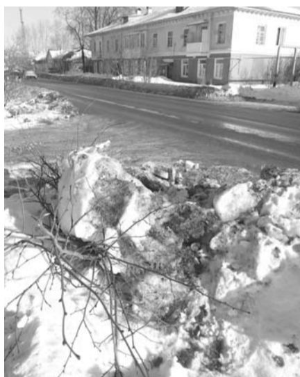
Саженец оказался погребенным под снегом.