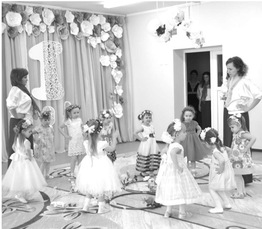
Девочки из средней группы вместе с воспитателями исполнили танец «Хоровод».