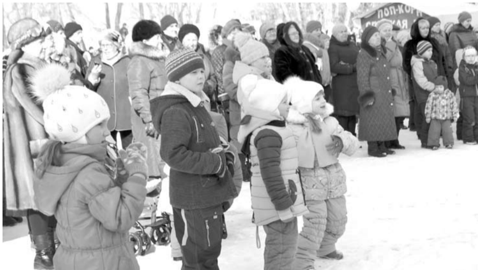
Пока взрослые и дети приплясывали под веселые песни, звучавшие со сцены, молодежь соревновалась в силе и ловкости.

В городском парке в минувшее воскресенье с утра было многолюдно и шумно, повсюду играла музыка, торговые палатки привлекали гостей шашлыками, румяными блинами, разной выпечкой, сладостями, горячим душистым чаем. Благодаря тёплой и солнечной погоде, народу пришло на праздник немало. Шли целыми семьями, и не зря: в этот день в парке было организовано много развлечений, как для детей, так и для взрослых. На сцене танцевали и пели творческие коллективы городского округа. Молодые люди и девушки пробовали свою силу и ловкость в различных конкурсах и забавах. И за этим весельем «наблю-