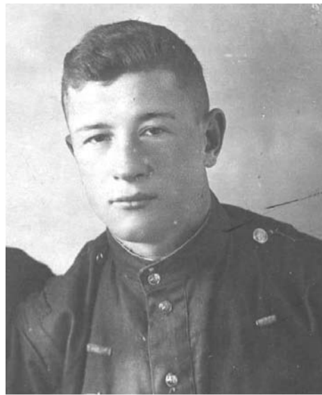
Награжден медалями «За отвагу», «За боевые заслуги».

Неоднократно был ранен. После войны раны часто давали о себе знать. Работал ветеринаром. Ушел из жизни 23 февраля 1961 года.