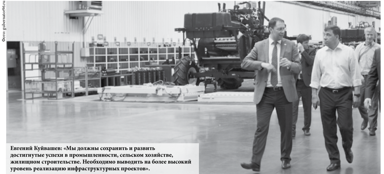
Евгений Куйвашев: «Мы должны сохранить и развить достигнутые успехи в промышленности, сельском хозяйстве, жилищном строительстве. Необходимо выводить на более высокий уровень реализацию инфраструктурных проектов».

Евгений Куйвашев подчеркнул важность того, что с 2016 года для Свердловской области начался новый этап жизнедеятельности – стартовала реализация Стратегии социально-экономического развития региона, рассчитанной до 2030 года. Показатели первых месяцев года свидетельствуют о наличии предпосылок для ее успешной реализации. Индекс промышленного производства в январе-апреле 2016 года составил 109,8%. Индекс производства продукции сельского хозяйства – 103,7%. Индекс физического объема инвестиций в основной капитал в первом квартале 2016 года составил 117,9 процента к соответствующему периоду прошлого года.