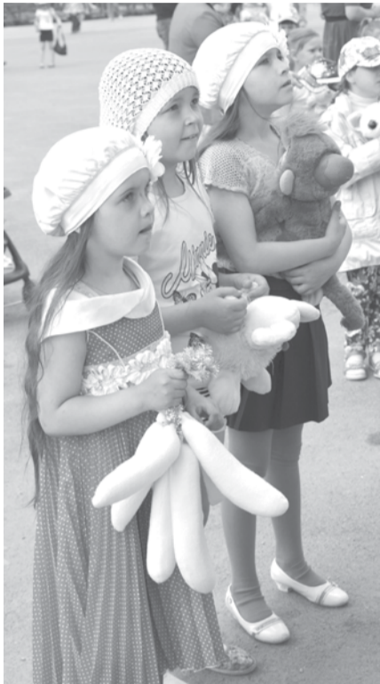
Детство - это самый лучший праздник.

ПРАЗДНИК, посвященный Международному дню защиты детей, в нашем городе проходил в течение нескольких дней.