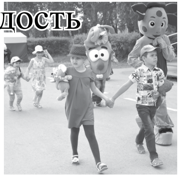
Прогулка с мультяшками – весёлая забава.

Весь день детской радости не было предела!