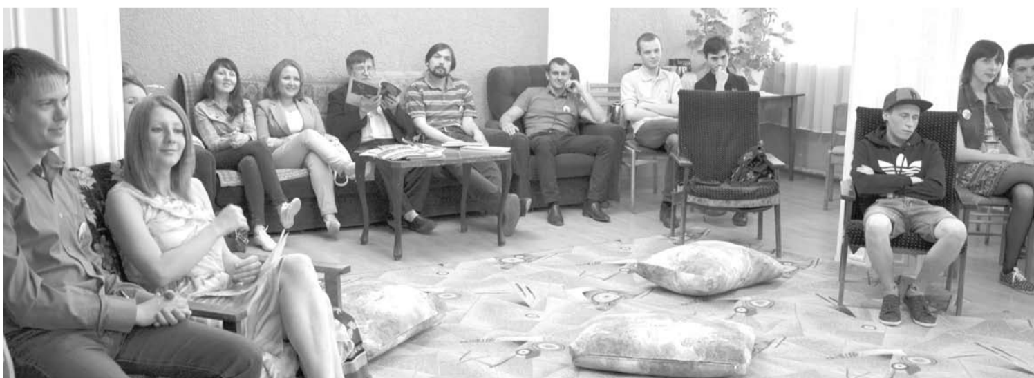
Обстановка квартиры погрузила гостей в далёкие советские годы.

К нашему сожалению, конкурс «Я тобою живу» не состоялся, так как для участия заявилась всего одна семейная пара.