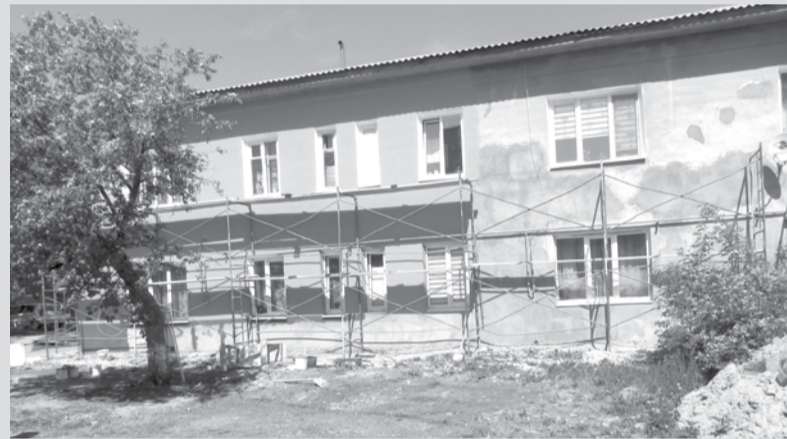
Идет ремонт фасада дома №4 на улице Железнодорожников.

По словам Игоря Заварзина, работы начаты на 18 из 28 домов, которые должны быть отремонтированы в 2016 году. Комиссия администрации качество выполненных работ сочла удовлетворительным.