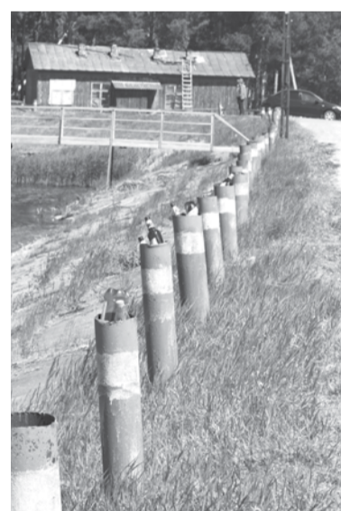
После отдыха на природе мусор надо за собой убирать, а не прятать в укромных местах.

Хочу добавить, что ежегодно за счет собственных средств я охраняю пруд от браконьеров, зарыбляю пруд ценными породами рыб, такими, как карп