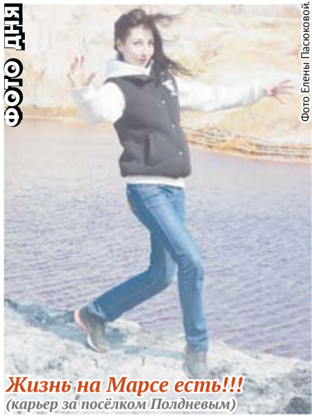
Жизнь на Марсе есть!!! (карьер за посёлком Полдневым)