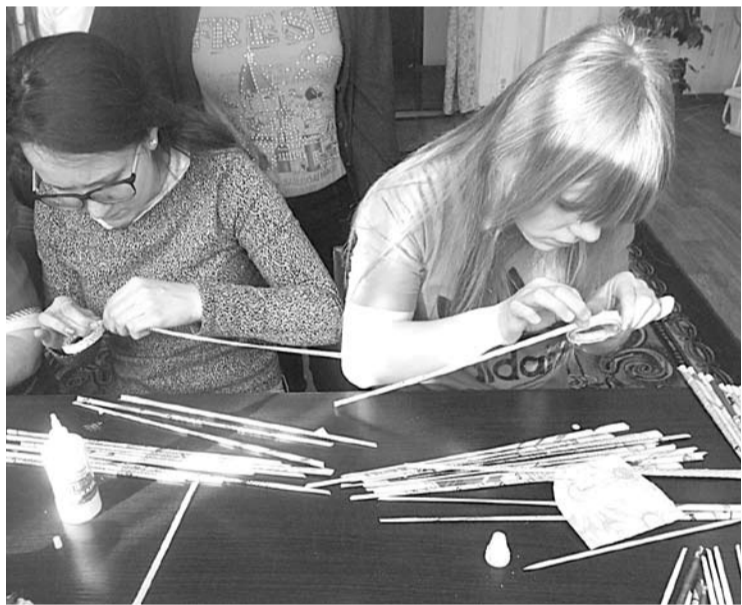
Во время каникул скучать не приходится. Старшие дети занимаются изготовлением поделок из подручных материалов, а младшие любят играть на детской площадке, которую помогли оборудовать воспитанники центра.