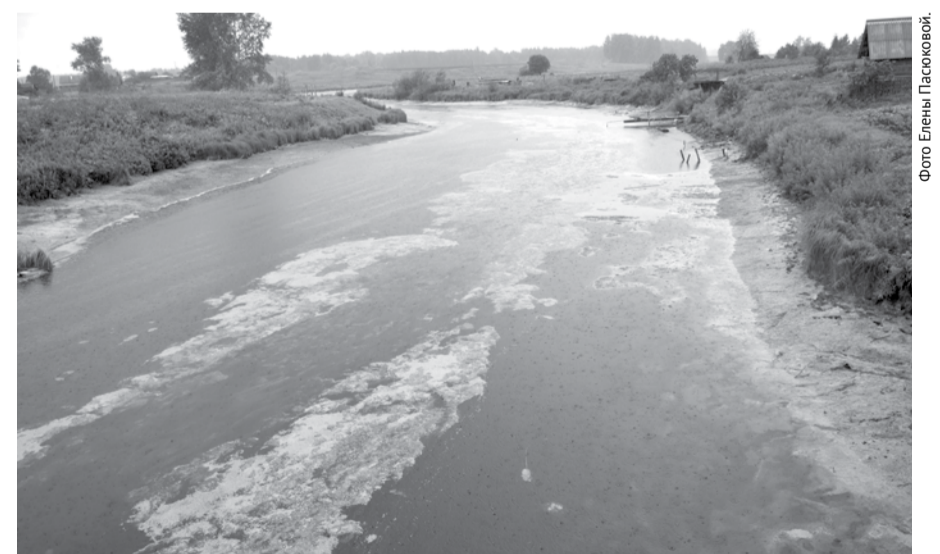
А вот так река Полдневая стала выглядеть уже 15 июля.

териала. Ждем наполнения водного бассейна. Если потребуется, будем производить пригрузку верхнего откоса жирной глиной для того, чтобы устранить крупные протечки воды внутри тела плотины. Ситуация