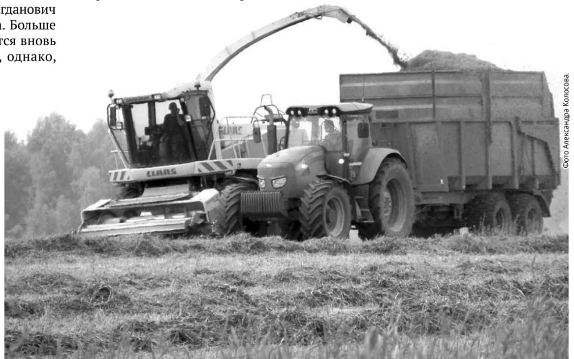
...а завершается подборкой подсыхшей зелёной массы комбоборочными комбайнами.