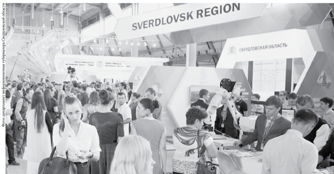
Стенд Свердловской области занял 800 кв. м и продемонстрировал экономическую и интеллектуальную мощь уральских промышленников.

С каждым годом Международная промышленная выставка ИННОПРОМ становится всё более интересной для топ-менеджеров и крупных инвесторов. По словам организаторов, здесь участвовали представители 95 стран. От страны-партнёра Индии в деловой программе приняли участие более 100 руководителей компаний. Китайская делегация насчитывала более 3 тысяч человек. Глава Минпромторга РФ Денис Мантуров также высоко оценил лоббистские усилия губернатора Среднего Урала по продвижению интересов свердловских промышленников. «Евгений Куйвашев активно продвигает продукцию предприятий региона не только на российском рынке, но и на межгосударственном уровне», – сказал Денис Мантуров.