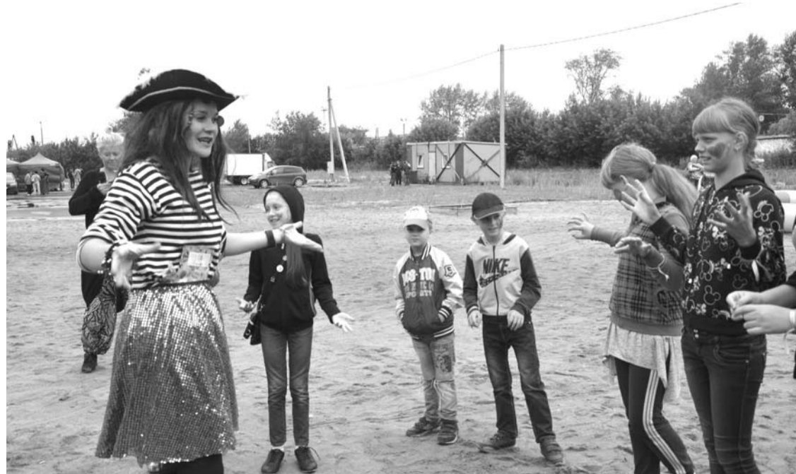
Игры и забавы со сказочными героями стали хорошим началом Дня металлурга.