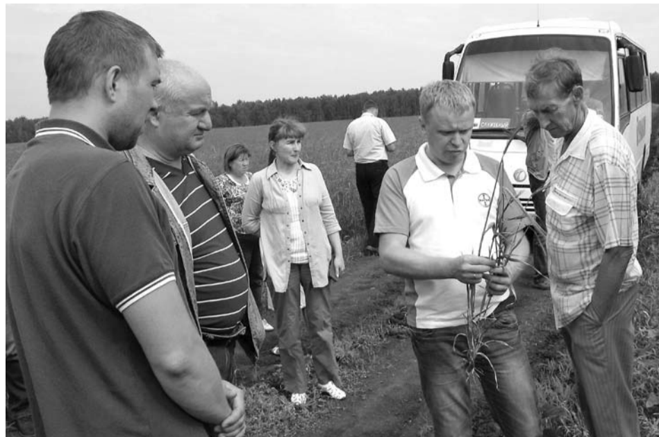
Участники смотра-конкурса изучают посевы пшеницы сорта «Ирень».

Далее автобус с участниками двигался по полям ООО «НП «Искра». Пшеница сорта «Омская 36» на «искровских» полях и посевы ячменя сорта «Ача», при том, что это самая большая площадь элитного ячменя по управлению в размере 600 гектаров,