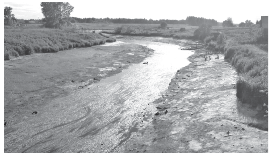
Так плачевно выглядела река Полдневая в конце июня.

В настоящее время в границах деревни Щипачи построена временная плотина из крупнообломочного ма-