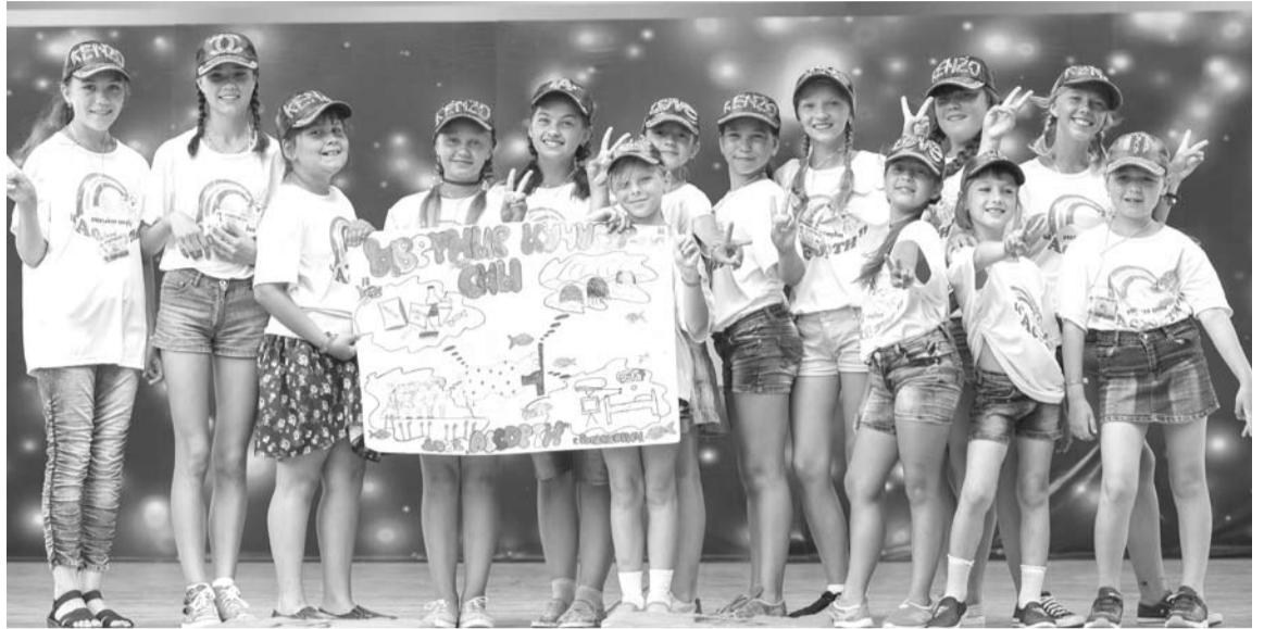
В очередной раз детская образцовая студия «Ассорти» вернулась домой с победой.