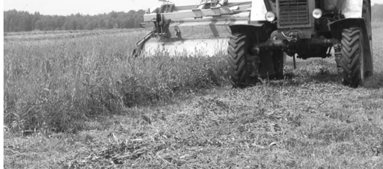
Заготовка сена в СПК «Колхоз имени Свердлова» начинается со скаса многолетней травы...

одну условную голову КРС. Это 13 процентов от плана. Темпы заготовки кормов в этом году на уровне 2015 года. План по заготовке кормовых культур составляет 30 центнеров единиц на одну условную голову. Погодные условия и хорошие темпы работ позволяют надеяться на своевременную и полноценную заготовку кормов.