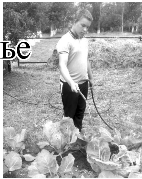
Ребята с удовольствием работают на приусадебном участке центра, где ими посажены картофель, капуста, зелень.

– Очень важно, чтобы наши дети чувствовали, что они не одни в этой