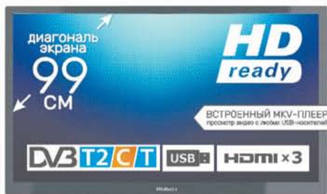
LED-телевизор Roisen RL-39D1307T2C