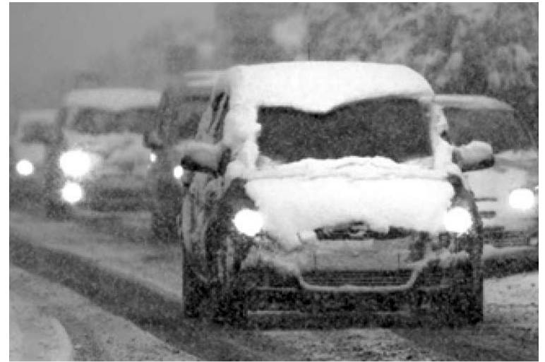
Не снег должен ехать на машине, а машина по снегу. Безопасность - в руках водителя.