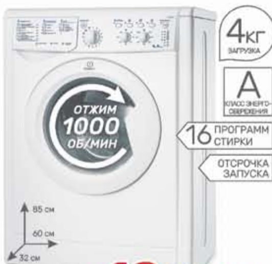
Стиральная машина Indesit IWUC 4105