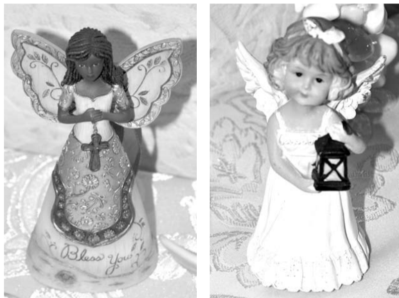
Милые ангелы уютно устроились в совете ветеранов.

Посетители совета ветеранов с удовольствием знакомятся с коллекцией ангелов из разных стран.