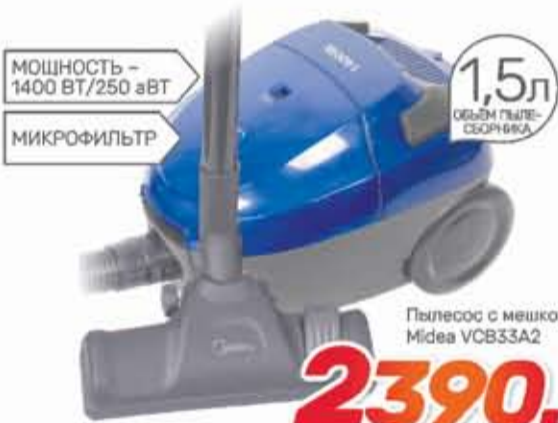
Пылесос с мешком Midea VCB33A2