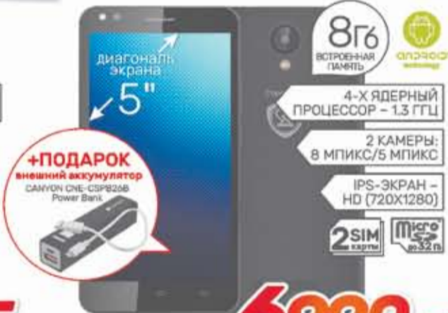
Смартфон Prestigio MUZE C3 3504 DUO