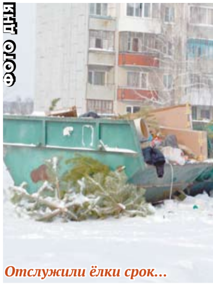
Отслужили ёлки срок...