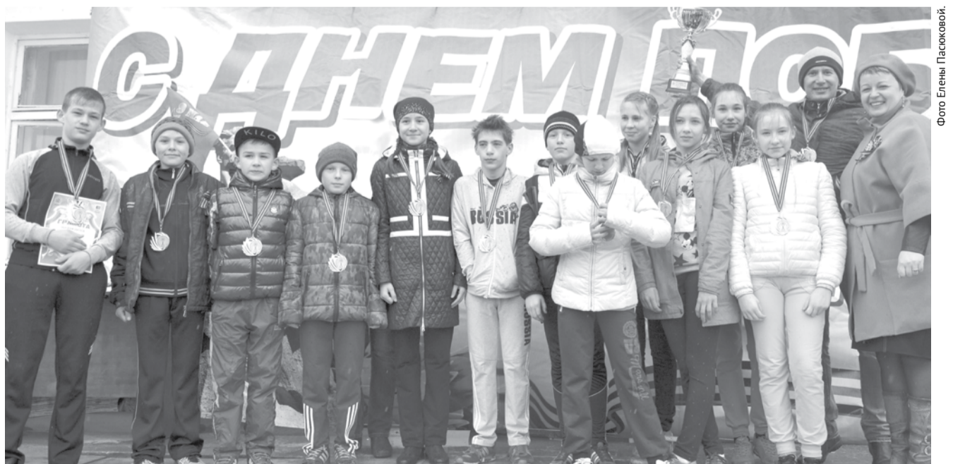
С 1996 года школа № 5 становится победителем некоторых этапов традиционной легкоатлетической эстафеты, посвященной Дню Победы, на призы газеты «Народное слово». На фото: команда 5-6 классов - победительница эстафеты в 2015 году.