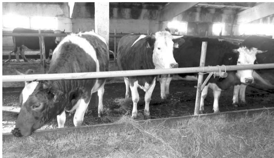
От коров породы симменталов фермеры получают и мясо, и молоко.

Холодные и дождливые весна и лето прошедшего года привели к