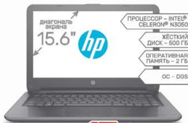
Ноутбук HP 15-ac001ur