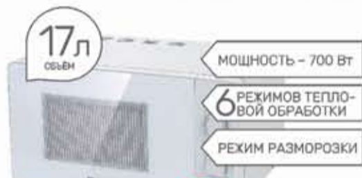
СВЧ-печь Roisen MS 1770MW