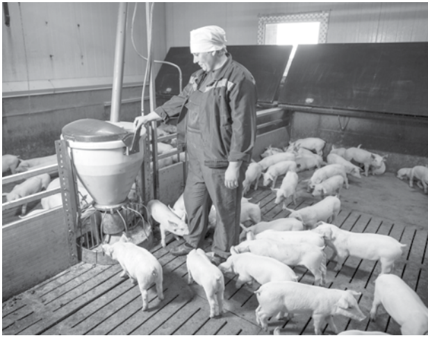
К 28 дню поросята, как правило, уже способны питаться самостоятельно.