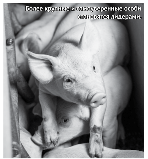
Более крупные и самоуверенные особи становятся лидерами.