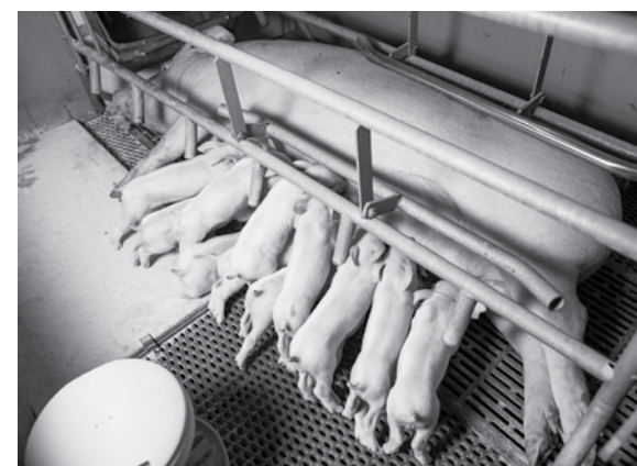
У каждой мамы оставляют не более 14 поросят — по числу сосков.

Новорожденного поросенка оператор первым делом вытирает насухо и подносит к соску матери, чтобы малыш получил свою первую порцию молозива. С этой ценнейшей биологической субстанцией в организм поросенка поступают не только все необходимые питательные вещества, но и иммунные клетки матери, которые будут защищать его первое время. У каждой мамы оставляют не более 14 поросят — по числу сосков. Так что, если родилось больше — их подсаживают другим свинкам. Вообще, размер имеет значение — поросят после рождения делят по весу и крупности. Тех, что помельче, подсаживают к более молочным свиноматкам — чтобы более крупные и настырные не мешали им хорошо набирать вес. Тех, кому молока все же недостаточно, допаивают дополнительно. Операторам приходится быть очень внимательными и делать все очень быстро — на двух фермах «Уральского» содержатся 14 тысяч свиноматок, которые позволяют свинокомплексу круглогодично поддерживать численность поголовья в 200 тысяч поросят.