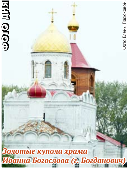
Золотые купола храма Иоанна Богослова (г. Богданович)