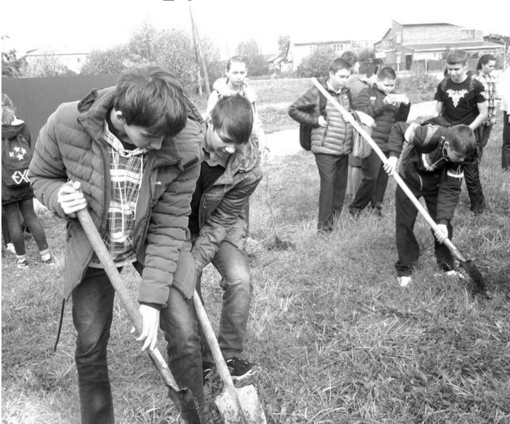
В акции «Посади дерево памяти» приняли участие школьники с 4 по 11 класс.