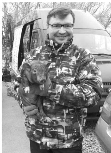
Поросят на ярмарку привезли из Тыгиша.

P.S. Ярмарка в северной части города пройдёт 15 октября у СК «Колорит». Официальное открытие – в 10 часов, торговать начнут раньше.