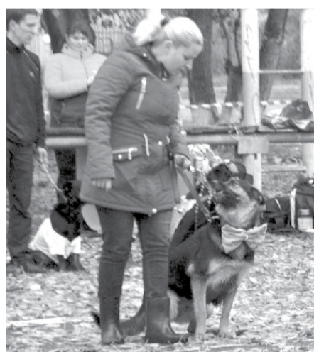
Немецкая овчарка Ария вышла на «подиум» с большим ярким бантом.

Совсем неважно, какой породы собака, преданность, верность и беззаветная любовь к своему хозяину – все эти качества лохматых питомцев от породы не зависят.