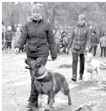
Собаки проходят по кругу, демонстрируя зрителям умение выполнять команды своих хозяев.