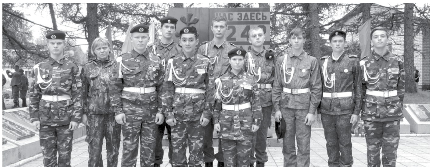
Поисковики из отряда «ЗОВ» (Кунарская школа) и других городов Свердловской области выполняют большую работу по увековечиванию памяти погибших защитников Отечества.

- Я бросил курить, когда стал подрастать мой сынишка. Я хочу, чтобы он был здоровым и счастливым. А отец, который курит, никогда не сможет убедить сына, что это плохо. Только личным примером можно добиться результата в воспитании.