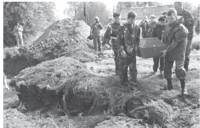
Найденные останки солдат поисковики захоронили должным образом.

В будущем году отряд «ЗОВ» планирует принять участие в новой экспедиции, организованной в рамках акции «Вахта памяти» в Нижегородскую область. К сожалению, в настоящее время у отряда отсутствует оборудование, которое необходимо для поисковых работ, а именно металлоискатели, лопаты и щупы. Ребята очень надеются, что в нашем городском округе найдутся неравнодушные к их работе люди, которые смогут им помочь решить эту проблему.