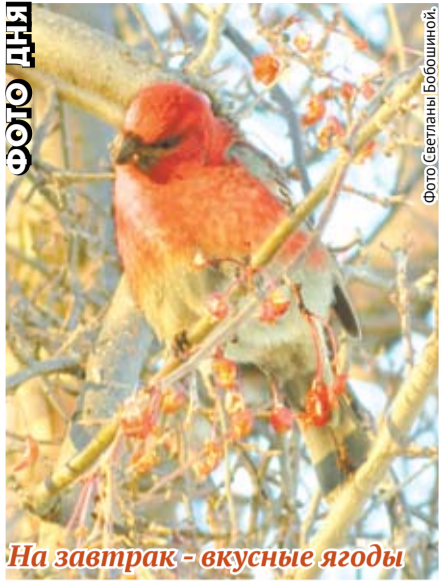
На завтрак - вкусные ягоды