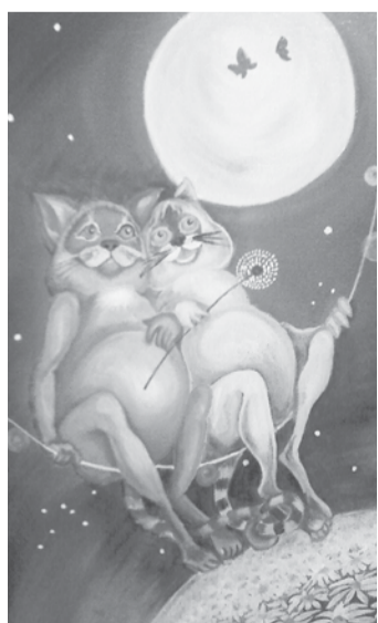
Автор картины Светлана Сизикова. Холст, масло.

Вся роща в одеянье белом - Украсилась, как на показ, Берёзки ровным частоколом Белеют так, что слепит глаз. А гроздь красные рябины, Надевшей снежный свой наряд, Как драгоценные рубины, На платье свадебном горят!