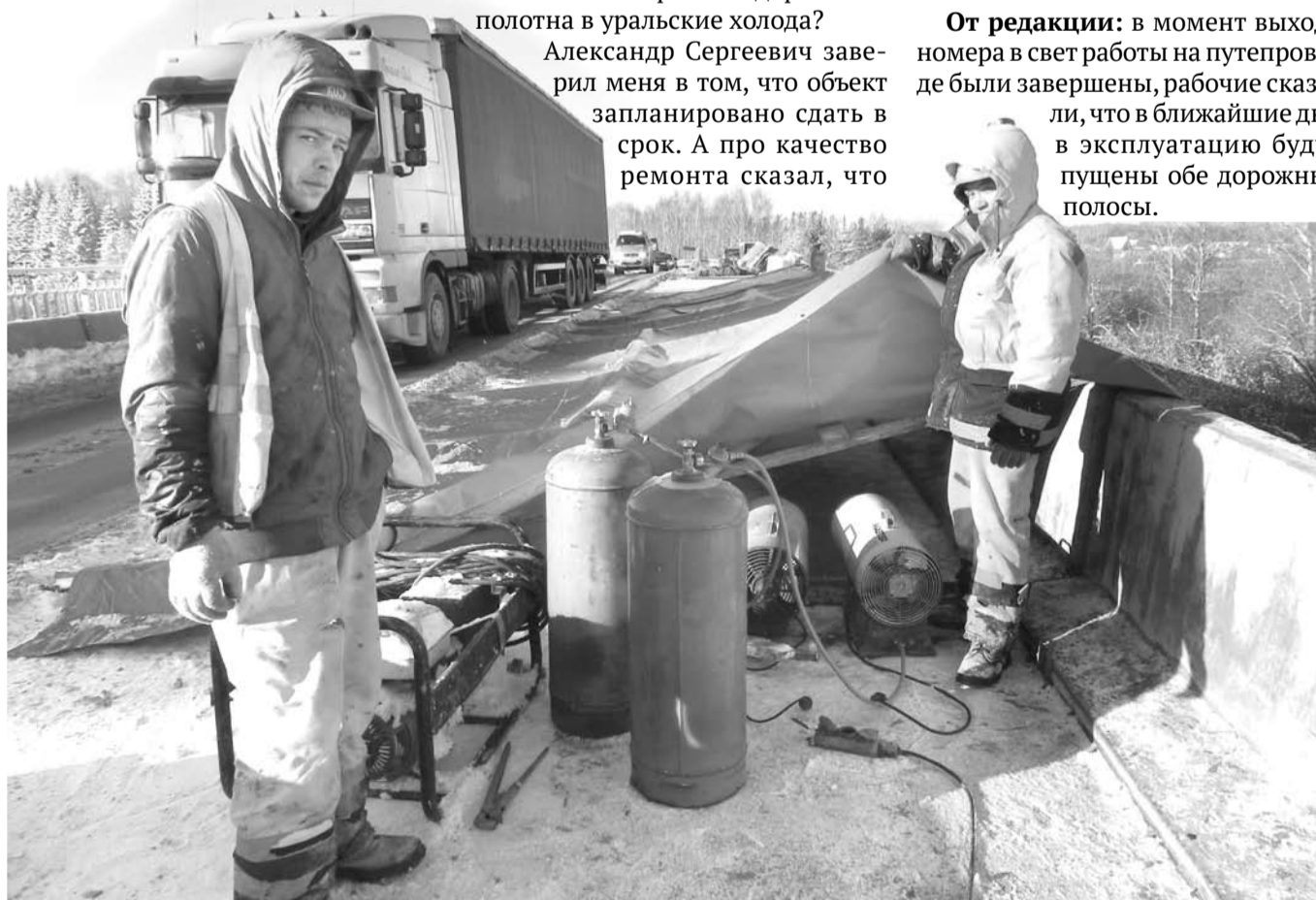
В ходе ремонта путепровода для прогрева укладываемого полотна дороги применялись газовые тепловые пушки и пластиковые пологи.

От редакции: в момент выхода номера в свет работы на путепроводе были завершены, рабочие сказали, что в ближайшие дни в эксплуатацию будут пущены обе дорожные полосы.