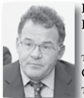
Первый вице-губернатор Владимир Тунусов

За Алексеем Орловым будут закреплены промышленность, инвестиции, агропромышленный комплекс, наука, природный и ресурсный потенциал региона.