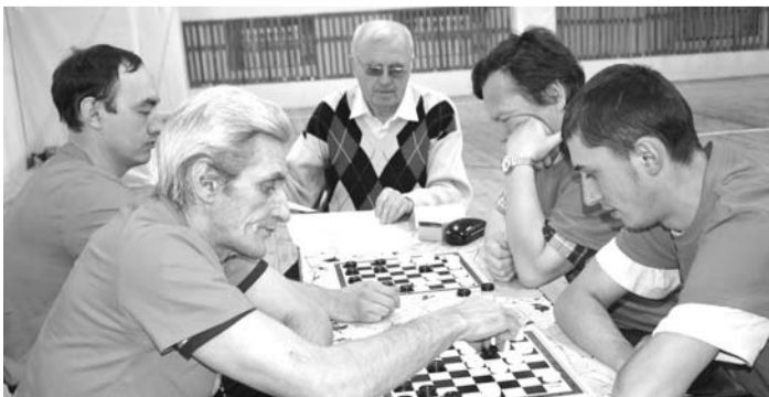
Игра в шахки требует сосредоточенности.

Закончился праздник концертом и чаепитием.