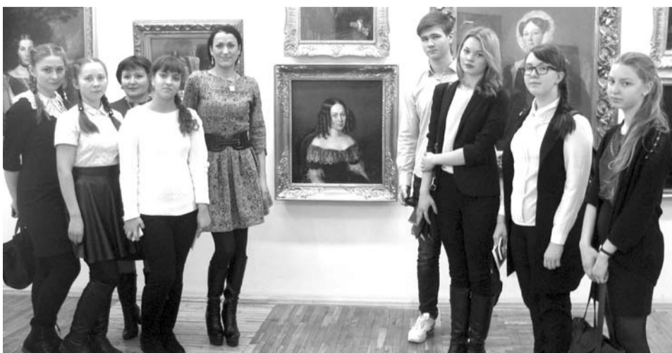
Победители конкурса «Молодёжь планирует бизнес» из Богдановича сфотографировались на память в здании правительства Свердловской области.

В качестве подарков авторы лучших проектов получают возможность пройти стажировку в известных компаниях, многие ребята получили сертификаты на обучение на предпринимательских курсах.