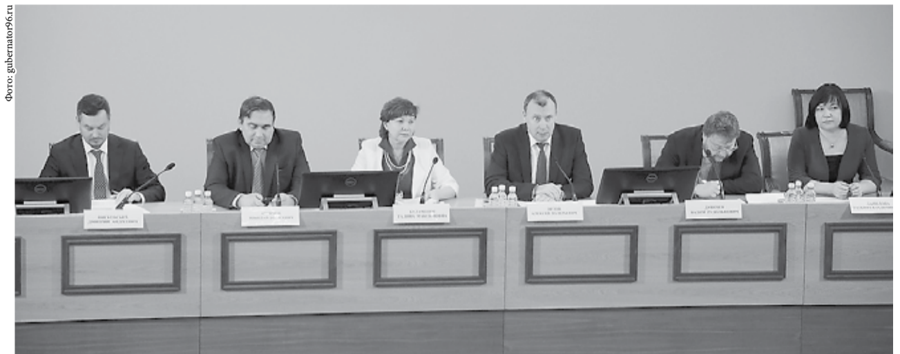
Первый вице-губернатор Алексей Орлов: «Социально-экономическое развитие, повышение инвестиционной привлекательности и качества жизни уральцев и низкий уровень жалоб от населения – всё это является показателем эффективности деятельности органов местного самоуправления».