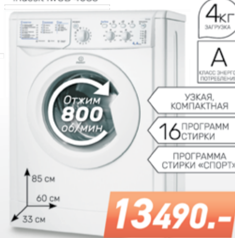
Стиральная машина Indesit IWUB 4085

4 кг ЗАГРУЗКА А КЛАСС ЭНЕРГОПОТРЕБЛЕНИЯ УЗКАЯ, КОМПАКТНАЯ 16 ПРОГРАММ СТИРКИ ПРОГРАММА СТИРКИ «СПОРТ»