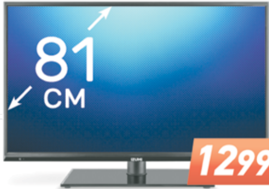
LED-телевизор Izumi TLE32H104B