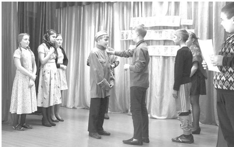
Ученики 6 класса показали сценку о том, как провожали солдата на войну, давали ему наказ, пели прощальную песню.