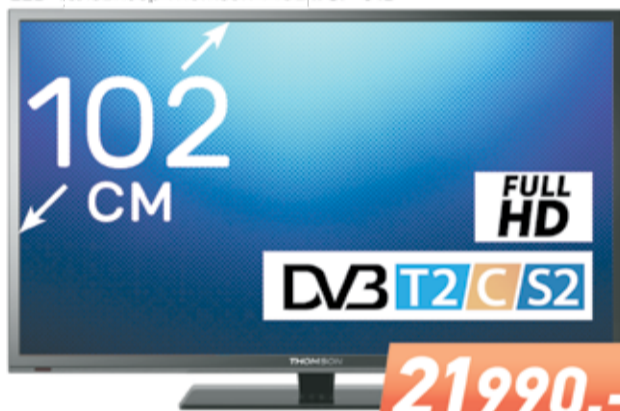
LED-телевизор Thomson T40D17SF-01B