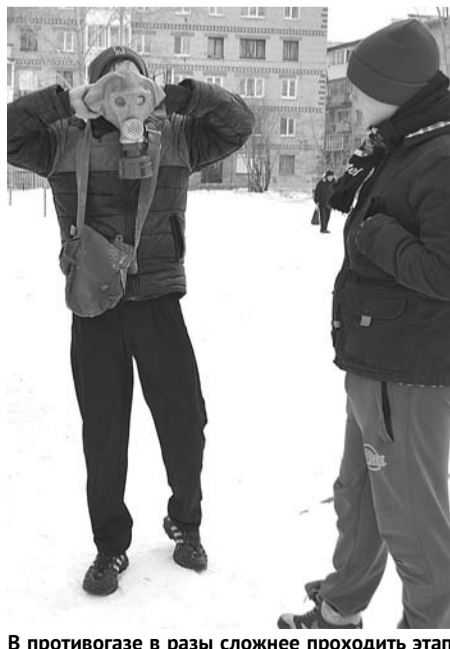
В противогазе в разы сложнее проходить этапы эстафеты.