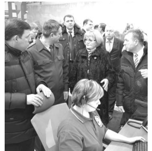
Руководители региона осмотрели новый центр, оснащенный современным высокотехнологичным оборудованием