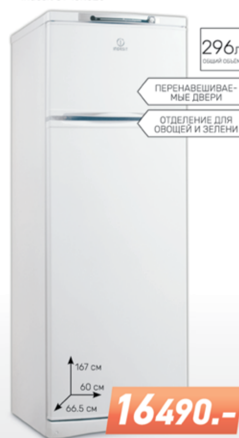
Холодильник Indesit ST 167.028

296л ОБЩИЙ ОБЪЕМ ПЕРЕНАВЕШИВАЕМЫЕ ДВЕРИ ОТДЕЛЕНИЕ ДЛЯ ОВОЩЕЙ И ЗЕЛЕНИ