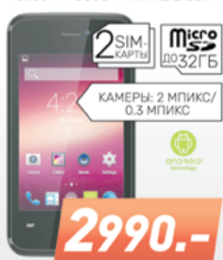
3G смартфон Texet TM-3500 X-mini 2 Black

2 SIM-КАРТЫ Micro SD до 32 Гб КАМЕРЫ: 2 МПКС / 0.3 МПКС