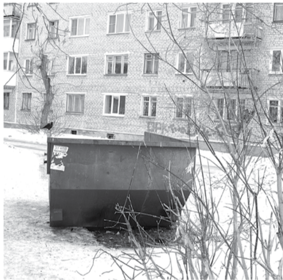
Бункер для ТБО расположен в 20 метрах от дома...

- Граждане, проживающие в домах №№14, 16 и 18 на улице Партизанской, неоднократно просили нас организовать место сбора твердых бытовых отходов (ТБО) вблизи своих домов. Удовлетворяя их просьбу, мы рассмотрели несколько вариантов установки бункера для ТБО, но все они по разным причинам были отклонены, оптимальным местом было признано ныне существующее. Бункер в этом месте установлен в соответствии с требованиями санитарных правил - на расстоянии 20 метров от жилого дома. Плотность застройки, при которой пятиэтажные дома находятся на небольшом расстоянии друг от друга и не имеют обширных пустырей, не позволяет выполнить все пожелания жильцов по установке контейнерных площадок.