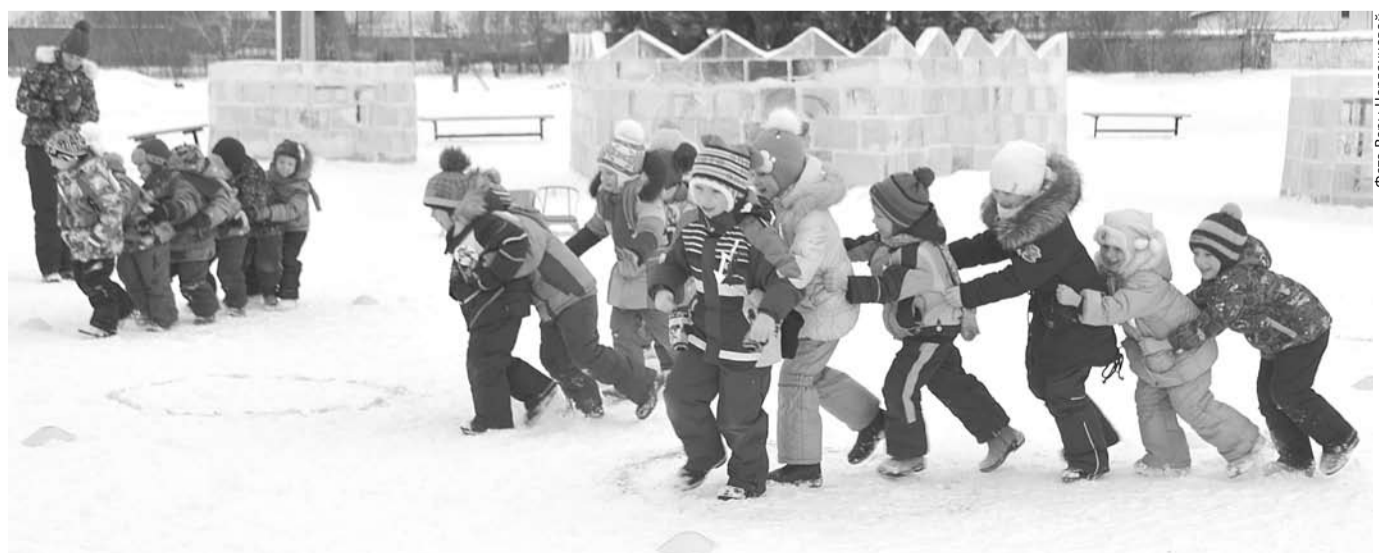
Всем было очень весело, когда, построившись «змейкой», команды преодолевали препятствия.

проходили при бурной поддержке болельщиков, в рядах которых были воспитанники, сотрудники детсада, родители, бабушки и дедушки. Они держали плакаты с названиями команд, скандировали «кричалки», аплодировали, свистели, гудели. Словом, как могли, поддерживали спортсменов. Впрочем, вскоре и болельщикам представилась возможность проявить себя: они станцевали весёлый танец «Ку-ку», приняли участие в конкурсе «Разноцветные флажки», а в конце соревнований вместе с участниками выполнили забавные упражнения под ритмичную музыку. По итогам соревнований все ребята получили медали и сладкие призы. После такого активного отдыха обед в детском саду был особенно вкусным, а сон в тихий час - сладким и крепким.