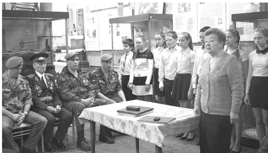
Встреча в краеведческом музее прошла под песни и стихи учеников школы №3.

Нигде гостей не отпустили без подарка: на каждой встрече дети читали стихи, пели песни и поздравляли с наступающим Днём защитника Отечества.