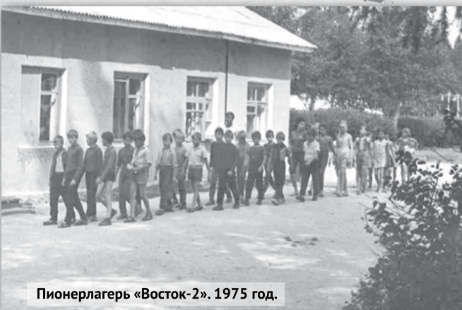
Пионерлагерь «Восток-2». 1975 год.

«Большевистское слово» от 09 августа 1949 года №32.