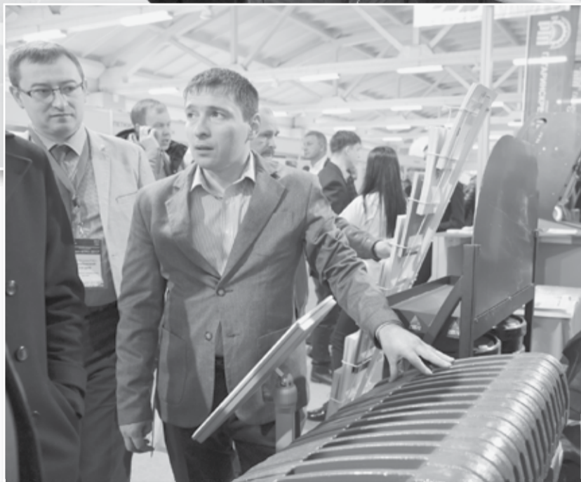
Представитель российской корпорации «Русские машины» знакомит посетителей выставки с новой системой охлаждения трактора MF6713, которая позволяет машине работать практически без перегрева.