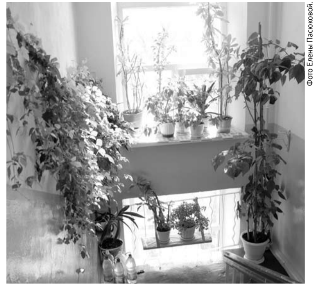
Подъезд № 1 многоквартирного дома № 21 на улице Первомайской.

Своим порядком и красотой в подъезде могут похвастаться и жильцы дома №21 на улице Первомайской. В подъезде №1 на четвертом этаже расположилась целая цветочная оранжерея. Каких