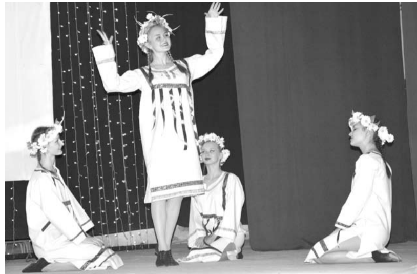
Каждый номер коллектива «Детское счастье» красочный и яркий.

За годы существования коллектив добился огромных успехов. В его копилке много дипломов и кубков победите-