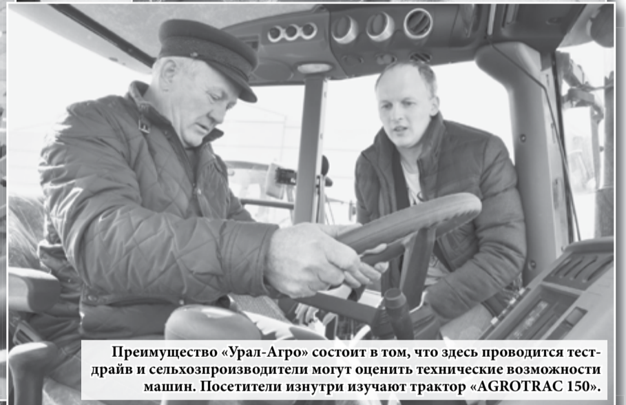
Преимущество «Урал-Агро» состоит в том, что здесь проводится тест-драйв и сельхозпроизводители могут оценить технические возможности машин. Посетители изнутри изучают трактор «AGROTRAC 150».