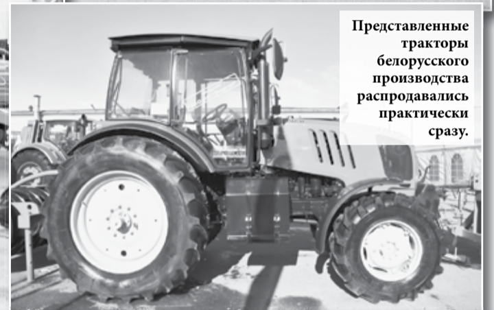
Представленные тракторы белорусского производства распродавались практически сразу.