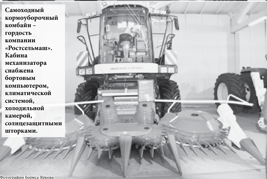
Самоходный кормоуборочный комбайн – гордость компании «Ростсельмаш». Кабина механизатора снабжена бортовым компьютером, климатической системой, холодильной камерой, солнцезащитными шторками.