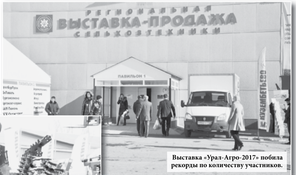
Выставка «Урал-Агро-2017» побила рекорды по количеству участников.

Часть техники приобретена и появится в полях региона уже в этом году. По словам губернатора области Евгения Куйвашева, на покупку новой техники и оборудования из бюджета направят 330 миллионов рублей. Кроме того, продолжится практика субсидирования приобретения техники по договорам лизинга.