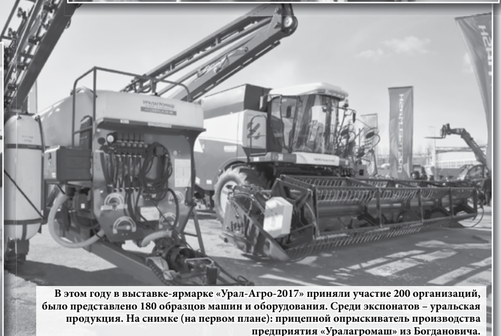
В этом году в выставке-ярмарке «Урал-Агро-2017» приняли участие 200 организаций, было представлено 180 образцов машин и оборудования. Среди экспонатов – уральская продукция. На снимке (на первом плане): прицепной опрыскиватель производства предприятия «Уралагромаш» из Богдановича.