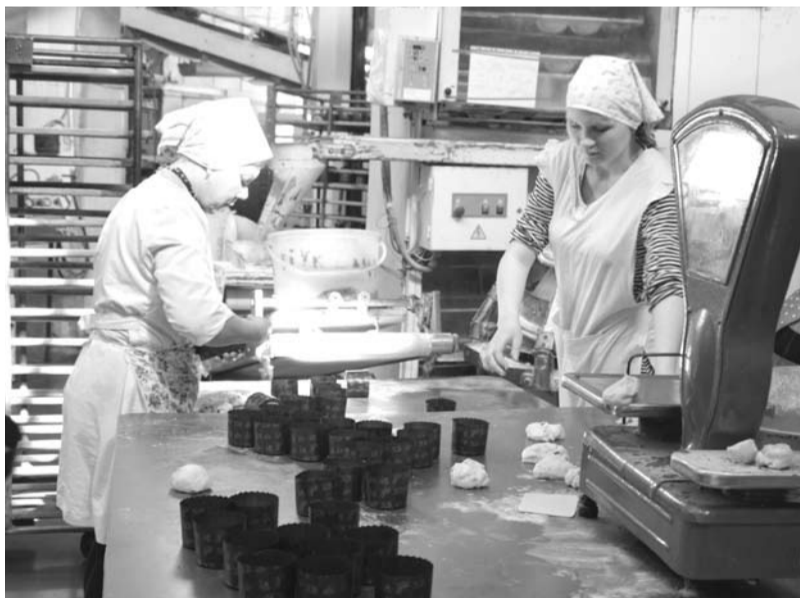
Работники предприятия изготовили более 12 тысяч куличей, которые попадут не только на стол богдановичцев, но и в соседние города и населенные пункты.