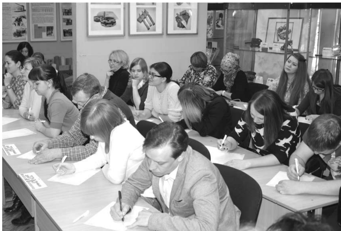
Одной из площадок для тотального диктанта стал краеведческий музей.

Свою оценку каждый участник сможет узнать после 14 апреля на официальном сайте тотального диктанта.