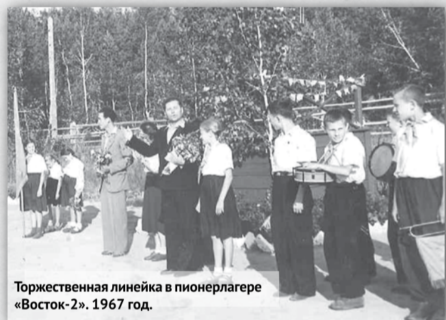
Торжественная линейка в пионерлагере «Восток-2». 1967 год.