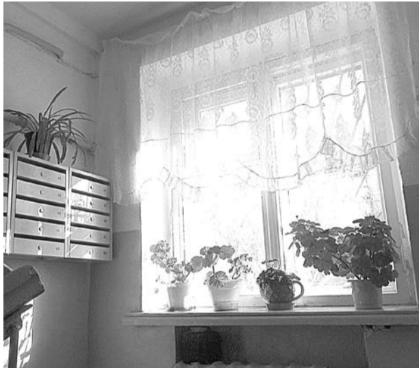
Подъезд № 3 многоквартирного дома № 14 на улице Партизанской.

Пятиэтажек, разменявших седьмой десяток, в Богдановиче немало, а образцовые подъезды еще поискать надо. За порядком в подъезде №3 дома № 14 на улице Партизанской следят все: от молодых семей до людей почтенного возраста. На лестничных пролетах никакого мусора, жильцы