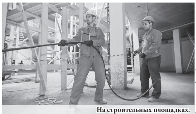
На строительных площадках.

Ещё одно направление работы правительства области – расселение ветхого и аварийного жилья. С 2013 года расселено более 12 тыс. человек. Ликвидировано 196 тыс. м 2 аварийного жилья. До 1 сентября 2017 года весь аварийный жилой фонд, признанный таковым по состоянию на 1 января 2012 года и входящий в реестр, должен быть полностью расселён.