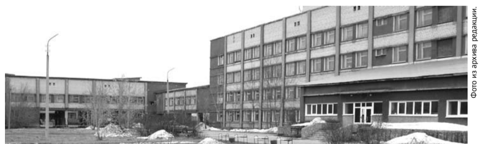
В планах на ближайшие пять лет богдановичской больнице предстоит провести реконструкцию.

– Как я уже сказала, один рентгеновский аппарат будет работать в хирургическом корпусе, где будет приёмный покой и детское отделение, а второй – в поликлиническом комплексе, в состав которого войдут две поликлиники – взрослая и детская. Детская поликлиника разместится на первом этаже