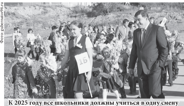
К 2025 году все школьники должны учиться в одну смену

В области начался перевод школ на односменный режим обучения. В 2016 году создано 3700 новых учебных мест, введена в строй первая очередь самой крупной и современной школы области в районе «Академический» (г. Екатеринбург).