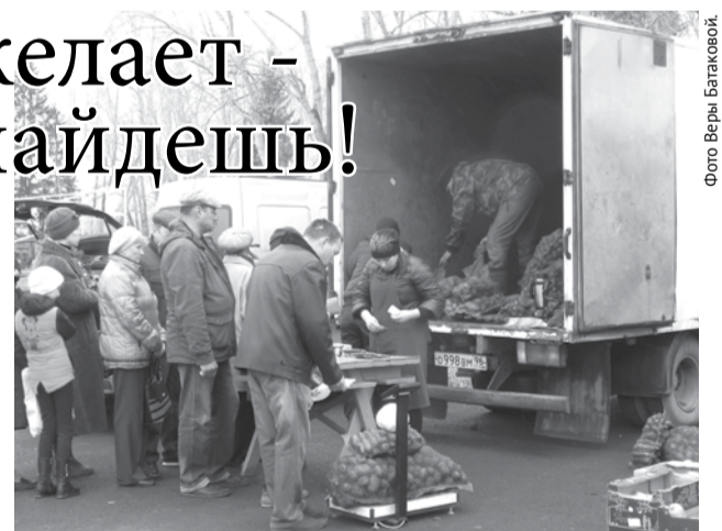
Самые длинные очереди были у прилавков с овощами и картофелем.

Большим спросом у горожан пользовалась мясная и рыбная продукция. На ярмарке было представлено разнообразие копченой и вяленой рыбы (горбуша, сельдь, кета и многое другое) из Асбеста и Артей. Большой выбор мясной продукции, как свежей, так и копченой, представили индивидуальные предприниматели из поселка Полдневого, сел Гарашкинского, Кунарского. В широком ассортименте была представлена молочная продукция, продукты пчеловодства, сладости. Продавались саженцы плодовых деревьев, кустарников, ягод и цветов, а также