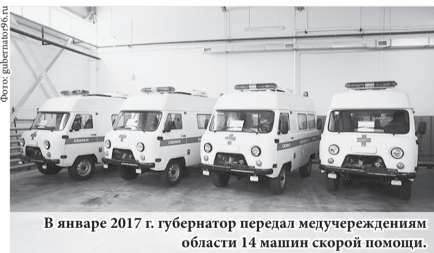
В январе 2017 г. губернатор передал медучреждениям области 14 машин скорой помощи.

В ближайшие годы предстоит решить проблему очередей в поликлиниках, обеспечить каждую больницу достаточным количеством «узких» специалистов. По словам губернатора, также нуж-