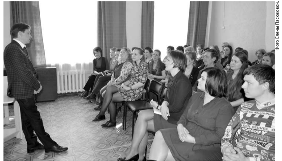
Встреча с работниками учреждений культуры проходила в теплой и непринужденной обстановке.