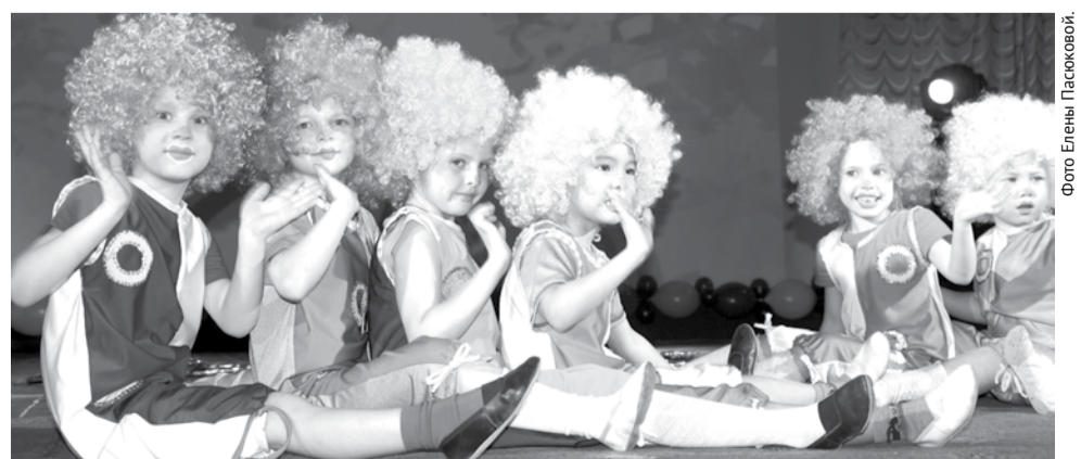
Маленькие циркачи из ДШИ порадовали зрителей весёлым номером.

В перерывах между номерами ведущие проводили розыгрыш сувениров среди зрителей. Не обошлось без шуток и смеха. Закончилось мероприятие красочным шоу мыльных пузырей, в котором приняли участие и маленькие зрители.