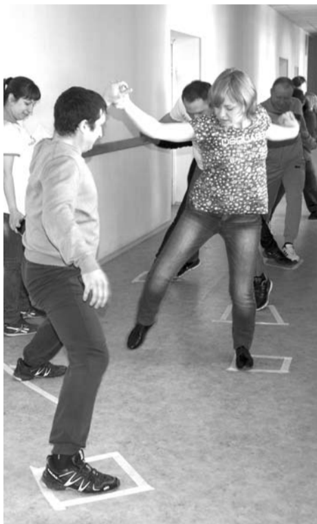
Не так просто пришлось участникам игры, но они справились со всеми испытаниями.