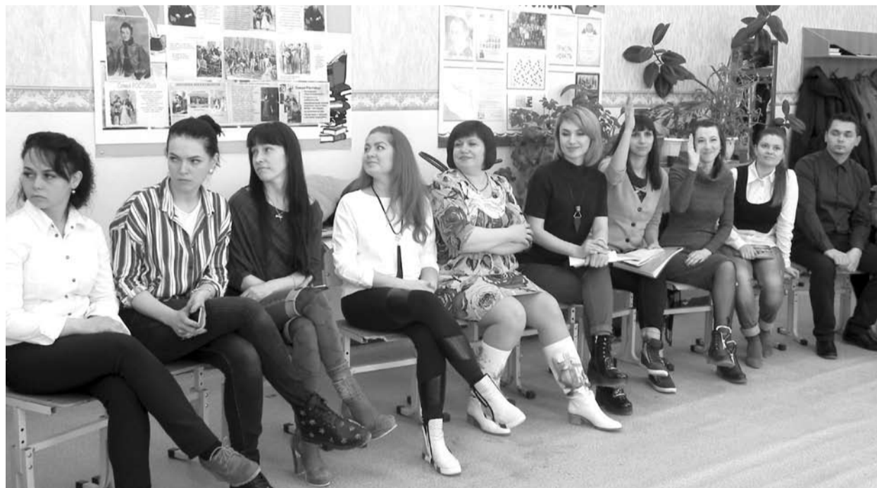
На одном из тренингов предприниматели делились разработками своих бизнес-идей.