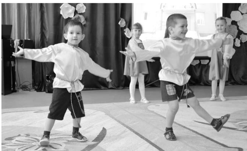
На «Фестивале добрых дел», завершающем Неделю открытых дверей, воспитанники детского сада «Радуга детства» подарили гостям яркие творческие номера.