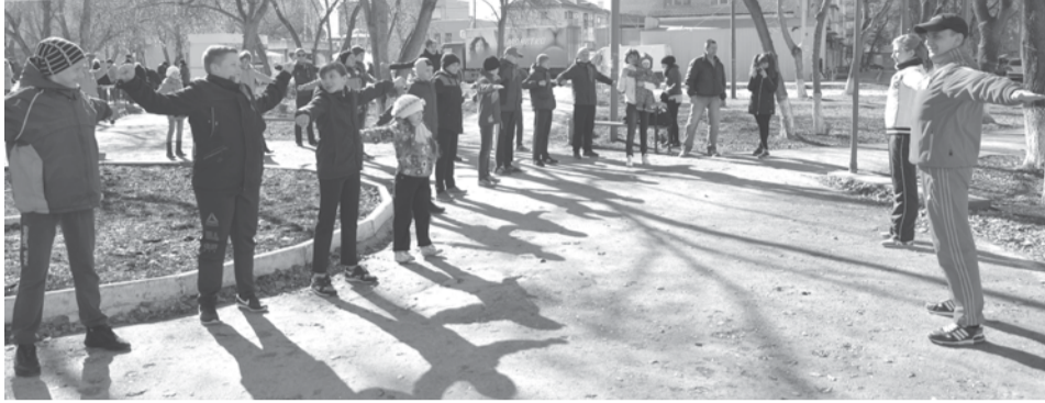
Вдох глубокий, руки шире...