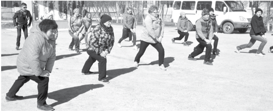
... не спешите, три-четыре...

Чуть позже такая зарядка прошла в северном микрорайоне у филиала ДШИ. Здесь народа собралось поменьше, но все с большим энтузиазмом и на удивление прохожих выполняли упражнения.