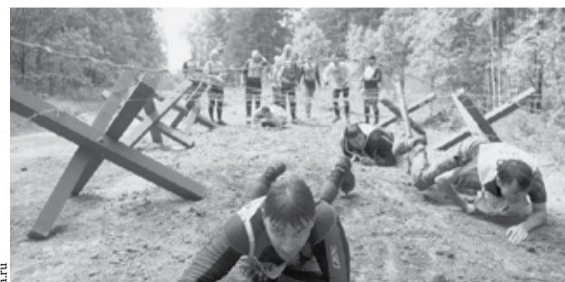
Протяжённость трассы «Гонки героев» в этом году составит более 9 км.

Напомним, «Гонка Героев» – новый для страны формат спортивного соревнования. Проект создан при поддержке Минобороны России, и главная цель мероприятия – привлечь к здоровому образу жизни молодёжь и поднять имидж российской армии. В 2016 году Министерство обороны России обратилось к главе региона Евгению Куйвашеву с просьбой о расширении географии «Гонки героев». Военное ведомство и организаторы объяснили это «популярностью соревнований среди жителей Урала». Было принято решение организовать старты.