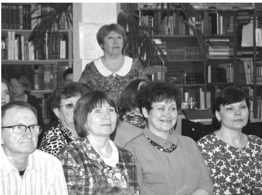
На «Библионочь» собралось много «ночных» читателей.

Награждения прерывались выступлениями богдановичских артистов. После приятной церемонии началась фото-