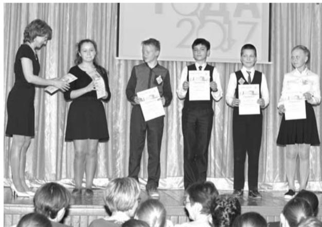
Награждение участников конкурса «Ученик года-2017».