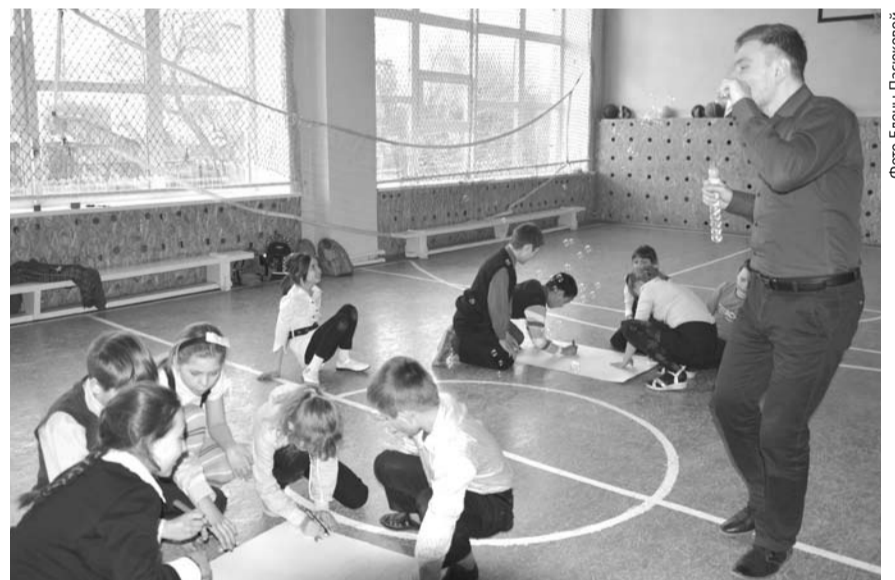
В ходе акции «Добро семьям, счастье детям!» для детей была устроена масса развлечений.

В рамках акции жители села проконсультировались со специалистами центра занятости и Пенсионного фонда. Студенты-парикмахеры Богдановичского политехникума сделали стрижки людям старшего поколения. Специалисты отдела провели с учащимися беседы на темы «Основы волонтерства» и «Я здоров!». Для самых маленьких жителей была организована игровая программа.