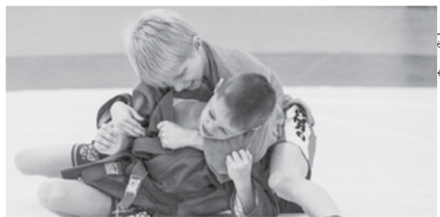
34 уральских города станут пилотными площадками проекта «Самбо в школу».