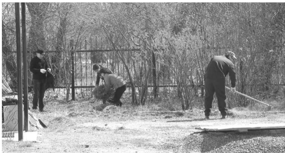
Дружным коллективом сотрудники ЕДДС приступили к уборке территории своего учреждения.