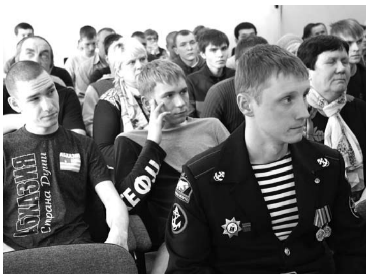
Призывники получили добрые напутствия.