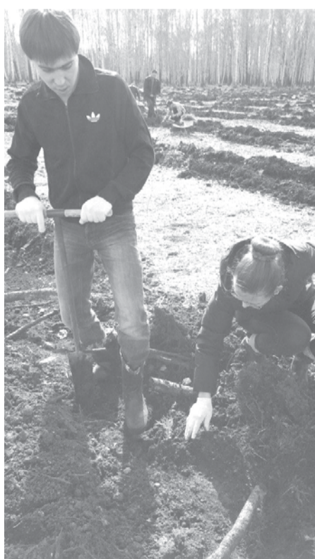
Лесопосадки проводились под руководством Богдановичского участкового лесничества. К мероприятиям, проходящим в рамках Года экологии, могут присоединиться все желающие. С планом мероприятий можно ознакомиться на официальном сайте ГО Богданович (постановление № 803 от 24.04.2017 г.)