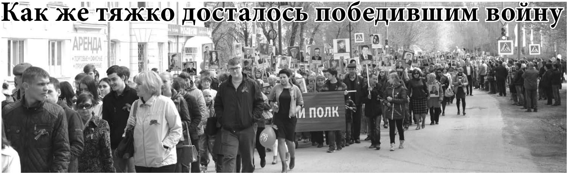
9 мая богдановичцы вышли на улицы города, чтобы почтить память героев войны.

Окончание. Нач. на 2-3-й стр. товарищей, которые теперь в строю «Бессмертного полка».