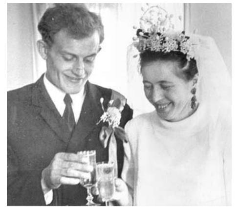
После регистрации брака – бокал шампанского.