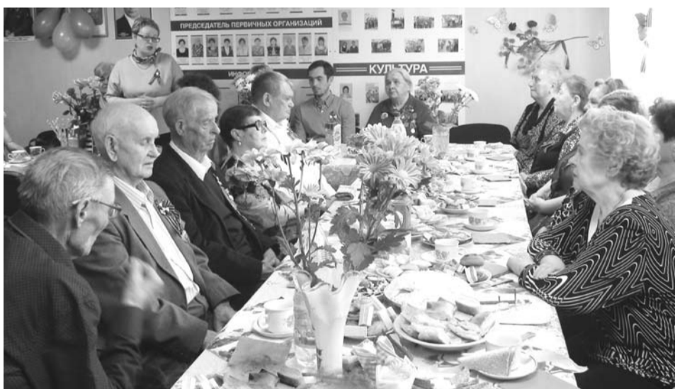
В городской организации «Всероссийского общества инвалидов» прошло праздничное мероприятие, посвященное Великой Победе.