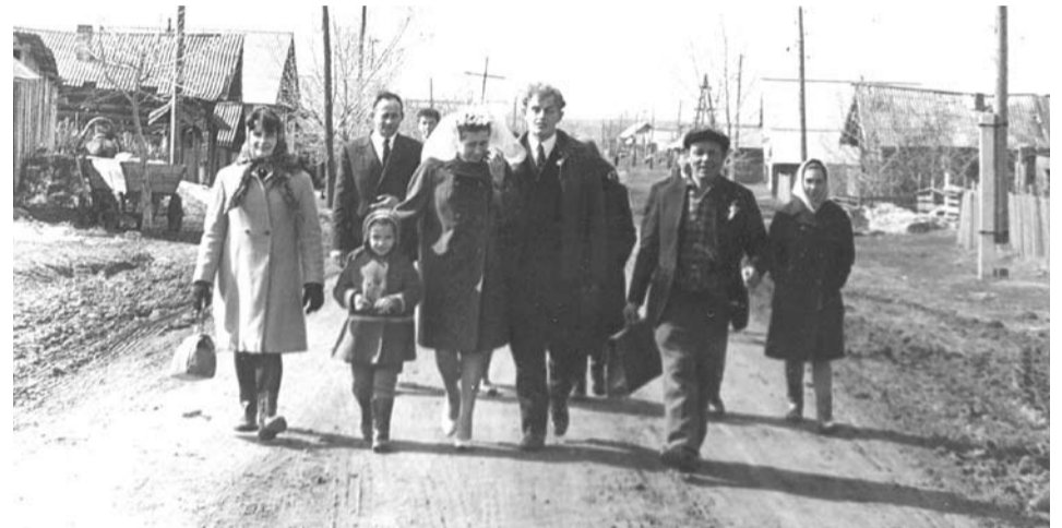
Молодые и гости идут в сельский Совет, чтобы зарегистрировать брак.