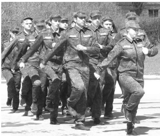
Команда школы №2 показала строевую подготовку.

Среди сельских школ первое место заняла Тыгишская школа, второе – Барабинская, на третьем месте – Волковская.