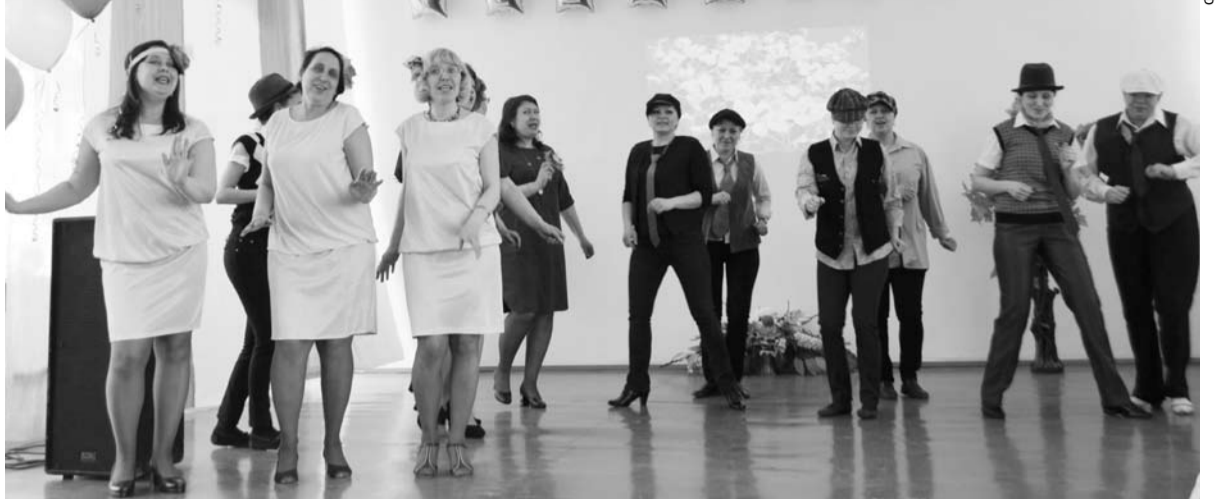
Педагоги центра развития ребёнка «Сказка» исполнили песню «В краю магнолий».