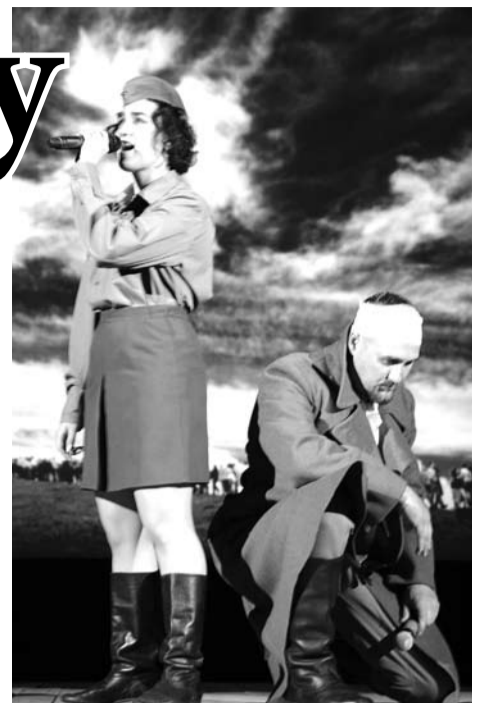
Артисты рассказали песнями историю войны.