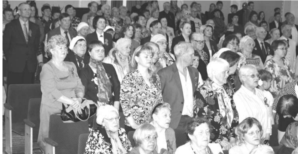
Минута молчания. Зал встал.

организован огнеупорным заводом при поддержке администрации ГО Богданович. В испытаниях на силу, ловкость, знание истории, строевую подготовку и выносливость приняли четыре команды: ОМВД, Ермак, «Вторая эскадрилья» (ВЭС) и «Тайфун» («Огнеупоры»).