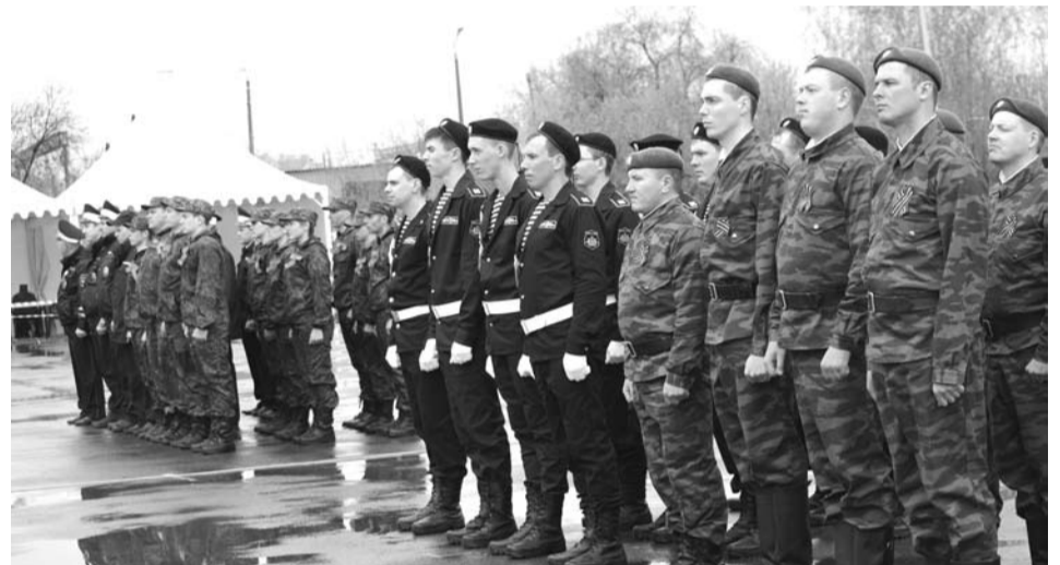
Команды-участники конкурса «Солдатская звезда»...