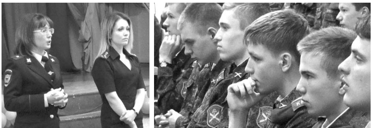
Полицейские подробно рассказали кадетам об их правах и обязанностях.