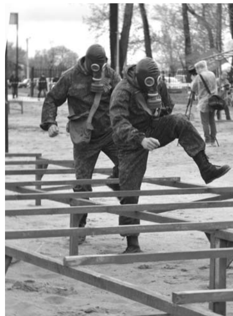
...прошли немало суровых испытаний.