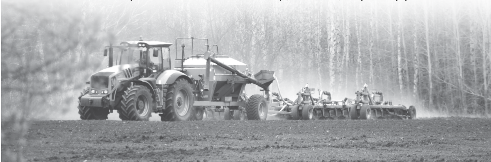
Один комплекс посевного агрегата сеет за день 60 гектаров.

тофеля, планируется посадить около 150 гектаров клубней. Посадка свеклы и капусты начнется в конце мая. Главное для аграриев сейчас, чтобы не было засухи, прошли дожди, земле катастрофически не хватает влаги.