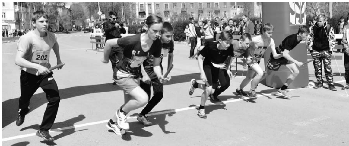
Нередко старт предсказывает финиш.

Фотографии с мероприятий смотрите на нашем сайте.