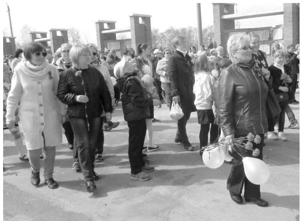
На митинг в Парке Победы собрались жители северной части города.