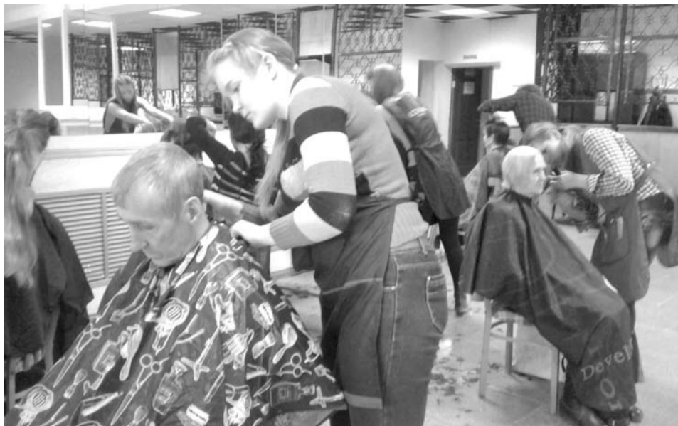
Студенты Богдановичского политехникума подготовили подарок пенсионерам.