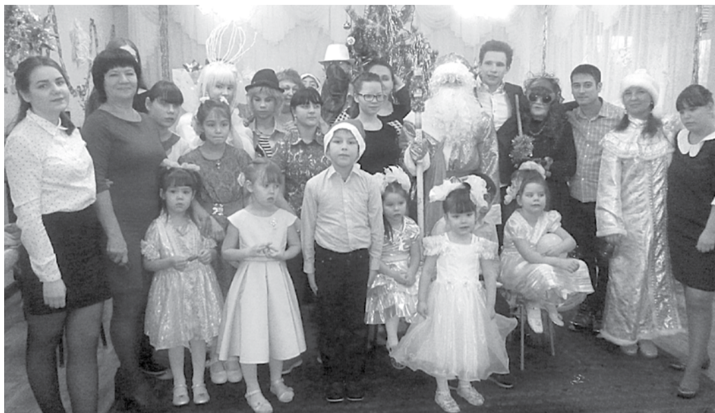
В Новый год ребята получили много подарков, которые по их заявкам помогли приобрести спонсоры.

БЛАГОДАРЯ помощи спонсоров дети богдановичского реабилитационного центра для несовершеннолетних получили большое количество подарков к Новому году и смогли интересно и познавательно провести зимние каникулы.