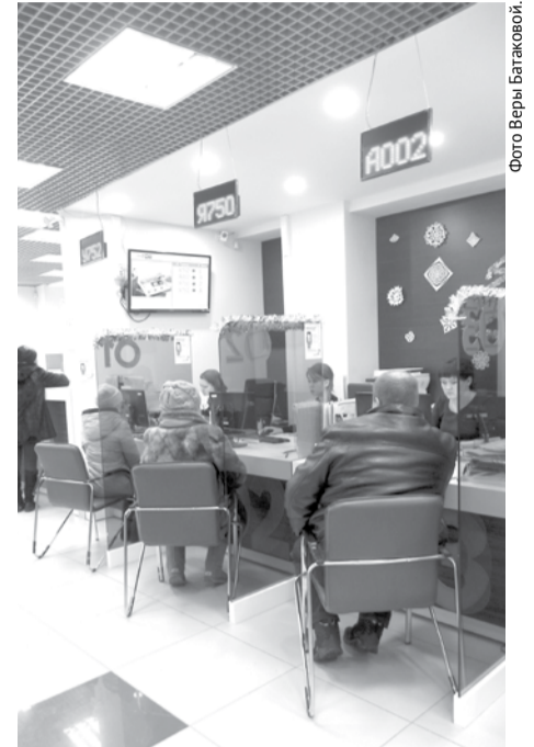
Сотрудники МФЦ за день обслуживают не один десяток человек.