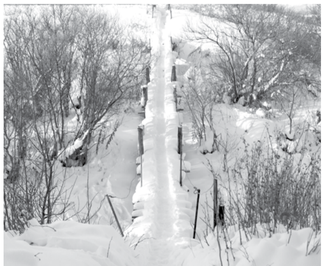
Старый мост в Раскатице требует большого ремонта.

Когда я проезжала по улицам деревни, представила, как много лет назад здесь кипела жизнь, работал колхоз, люди были при деле, все жили весело и интересно. Сейчас, к сожалению, деревенских жителей становится все меньше, уезжают в города, дома выкупают дачники, которые приезжают только летом. А местные жители трудятся сутками напролет, пытаются решать свои проблемы, которых немало. Просто живут тихой и мирной жизнью вдалеке от города и надеются, что про них не забудут.