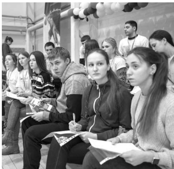
Богдановичским ребятам лекции преподавателей университета показались увлекательными.

оказались просто восхитительными и лишь некоторые были не очень интересными. Мы сидели в огромных аудиториях и слушали настолько умных людей, что аж дух захватывало, у меня появился стимул учиться. Там было столько сильных личностей, что нам только и приходилось постоянно открывать рты от удивления. Так что впечатлений море, и сейчас у меня