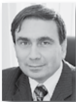
Николай Смирнов, министр энергетики и ЖКХ Свердловской области:

«Благодаря усилиям и поддержке главы региона, модернизация коммунальной инфраструктуры на Среднем Урале приобрела разноплановый и системный характер. Коммунальное хозяйство начало выходить из стагнации и стало более интересным для инвесторов. Учитывая всё это, уверен, что работа в данном направлении не только будет продолжена, но и даст ощутимые для свердловчан результаты. Задачи, поставленные перед отраслью, будут выполнены».