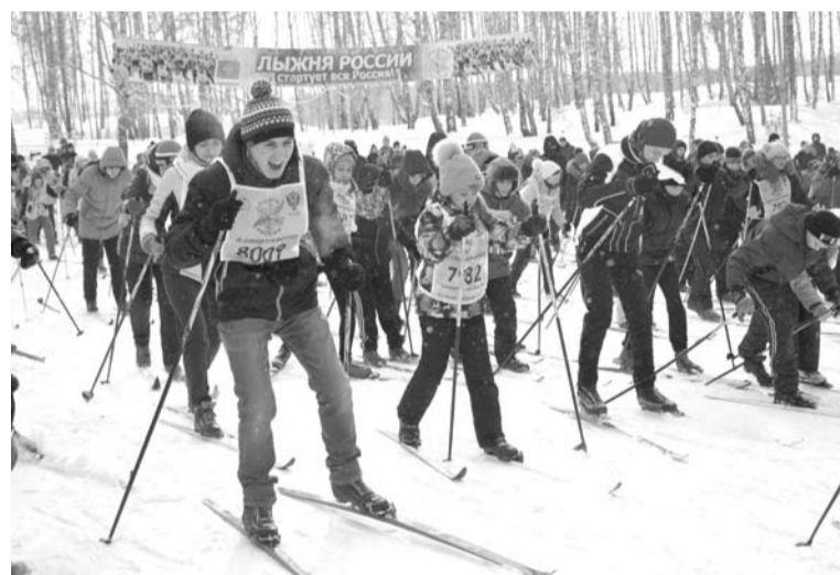
Принять участие в массовом забеге «Лыжни России» могли все желающие.

С 1 по 11 февраля на территории нашего городского округа проводится «Декада лыжного спорта», участие в которой принимают образовательные учреждения ГО Богданович, в том числе и детские сады. В 2016 году декада охватила свыше четырёх тысяч человек, нынче их число не меньше.