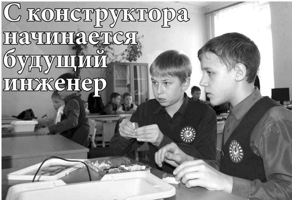
Ребята старались не только быстро собрать конструкцию, но и проявить выдумку и фантазию.