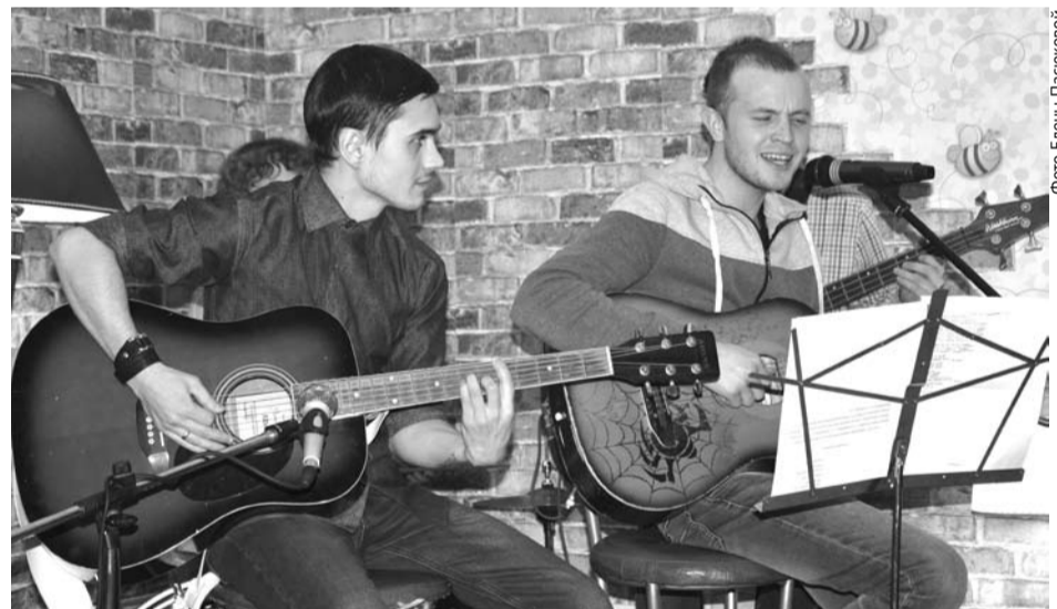
Песни коллектива «Last limit» сотрясли стены квартиры Девяткиных.