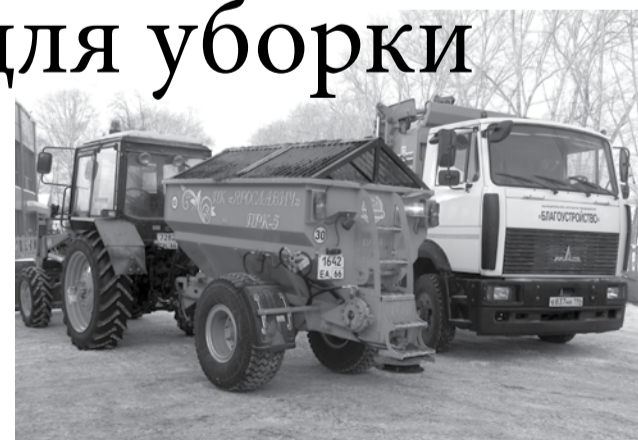
Новая спецтехника предприятия – пескоразбрасыватель и мусоровоз – уже в работе.