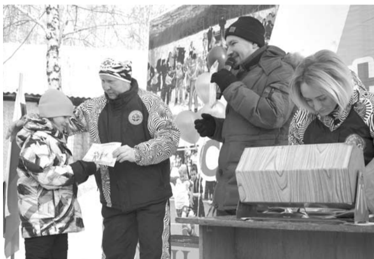
Счастливицы из числа участников элитных забегов в результате лотереи получили памятные подарки от спонсоров.

75 спортсменов, в числе которых как самые юные (2006 г.р.), так и опытные лыжники (55 лет и старше), свободным ходом на результат бежали дистанции – три, пять и десять километров. По завершении участников элитных забегов ждал сюрприз: по стартовым номерам была проведена лотерея, спонсорами которой стали комбикормовый завод, магазин спортивных товаров «Спорттехника», кинотеатр «СовКино», газета «Народное слово», «Благотворительный фонд Александра Шипулина» и страховая компания «Астрамед».