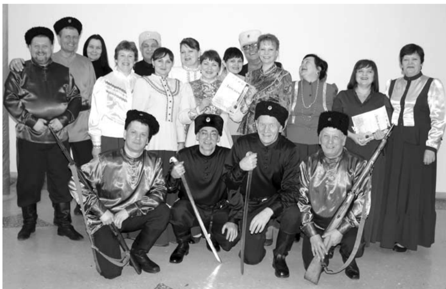
В номинации «Ансамбли» лауреатом I степени стал хор казачьей песни «Уральские просторы» (ДиКЦ) с песней «Пролегла да путь-дорожка».