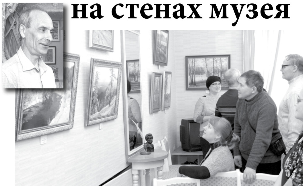
Места, изображенные на картинах Николая Головатина, зрители узнавали с первого взгляда.