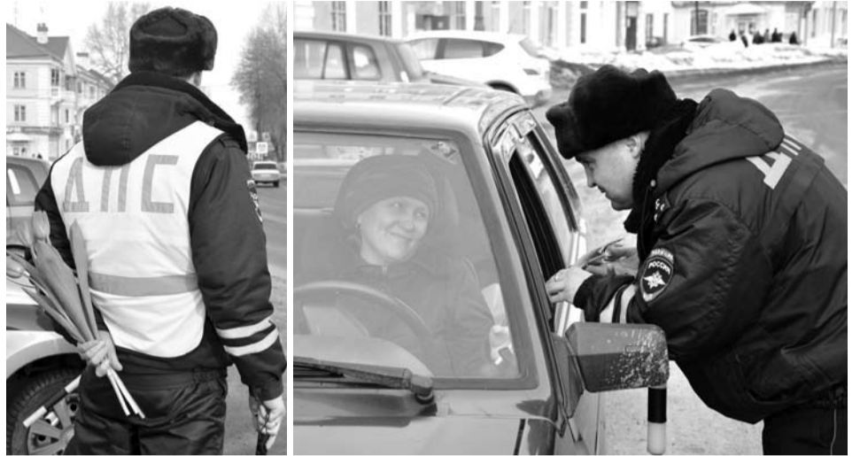
Цветы и улыбки в канун 8 Марта инспекторы ГИБДД дарили женщинам-водителям....