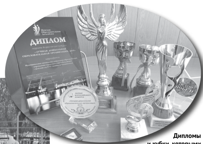
Дипломы и кубки, которыми были награждены воспитанники детского сада в 2016 году.

Во дворе детского сада № 9 есть спортивная площадка, где малыши любят играть.