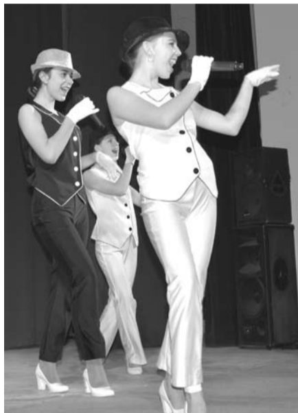
В очередной раз артисты нашего округа порадовали богдановичцев яркими музыкальными номерами.