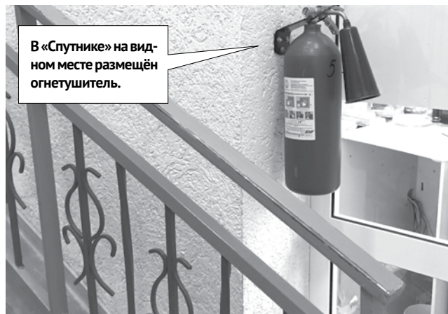
В «Спутнике» на видном месте размещён огнетушитель.

Проверку торговых центров мы начали со «Спутника». Мы были уверены, что функционируют только два основных входа: с улиц Партизанской и Советской. Но оказалось, что двери бокового запасного выхода открыты, и через него можно войти в здание и подняться на третий этаж в фотосалон. Дверь запасного выхода на втором этаже, конечно же, закрыта, так как за ней находятся «Юниденги». Получается, что при пожаре со второго этажа не выйти сразу на улицу, но без проблем можно спуститься на первый этаж по трем лестницам, а потом уже выбежать наружу. Два запасных выхода, которые были в здании, когда там был кинотеатр, сейчас закрыты. В «Спутнике» есть планы эвакуации на обоих этажах, огнетушители и пожарные щиты.