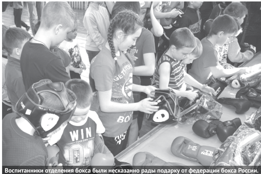
Воспитанники отделения бокса были несказанно рады подарку от федерации бокса России.

Решение преподнести столь нужные для нашего отделения бокса презенты федерация бокса приняла не случайно. Дело в том, что федерация оказывает поддержку тем регионам, на территории которых воспитаны боксеры, успешно выступающие на мировых и европейских соревнованиях среди юниоров и мужчин, и там, где требуется помощь в улучшении условий занятий боксом спортсменов. Первую такую помощь в виде подарков