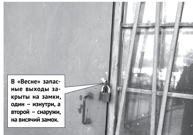
В «Весне» запасные выходы закрыты на замки, один – изнутри, а второй – снаружи, на висячий замок.