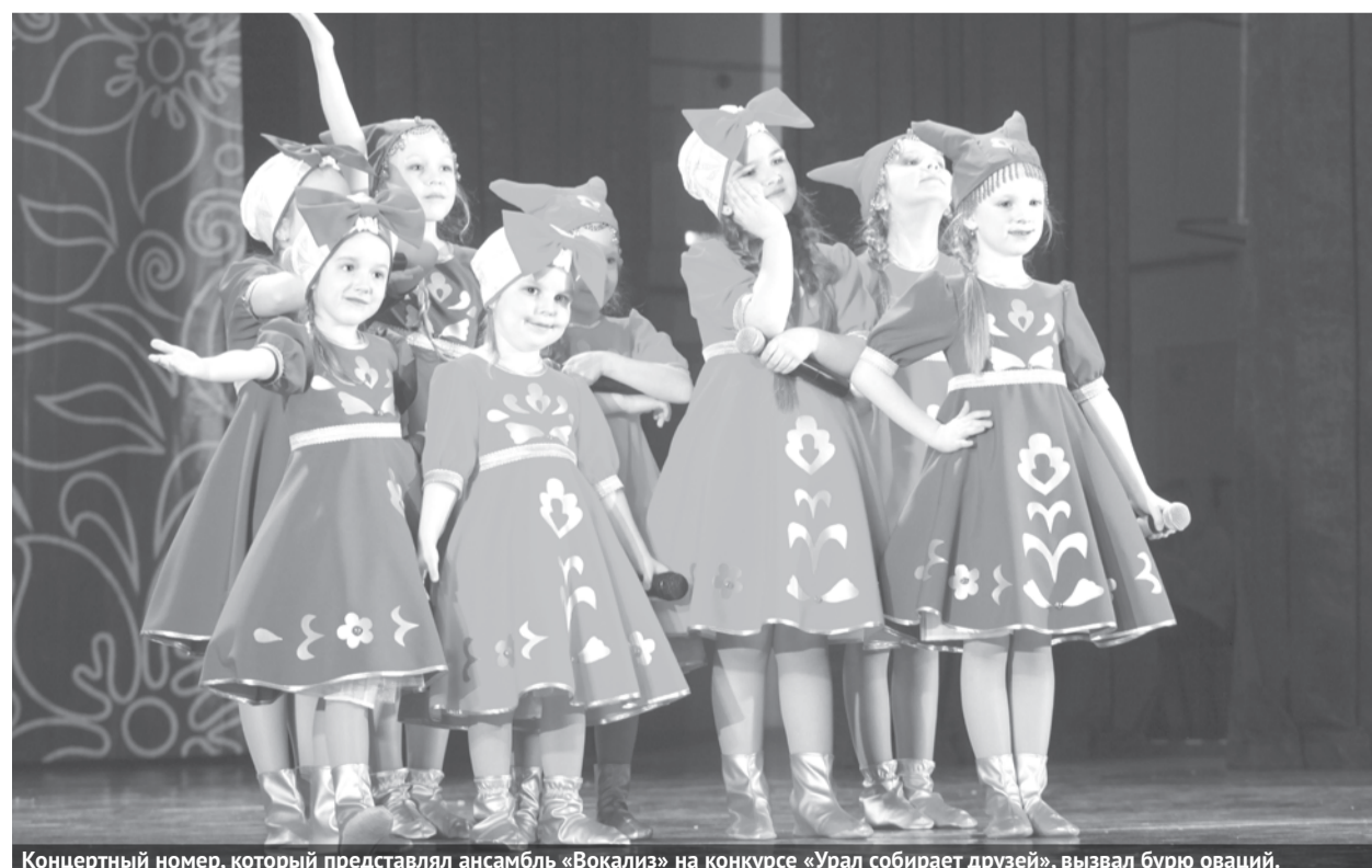
Концертный номер, который представлял ансамбль «Вокализ» на конкурсе «Урал собирает друзей», вызвал бурю оваций.

В Екатеринбурге состоялся финал ежегодного международного конкурса «Урал собирает друзей», который проводится при поддержке министерства культуры РФ и министерства общего и профессионального образования Свердловской области. Наш городской округ здесь представляли несколько вокальных и хореографических коллективов