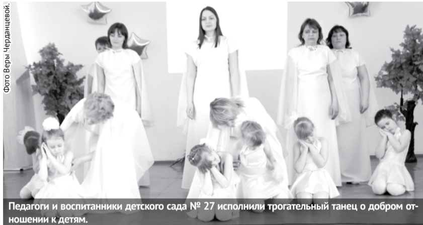
Педагоги и воспитанники детского сада № 27 исполнили трогательный танец о добром отношении к детям.

В актовом зале школы №1 состоялся ежегодный фестиваль творчества педагогических работников «Грани таланта-2018», в котором приняли участие работники и воспитанники 16 образовательных организаций нашего городского округа