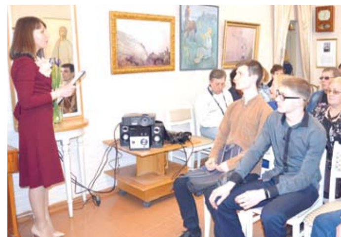
Городские музеи принимали ночных гостей.