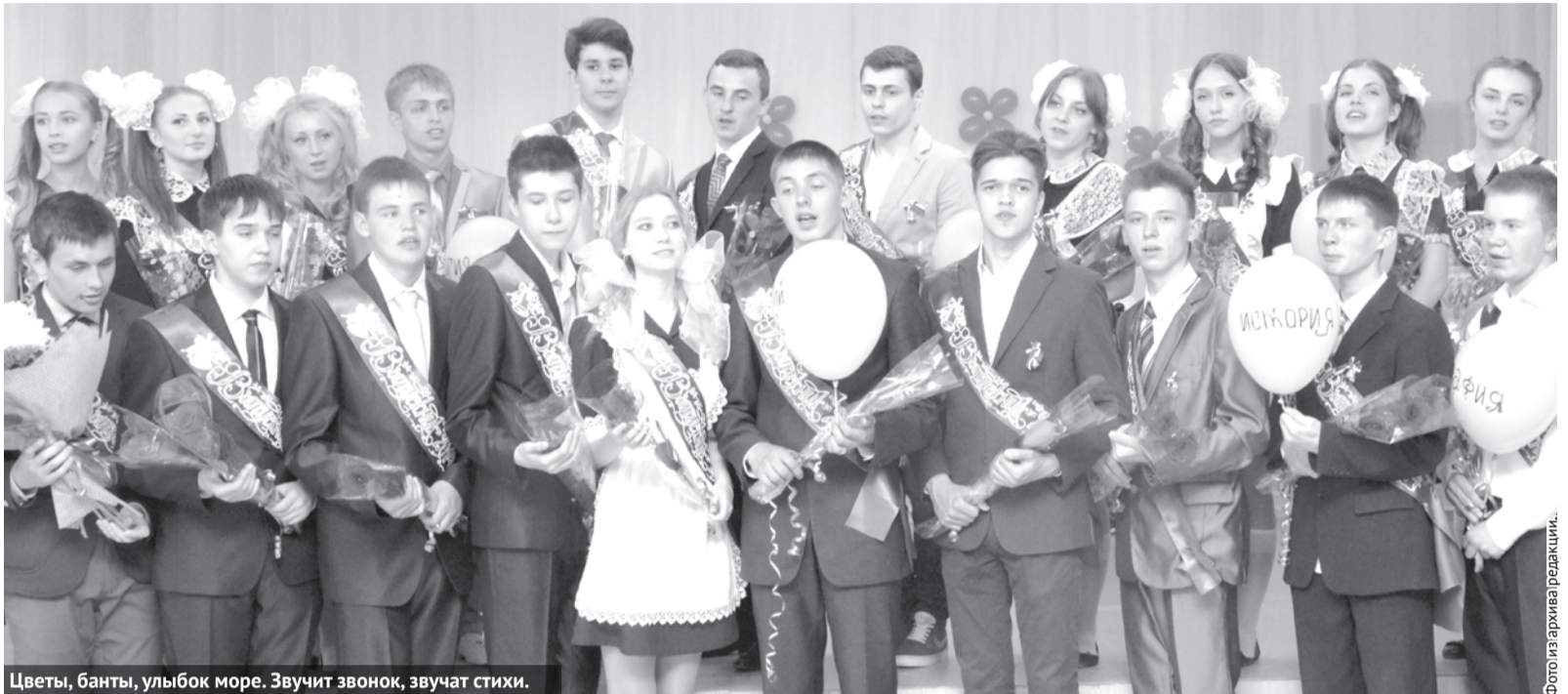
Цветы, банты, улыбок море. Звучит звонок, звучат стихи.

В городском округе Богданович 23 мая на торжественных линейках в честь окончания учебного года последний школьный звонок прозвенел для 765 выпускников, 242 из которых – 11-классники и 523 9-классника