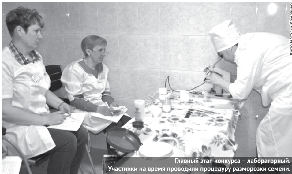
Главный этап конкурса – лабораторный. Участники на время проводили процедуру разморозки семени.