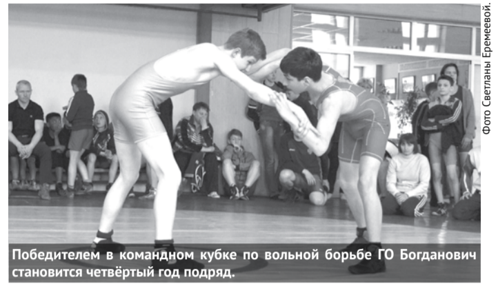
Победителем в командном кубке по вольной борьбе ГО Богданович становится четвёртый год подряд.