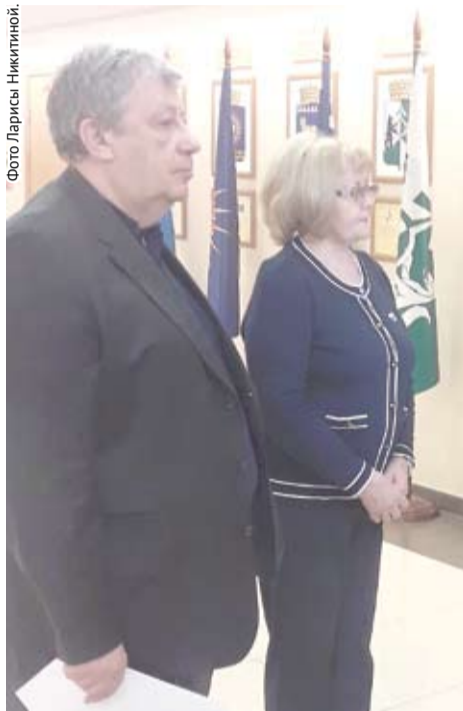
Депутаты намерены вернуть статьи в КоАП РФ.

Поразительная мотивировка водителя: нет места на парковке – заеду на газон. И потом этими колёсами часть грязи развозит по тротуарам и дорогам, вызывая возмущение жителей