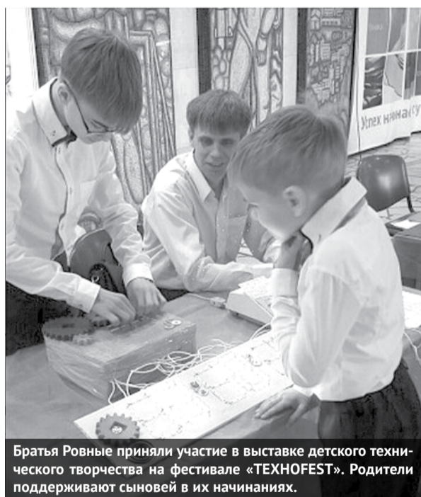
Братья Ровные приняли участие в выставке детского технического творчества на фестивале «ТЕХНОФЕСТ». Родители поддерживают сыновей в их начинаниях.

С 2015 года система образования ГО Богданович активно включилась в реализацию проекта «Уральская инженерная школа». В настоящее время на территории городского округа во многих образовательных организациях имеется опыт по реализации программ и проектов, направленных на формирование и развитие инженерного мышления школьников и воспитанников детских садов.