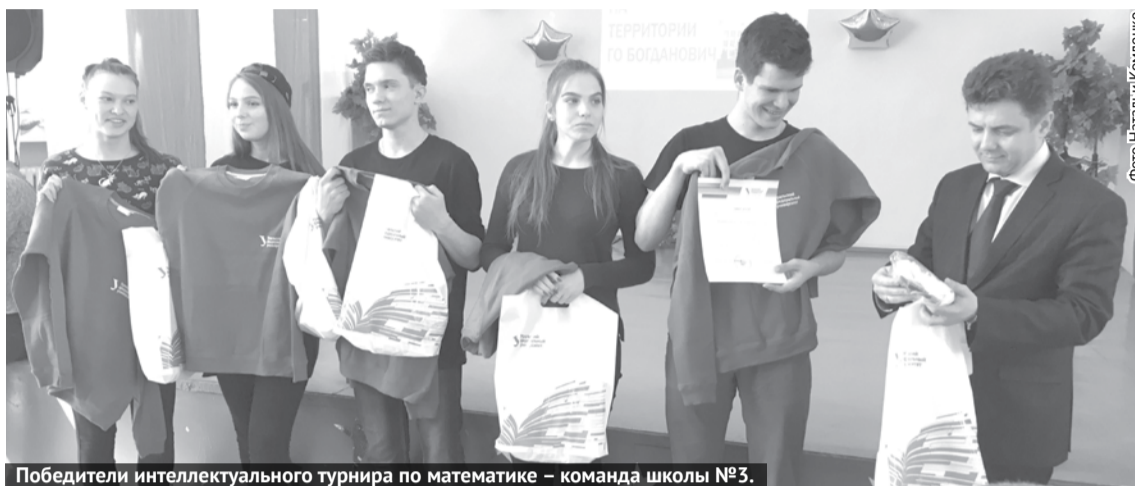
Победители интеллектуального турнира по математике – команда школы №3.

На базе школы № 1 прошел день открытых дверей Уральского федерального университета имени первого президента России Б.Н. Ельцина