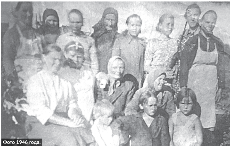
Фото 1946 года.

Папа был грамотный, учился заочно в Екатеринбурге. Где точно, не знаю. Он попал в 19-й особый гвардейский минометный полк 12-го дивизиона. Отец с гордостью писал, что ему первому присвоили звание гвардейца. Воевал на Белорусском фронте, затем в Волгограде. В последнем письме папа написал: «Сейчас мы находимся .....». Черной тушью было замазано местоположение. Конспирация. Даль-