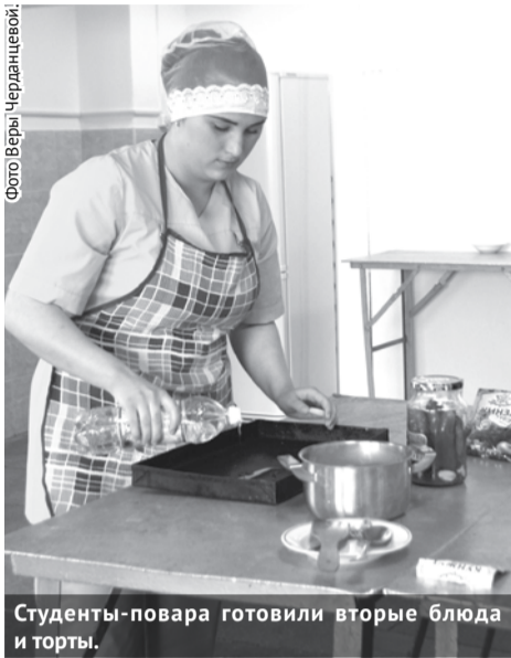
Студенты-повара готовили вторые блюда и торты.

Началась итоговая аттестация студентов выпускных групп Богдановичского политехникума. В этом году из его стен выпускается семь групп, после чего 113 молодых специалистов вольются в трудовые коллективы предприятий и организаций нашего городского округа