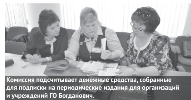
Комиссия подсчитывает денежные средства, собранные для подписки на периодические издания для организаций и учреждений ГО Богданович.

какие периодические издания хотели бы получать. Общество инвалидов выбрало газету «ЗОЖ», совет ветеранов - газету «Пенсионер», комитет солдатских матерей – «Областную газету» и газету «Мудрые советы», социально-реабилитационный центр для несовершеннолетних - журнал «Отчего и почему?», центр социальной помощи семье и детям (отделение социальной реабилитации) - журналы «Отчего и почему?» и «Мегамотг». Желающих поучаствовать в акции оказалось столько, что денежных средств хватило на то, чтобы оказать социальную помощь Гарашкинскому детскому саду, в котором функционирует группа круглосуточного пребывания детей. Для воспитанников детского сада выписали журналы «Маша и медведь» и «Лунтик». Подписки