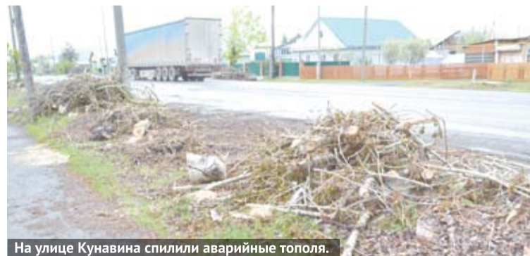
На улице Кунавина спилили аварийные тополя.

решается вопрос подбора пород. Жители могут высказать предложения, которые можно направлять в отдел благоустройства по телефону – 8 (34376) 5-02-21. Пожелания будут учитываться. Что касается неубранных спиленных веток, подрядной организации, выполнявшей работы, была высказана претензия. Оставшийся мусор будет убран в ближайшее время.