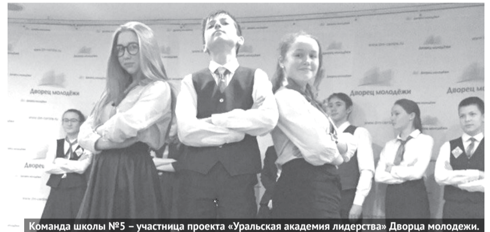
Команда школы №5 – участница проекта «Уральская академия лидерства» Дворца молодежи.

Также она пояснила, что проект состоит из пяти этапов. Первый – конкурс «Вектор успеха», он заключается в презентации молодежных объединений. Второй – конкурс исследовательских проектов «Персона», в котором командам необходимо провести