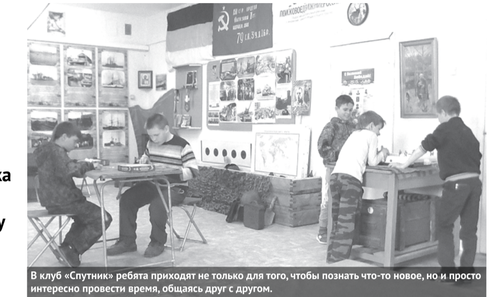
В клуб «Спутник» ребята приходят не только для того, чтобы познать что-то новое, но и просто интересно провести время, общаясь друг с другом.

Туризм напрямую связан с поисковой работой, так как в ходе нее приходится неделями жить в походных условиях. В клубе ребята обучаются вязать узлы, разбивать лагерь, разжигать костер... Кроме этого, вместе с руководителем устраивают походы