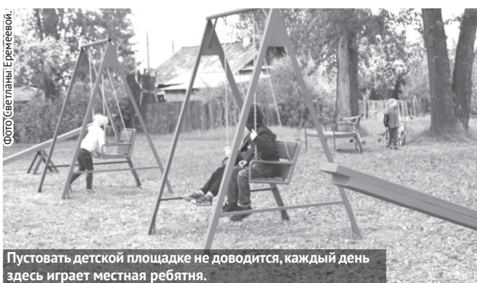
Пустовать детской площадке не доводится, каждый день здесь играет местная ребятня.

Сегодня юным байновцам, проживающим в домах на улицах Рудничной, Рабочей, Чкалова и Автомобилистов, есть где весело и интересно провести время, покататься на качелях. На днях на поле старого стадиона вблизи этих улиц появилась новая детская площадка