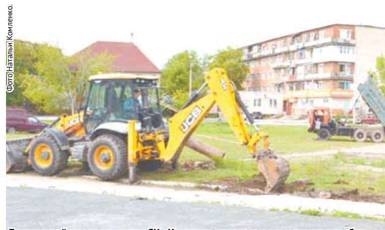
Благоустройство территории СК «Колорит» началось с демонтажных работ.

В рамках проекта «Формирование современной городской среды» в северной части города начались работы по благоустройству площадки у СК «Колорит», набравшей наибольшее количество голосов в рейтинговом голосовании 18 марта текущего года