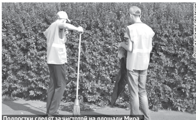
Подростки следят за чистотой на площади Мира.

Летние каникулы – время, которое подростки используют каждый на свой лад. Кто-то предаётся лени – играет в «танчики» и тусит с приятелями. Другие стараются найти способ подзаработать. Но, как выяснилось, одного желанья мало