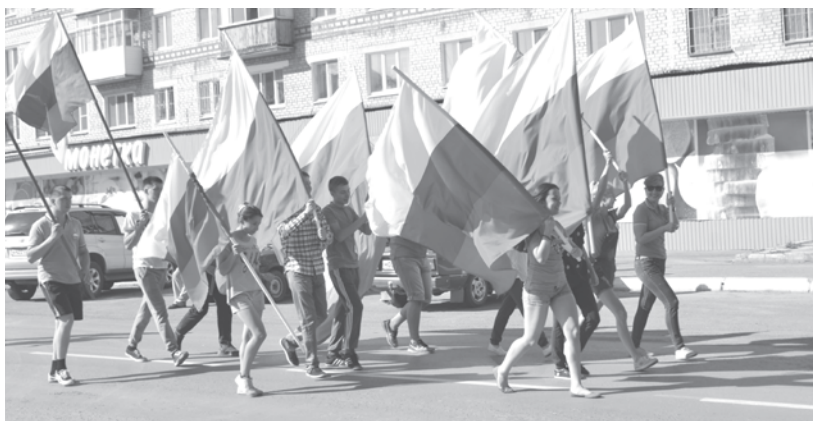
Сидеть на месте молодежи не интересно.

- Как часто нашим землякам удается стать участниками всероссийских или международных мероприятий?