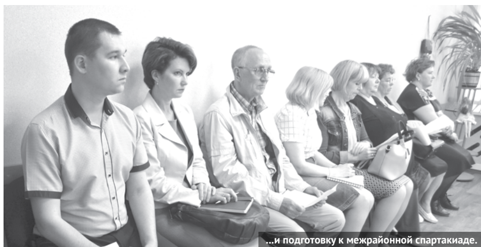
...и подготовку к межрайонной спартакиаде.

Также присутствовавшие обсудили проведенную администрацией городского округа работу по поступившим обращениям от людей с ограниченными возможностями здоровья. Например, от общества инвалидов по зрению поступило обращение об организации пешеходного перехода с улицы Гагарина на улицу Калинина. Вопрос был рассмотрен на заседании комиссии по безопасности дорожного движения. В результате было принято положительное решение и организован пешеходный переход.