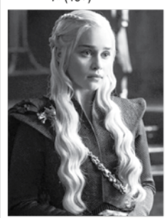
02.15 ВОЕННАЯ ТАЙНА С ИГОРЕМ ПРОКОПЕНКО (16+)

ДОСТАВКА ПЕСОК, ЩЕБЕНЬ Самосвал. Кран-манипулятор 10 т/3 т - 8-982-746-55-03.