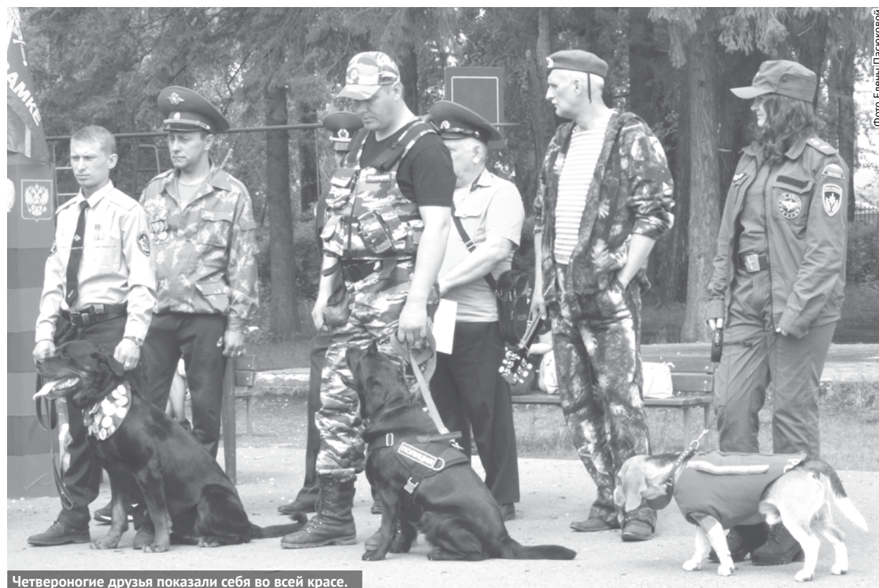
Четвероногие друзья показали себя во всей красе.