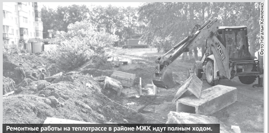
Ремонтные работы на теплотрассе в районе МЖК идут полным ходом.

В администрации ГО Богданович подвели итоги отопительного сезона и сформировали задачи по подготовке к следующей зиме.