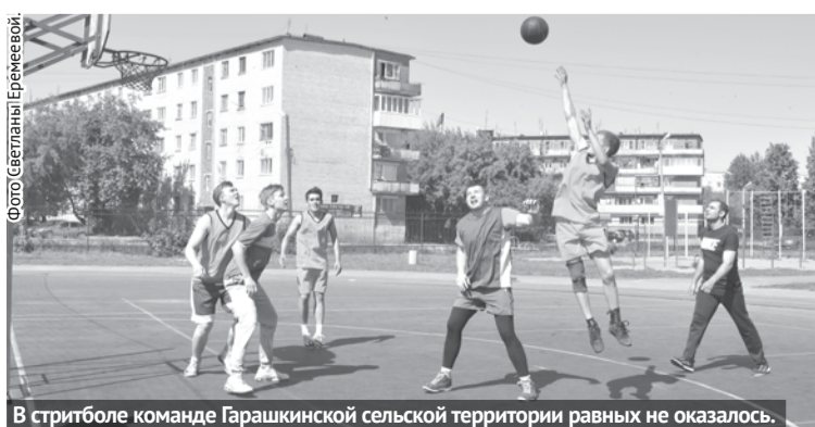
В стритболе команде Гарашкинской сельской территории равных не оказалось.

На базе СК «Колорит» состоялся муниципальный этап сельского спортивного фестиваля