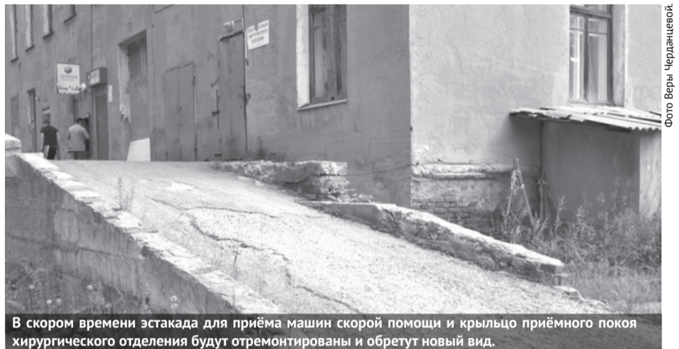
В скором времени эстакада для приёма машин скорой помощи и крыльцо приёмного покоя хирургического отделения будут отремонтированы и обретут новый вид.

По сей день остро стоит вопрос кадрового обеспечения. Многие врачи работают с большой нагрузкой, из-за этого часто возникают нарекания со стороны пациентов. К примеру, у врача во взрослой поликлинике приём пациентов осуществляется до определённого часа, но люди требуют, чтобы он принял ещё кого-то сверх этого времени до-