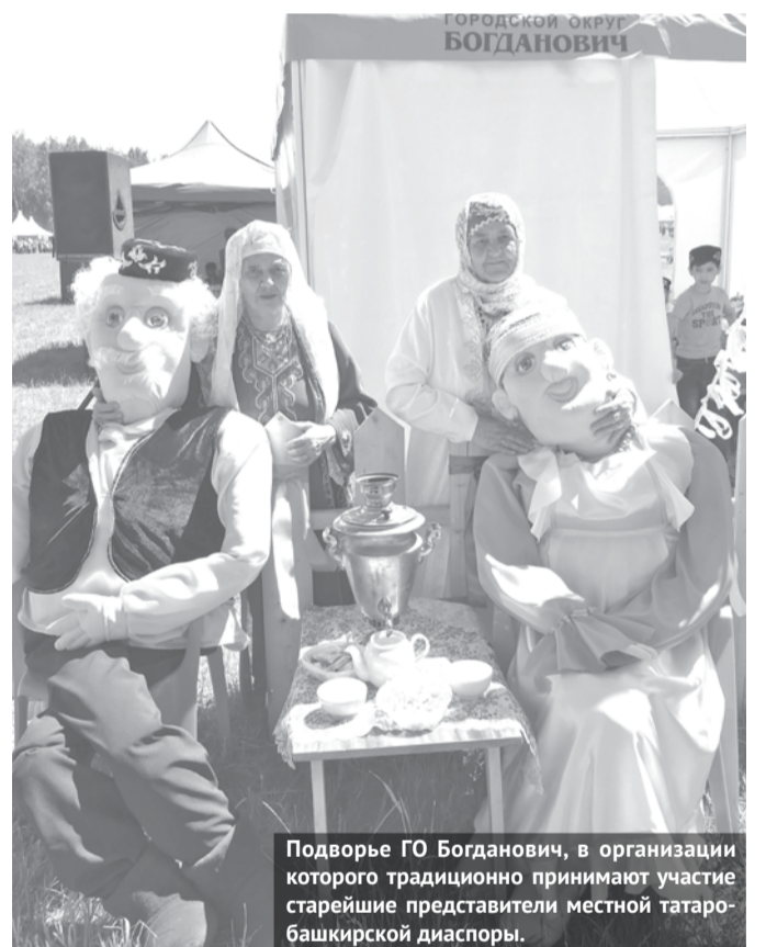
Подворье ГО Богданович, в организации которого традиционно принимают участие старейшие представители местной татаро-башкирской диаспоры.

Председатель Законодательного Собрания Свердловской области Людмила Бабушкина , которая также присутствовала на празднике, сказала: «Этот праздник символизирует хлебосольство, гостеприимство татарского, башкирского народов. И это так. Они не только хорошо угощают, но и хорошо трудятся и вносят огромный вклад в развитие Свердловской области».