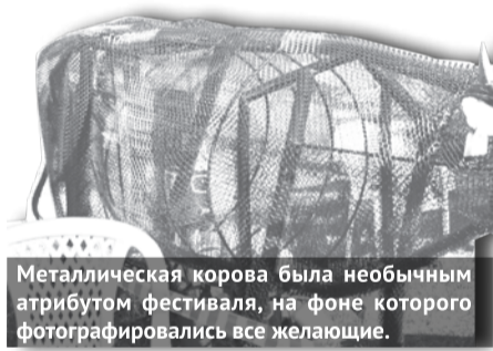
Металлическая корова была необычным атрибутом фестиваля, на фоне которого фотографировались все желающие.