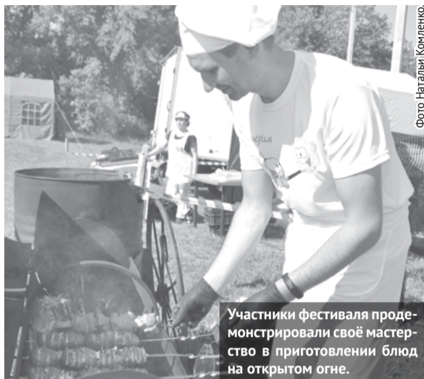
Участники фестиваля продемонстрировали своё мастерство в приготовлении блюд на открытом огне.

В селе Байны прошёл фестиваль барбекю, организованный СПК «Колхоз имени Свердлова». В умении готовить блюда из мяса на углях сразились девять команд