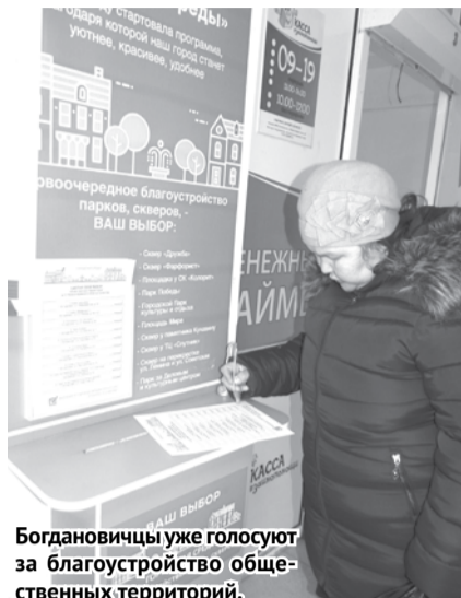
Богдановичцы уже голосуют за благоустройство общественных территорий.

С информацией можно ознакомиться на официальном сайте ГО Богданович ( www.gobogdanovich.ru ), в группах «Формирование современной городской среды» социальных сетей «ВКонтакте» ( vk.com/club160296540 ) и «Одноклассники» ( www.ok.ru/group/53628727853212 ).