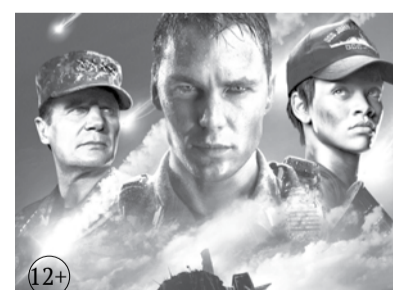
Х/ф «Морской бой» «СТС»

5.10 Д/Ф 6.20 Х/Ф «ЭКИПАЖ МАШИНЫ БОЕВОЙ» (6+)