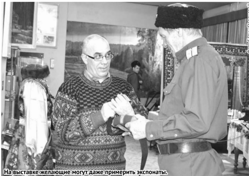
На выставке желающие могут даже примерить экспонаты.

В краеведческом музее проходит выставка «Традиции и современность», которая посвящена казачеству станицы «Богдановичская» и общественному движению «Казачий дозор»