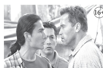
Х/ф «Возмещение ущерба» «Рен ТВ»

5.10 Д/Ф 6.20 Х/Ф «ЭКИПАЖ МАШИНЫ БОЕВОЙ» (6+)