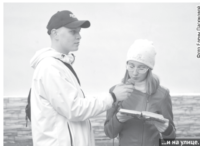
...и на улице.