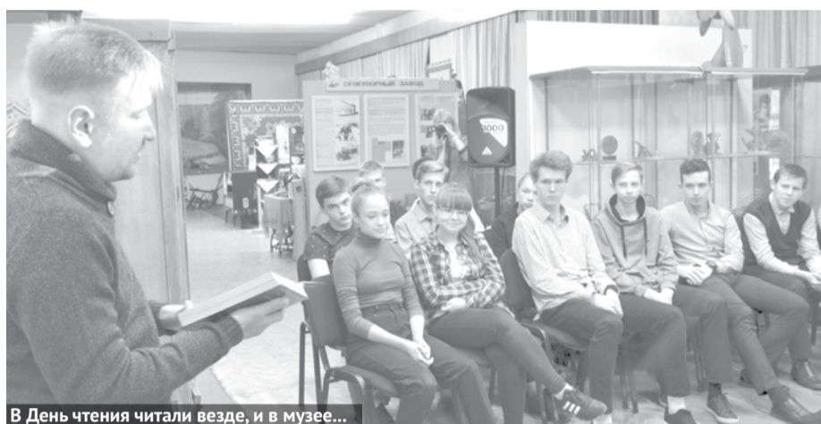
В День чтения читали везде, и в музее...

28 сентября в Свердловской области в четвертый раз прошла всероссийская акция «День чтения». Она была посвящена классической художественной литературе. Богданович также присоединился к этому мероприятию