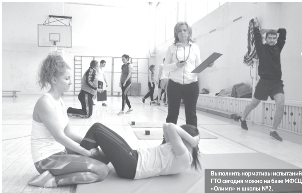
Выполнить нормативы испытаний ГТО сегодня можно на базе МФСЦ «Олимп» и школы №2.

- Допускается ли передача нормативов испытаний комплекса ГТО?