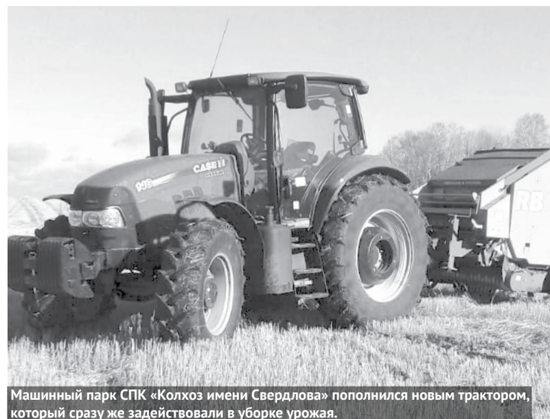
Машинный парк СПК «Колхоз имени Свердлова» пополнился новым трактором, который сразу же задействовали в уборке урожая.

Сельское хозяйство всегда считалось одной из наиболее трудоемких сфер человеческой деятельности, так как здесь преобладает тяжелый ручной труд. Но за последние десятилетия многое изменилось к лучшему. Теперь большинство рабочих процессов механизированы, а новые поколения сельхозтехники позволяют выполнять процессы в несколько раз быстрее и эффективнее