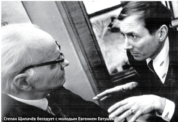
Степан Щипачёв беседует с молодым Евгением Евтушенко.

«Трогательная повесть Степана Щипачёва «Берёзовый сок» о деревенском уральском детстве, которая нежно и медленно льётся, как это чуть горьковато-сладкое материнское молоко природы по деревянной ложбинке к детским губам».