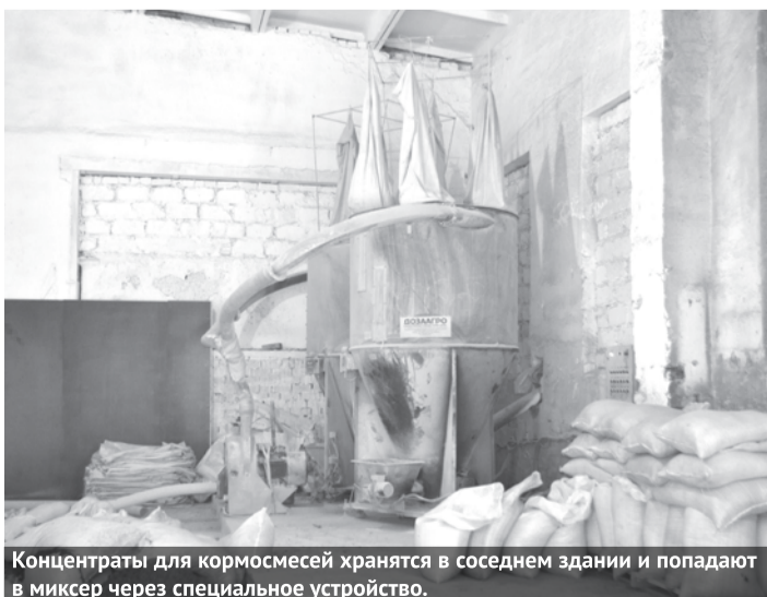
Концентраты для кормосмесей хранятся в соседнем здании и попадают в миксер через специальное устройство.