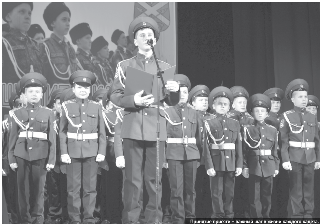
Принятие присяги – важный шаг в жизни каждого кадета.