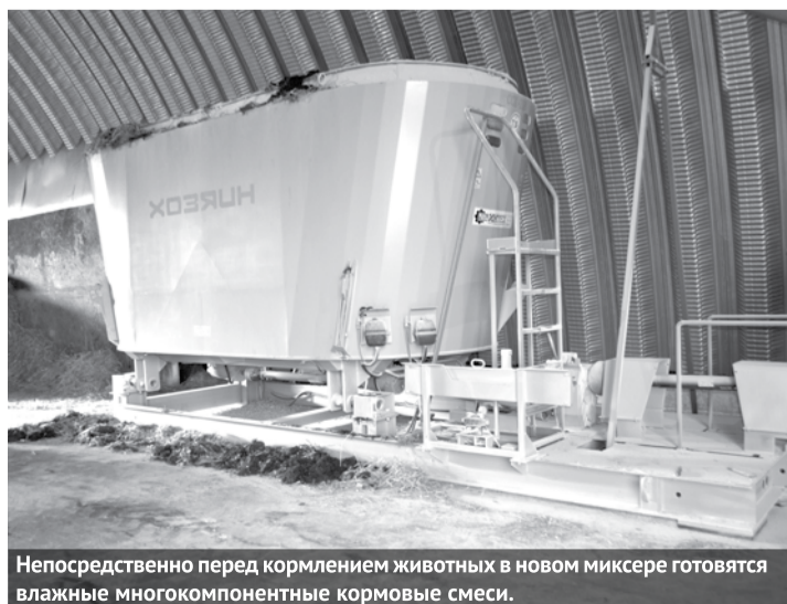
Непосредственно перед кормлением животных в новом миксере готовятся влажные многокомпонентные кормовые смеси.

В следующем году хозяйству исполнится 90 лет. К юбилею предприятие поставило перед собой цель надоить девять тысяч тонн молока. В этом году, как и в предыдущие годы, надой молока составляет 8,5 тонны.