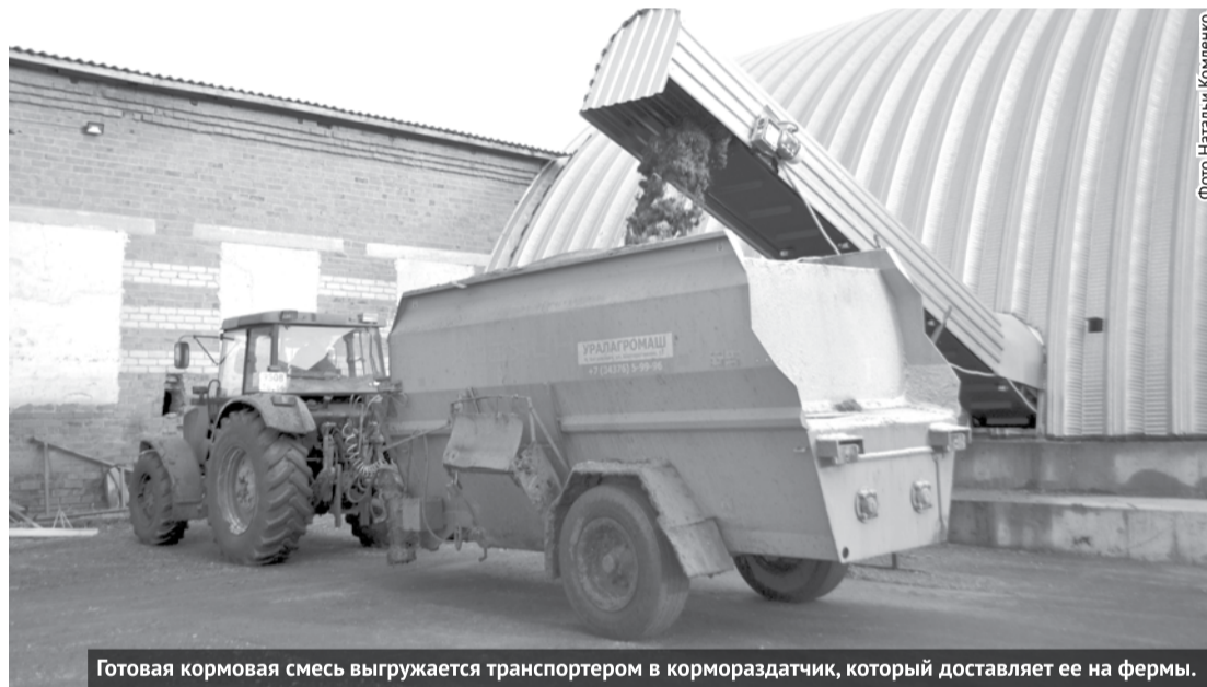
Готовая кормовая смесь выгружается транспортером в кормораздатчик, который доставляет ее на фермы.

намерены увеличить надой молока. Ведь благодаря новому миксеру корма тщательно измельчаются и перемешиваются, а значит, всем коровам одинаково будут поступать питательные вещества.