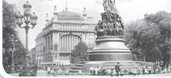
Елисеевский магазин, г. Санкт-Петербург

Григорий Григорьевич Елисеев (1858-1949 гг.) Представитель знаменитой купеческой династии, успешно развил семейное дело, которое впоследствии переименовал в торговое товарищество «Братья Елисеевы». Создал знаменитые Елисеевские магазины в Москве и Санкт-Петербурге.