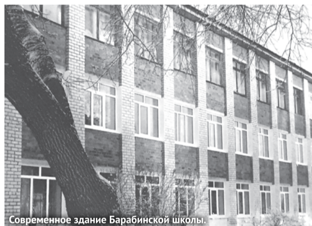
Современное здание Барабинской школы.