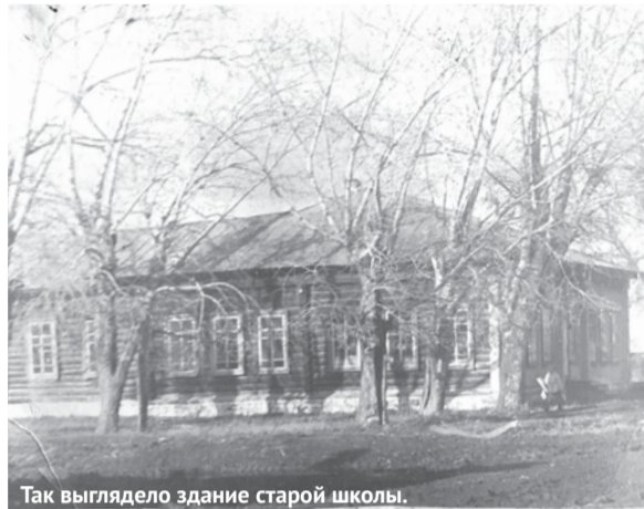
Так выглядело здание старой школы.

В феврале Барабинская школа отмечает юбилейную дату – 45-летие школы и 123-летие образования на селе