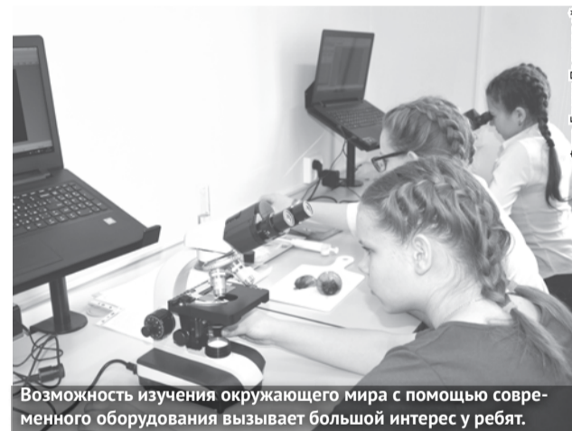
Возможность изучения окружающего мира с помощью современного оборудования вызывает большой интерес у ребят.

Далее гостям продемонстрировали, как дети с помощью нового оборудования изучают окружающий мир. В одном из кабинетов школьники под руководством педагога изучали свойства цитоплазмы клетки. Они работали с электронными микроскопами, которые передавали изображение на монитор компьютера. А в соседнем кабинете