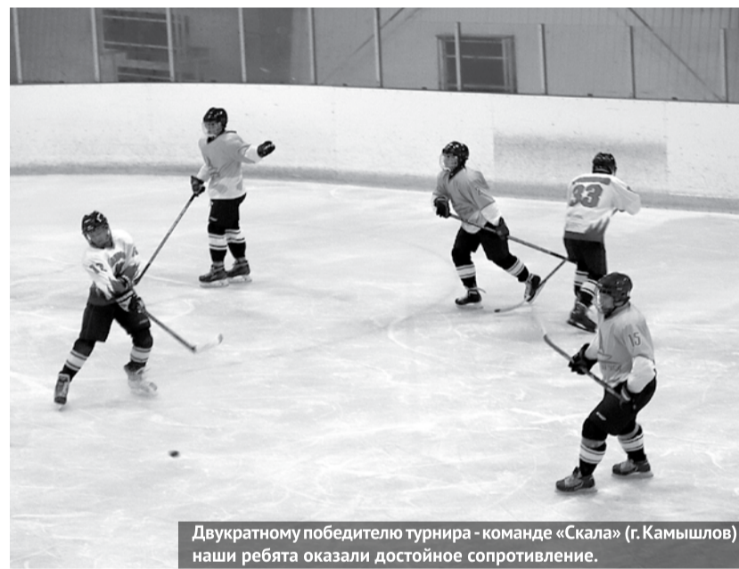
Двукратному победителю турнира - команде «Скала» (г. Камышлов) наши ребята оказали достойное сопротивление.

ганово» почти полными составами. Те, кто не играл в хоккей, создали группы поддержки и болели за свои команды, поддерживали их плакатами и кричалками. Турнир стал настоящим праздником для всех участников.