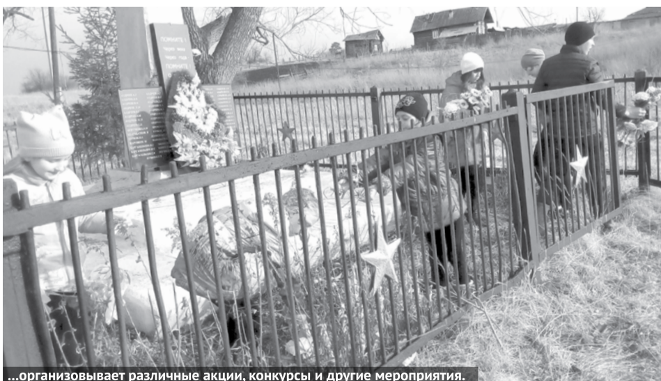
...организовывает различные акции, конкурсы и другие мероприятия.