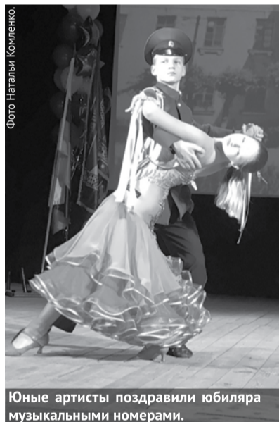
Юные артисты поздравили юбиляра музыкальными номерами.

В Деловом и культурном центре прошло праздничное мероприятие, посвященное 75-летию Богдановичского политехникума, на котором присутствовали педагоги, учащиеся и сотрудники образовательного учреждения.