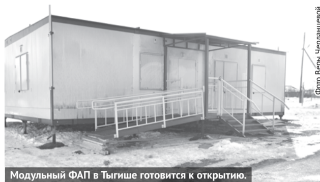
Модульный ФАП в Тыгише готовится к открытию.

Модульный ФАП в селе Тыгиш ждали долго, и вот наконец-то 7 марта его доставили в сельскую территорию