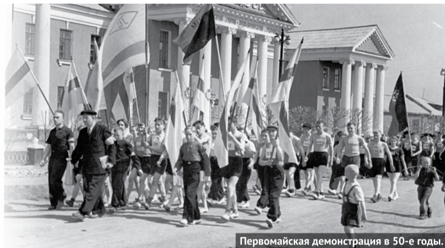
Первомайская демонстрация в 50-е годы.