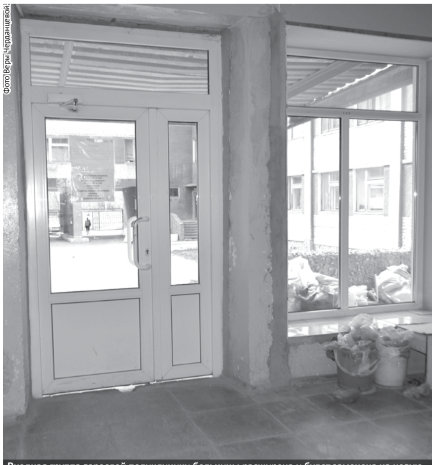
Входная группа взрослой поликлиники больницы расширена и будет заменена на новую.

В Богдановичской ЦРБ начались работы по ремонту регистратуры и входной группы взрослой поликлиники. В день нашего посещения там полным ходом шли подготовительные работы