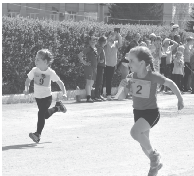
Легкоатлетическая эстафета, посвященная Дню Победы, на призы газеты «Народное слово» в этом году прошла в 70-й раз. Нынче в ней впервые участвовали команды дошкольных учреждений нашего округа. Для юных спортсменов была организована трасса на площади перед детской школой искусств, которую они с азартом преодолели.