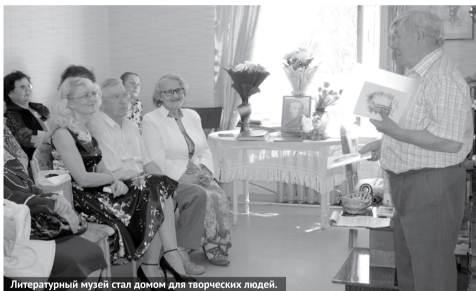
Литературный музей стал домом для творческих людей.