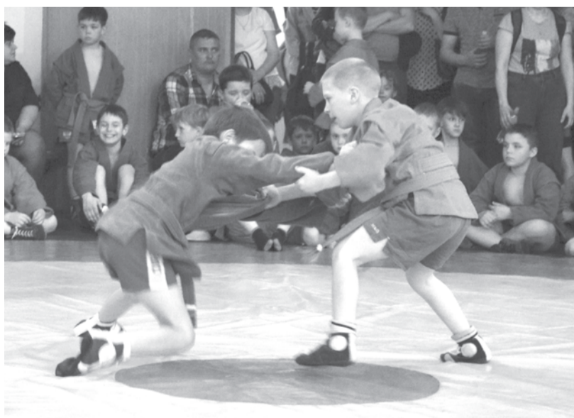
В спортивной школе ГО Богданович прошел X областной турнир по самбо среди юношей и девушек 2007-2008, 2009-2010 годов рождения, посвященный 74-й годовщине Победы в Великой Отечественной войне, на призы Думы нашего городского округа. В соревнованиях приняли участие 125 спортсменов из разных городов области.