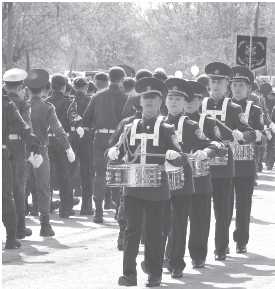
Почётное право возглавить праздничную колонну было предоставлено воспитанникам Первого Уральского казачьего кадетского корпуса. Звуки барабанной дроби взвода барабанщиков задавали темп всем парадным расчётам.