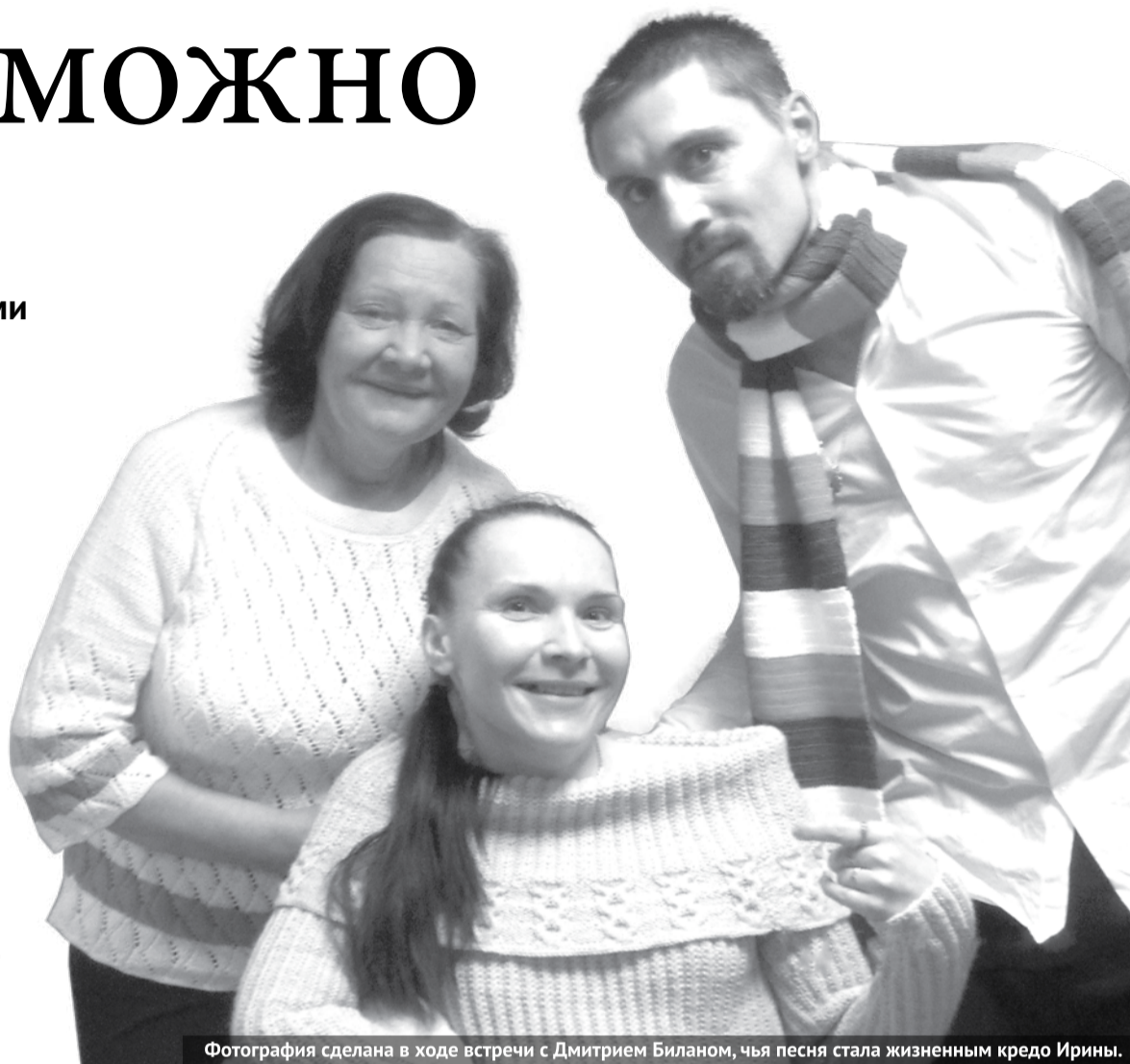
Фотография сделана в ходе встречи с Дмитрием Бианом, чья песня стала жизненным кредо Ирины.

Часто бывает, что люди с ограниченными возможностями здоровья учат нас ценить свои возможности, в трудных ситуациях не опускать руки. При этом они не только добиваются поставленных целей, но и оказывают помощь другим