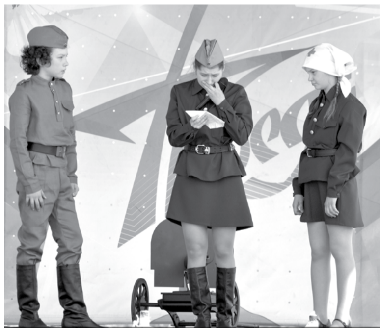
9 мая в парке прошла праздничная программа «Несокрушимые», в которой приняли участие театр-студия «Чайка» (г. Богданович) и ансамбль «Иван да Марья» (г. Екатеринбург).