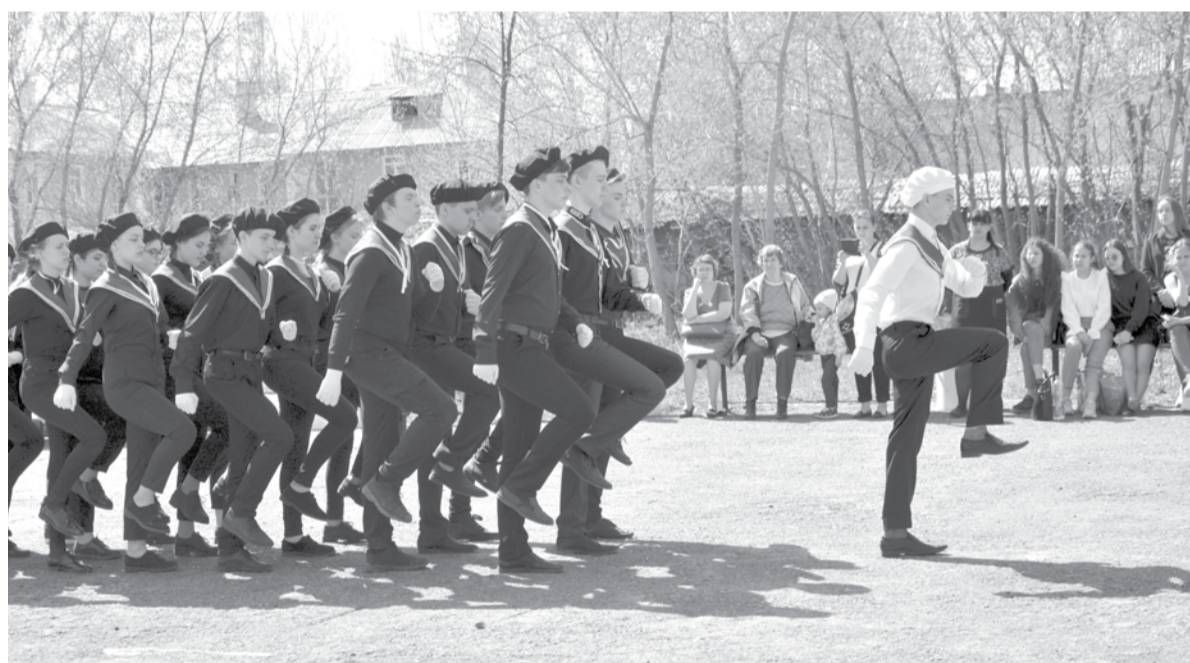
В преддверии празднования Дня Победы в Богдановиче прошел районный смотр строя и песни среди школьников «Равнение на Победу!». В этот раз он проходил на «Аллее Славы». Свою строевую подготовку демонстрировали шесть городских и пять сельских школ.