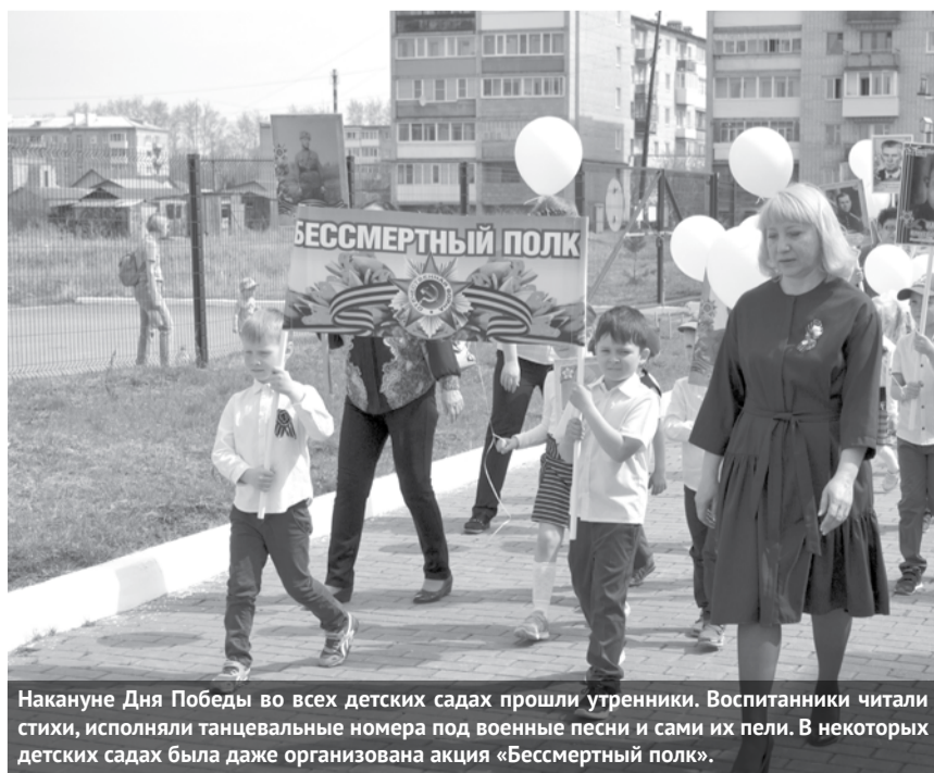
Накануне Дня Победы во всех детских садах прошли утренники. Воспитанники читали стихи, исполняли танцевальные номера под военные песни и сами их пели. В некоторых детских садах была даже организована акция «Бессмертный полк».