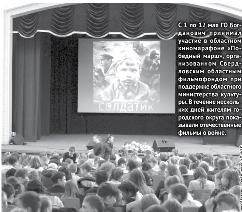
С 1 по 12 мая ГО Богданович принял участие в областном киномарафоне «Победный марш», организованном Свердловским областным фильмофондом при поддержке областного министерства культуры. В течение нескольких дней жителям городского округа показывали отечественные фильмы о войне.