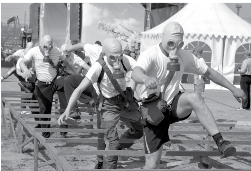
Четвёртый год подряд одним из самых интересных мероприятий, проходящих в рамках празднования Дня Победы, является военно-патриотический конкурс «Солдатская звезда». Нынче в соревнованиях включились школьные команды. В ходе прохождения всех испытаний участники не ударили в грязь лицом.