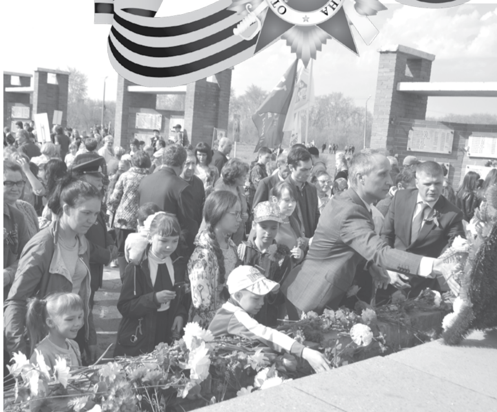
В митинге в парке Победы приняли участие представители администрации и Думы ГО Богданович, члены общественных организаций, сотрудники предприятий, организаций и учреждений, школьники и все неравнодушные к празднику жители городского округа. Некоторые богдановичи пришли на митинг семьями, многие держали в руках фотографии родственников, участвовавших в войне. Почетными гостями мероприятия стали ветераны Великой Отечественной войны и труженики тыла. Участники митинга почтили память павших минутой молчания, возложили цветы к мемориалу в их честь, а также выпустили в небо белые шары.