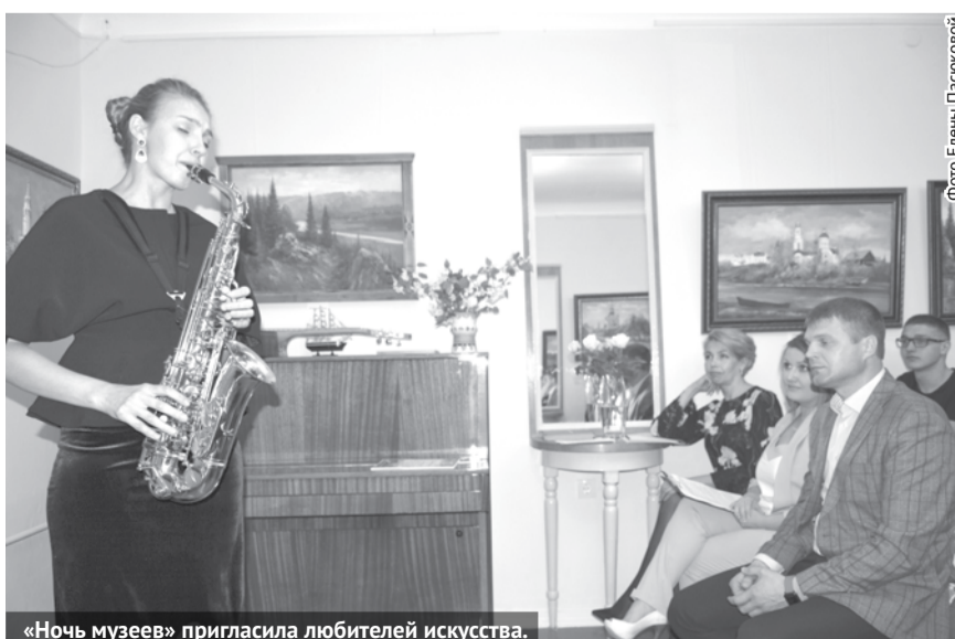
«Ночь музеев» пригласила любителей искусства.

специальных навыков и подготовки, зато дающее возможность выразить себя. А на мастер-классе «Полевые цветы» желаю-