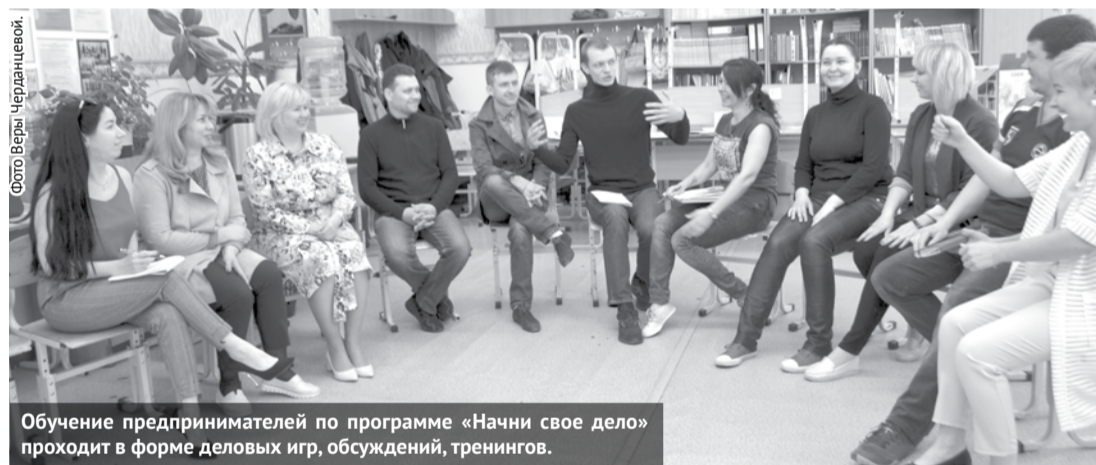
Обучение предпринимателей по программе «Начни своё дело» проходит в форме деловых игр, обсуждений, тренингов.