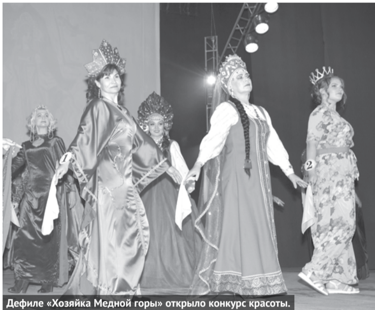
Дефиле «Хозяйка Медной горы» открыло конкурс красоты.