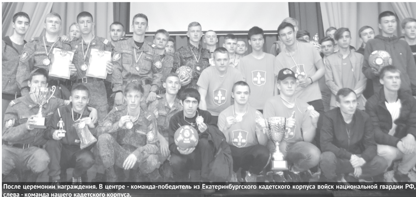
После церемонии награждения. В центре - команда-победитель из Екатеринбургского кадетского корпуса войск национальной гвардии РФ, слева - команда нашего кадетского корпуса.

Участники турнира поделились впечатлениями о спортивном празднике.