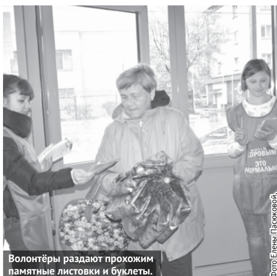
Волонтеры раздают прохожим памятные листовки и буклеты.

Уже несколько лет подряд в нашей стране проводится всероссийская акция «Стоп ВИЧ/СПИД», приуроченная к Международному дню памяти людей, умерших от СПИДа