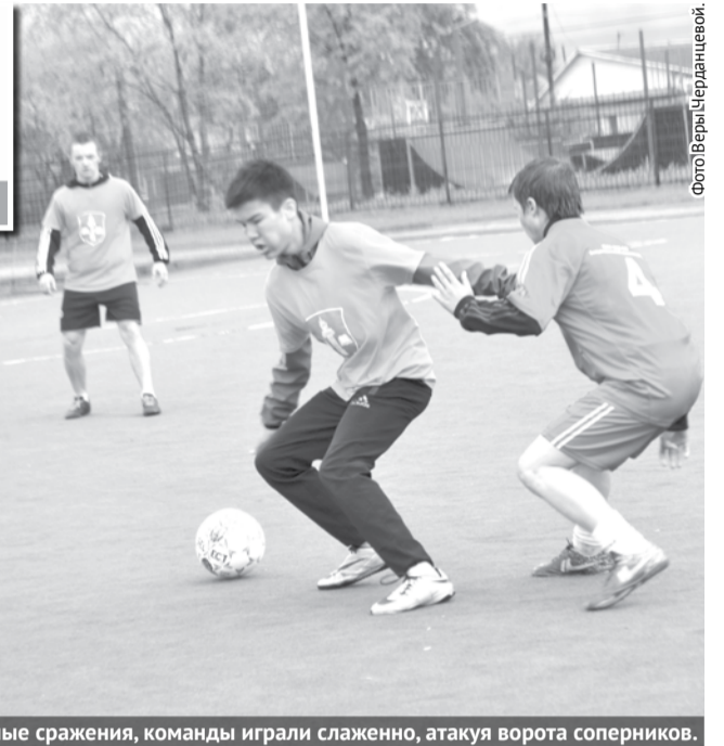
На полях развернулись нешуточные сражения, команды играли слаженно, атакуя ворота соперников.