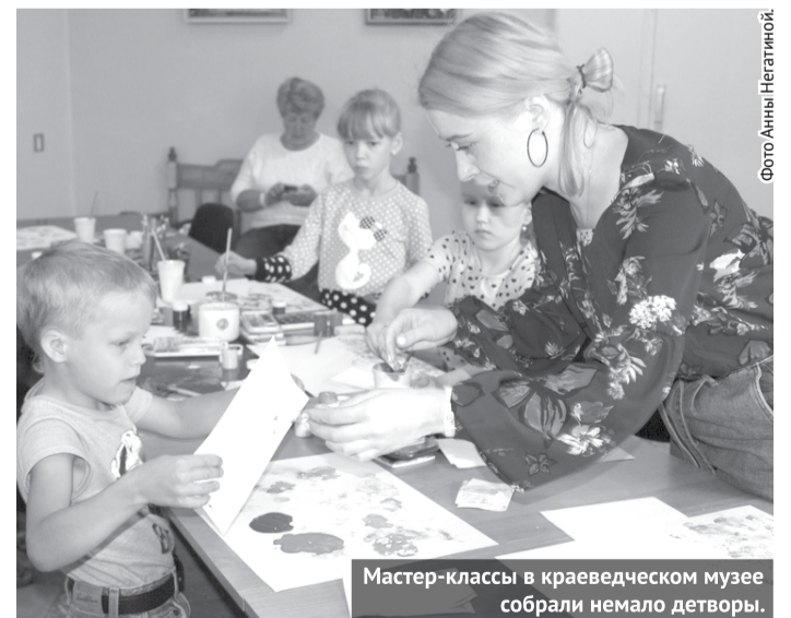
Мастер-классы в краеведческом музее собрали немало детворы.

В краеведческом музее прошел мастер-класс «Монотипия» - рисование красками, не требующее