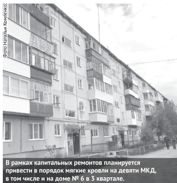
В рамках капитальных ремонтов планируется привести в порядок мягкие кровли на девяти МКД, в том числе и на доме № 6 в 3 квартале.

В городском округе Богданович начались работы по капитальному ремонту мягких кровель многоквартирных домов в рамках реализации региональной программы капитального ремонта общего имущества в МКД Свердловской области на 2015-2044 годы