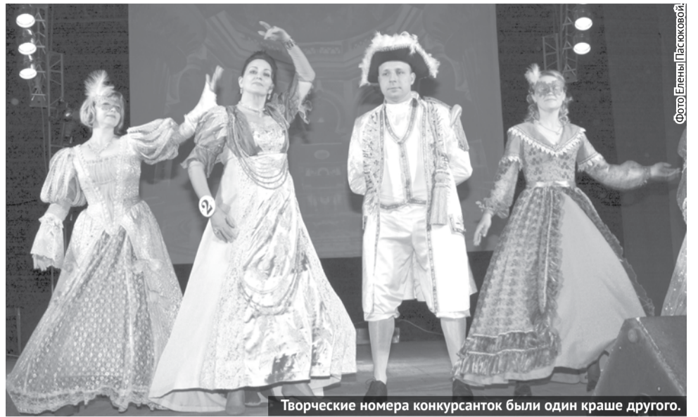
Творческие номера конкурсанток были один краше другого.

В минувшую субботу в ДикЦ состоялся районный конкурс красоты и таланта «Молодая, деловая, золотая - 2019» в трех возрастных номинациях: «Молодая» - от 16 до 30, «Деловая» - от 30 до 45 и «Золотая» - от 45