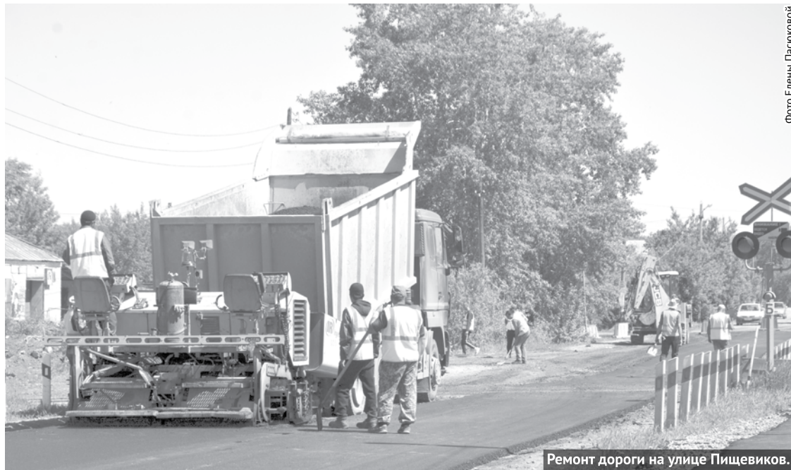
Ремонт дороги на улице Пищевиков.

Что касается ремонта дороги на улице Кунавина, то сейчас идет конкурс по выбору новой подрядной организации для выполнения ремонтных работ. Заключить муниципальный контракт планируется до 28 июня, после чего работы на улице Кунавина будут возобновлены.