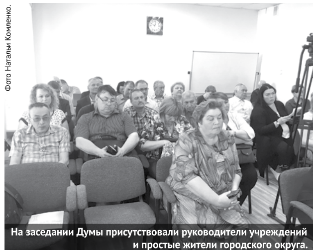
На заседании Думы присутствовали руководители учреждений и простые жители городского округа.

На очередном заседании Думы ГО Богданович присутствовало 18 депутатов, которые рассмотрели 11 вопросов, заявленных в повестке дня