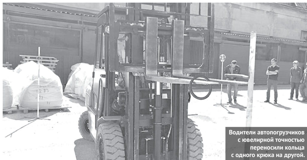
Водители автопогрузчиков с ювелирной точностью переносили кольца с одного крюка на другой.

В Богдановичском ОАО «Огнеупоры» ведётся системная работа по развитию персонала, особое внимание уделяется молодёжи, повышению профессионального мастерства