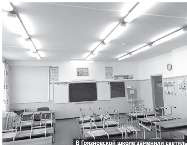
В Грязновской школе заменили светильники в пяти кабинетах и обновили коридор.