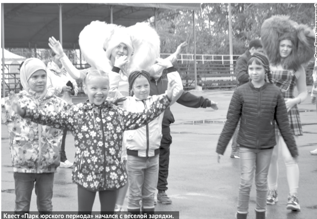
Квест «Парк юрского периода» начался с веселой зарядки.