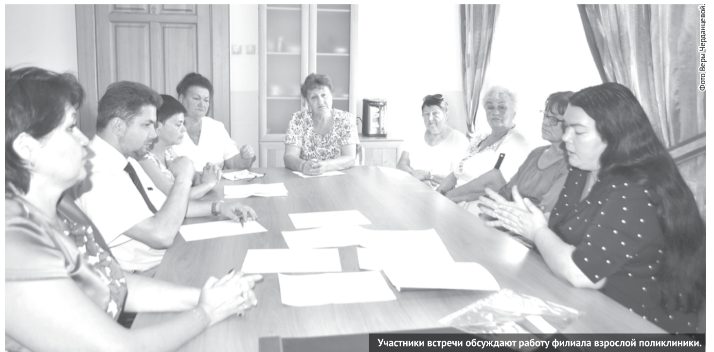
Участники встречи обсуждают работу филиала взрослой поликлиники.

В нашу редакцию обратились жители северного микрорайона, которые обеспокоены сокращением количества медицинских услуг в филиале взрослой поликлиники