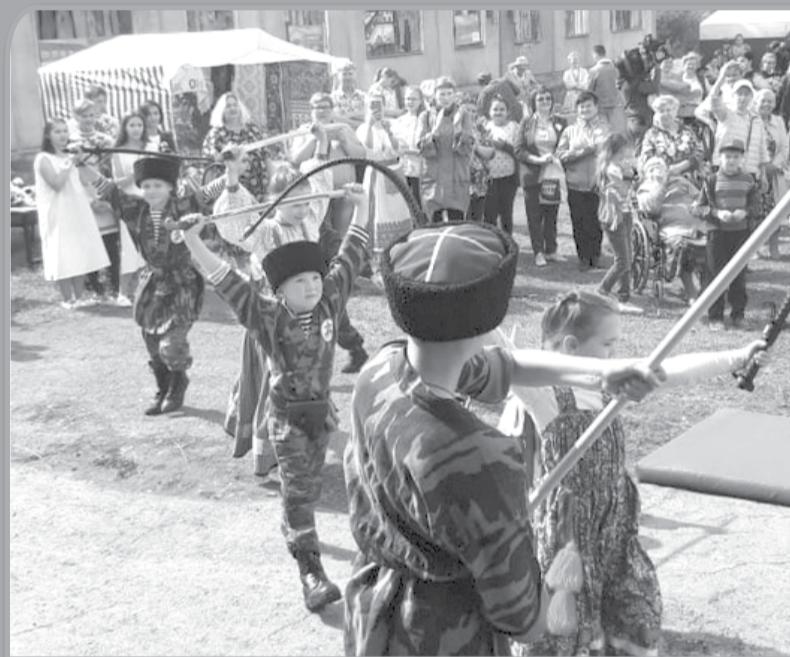
В рамках праздника Дня села в Ильинском прошел второй областной фестиваль «Ильин день», где собрались творческие коллективы и исполнители, представляющие традиционную русскую культуру.