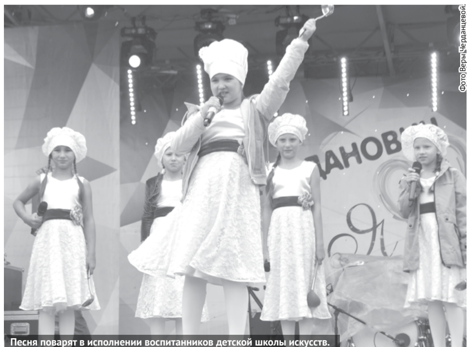
Песня поварят в исполнении воспитанников детской школы искусств.