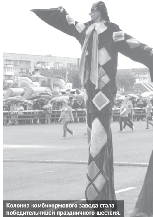
Колонна комбикормового завода стала победительницей праздничного шествия.

Еще больше фотографий смотрите на нашем сайте.