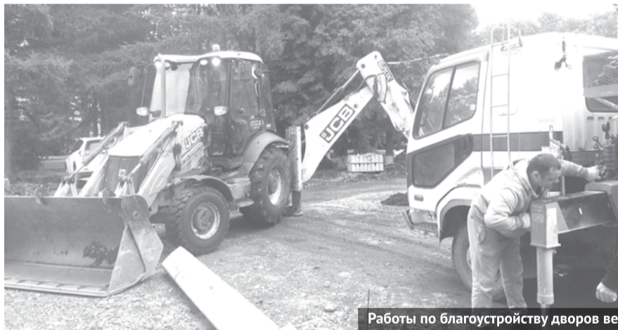
Работы по благоустройству дворов ведутся с утра до вечера, даже в непогоду.

В Богдановиче продолжается благоустройство двух дворовых территорий и площадки у СК «Колорит». Объекты постепенно приобретают новый вид, а жители города с нетерпением ждут окончания работ