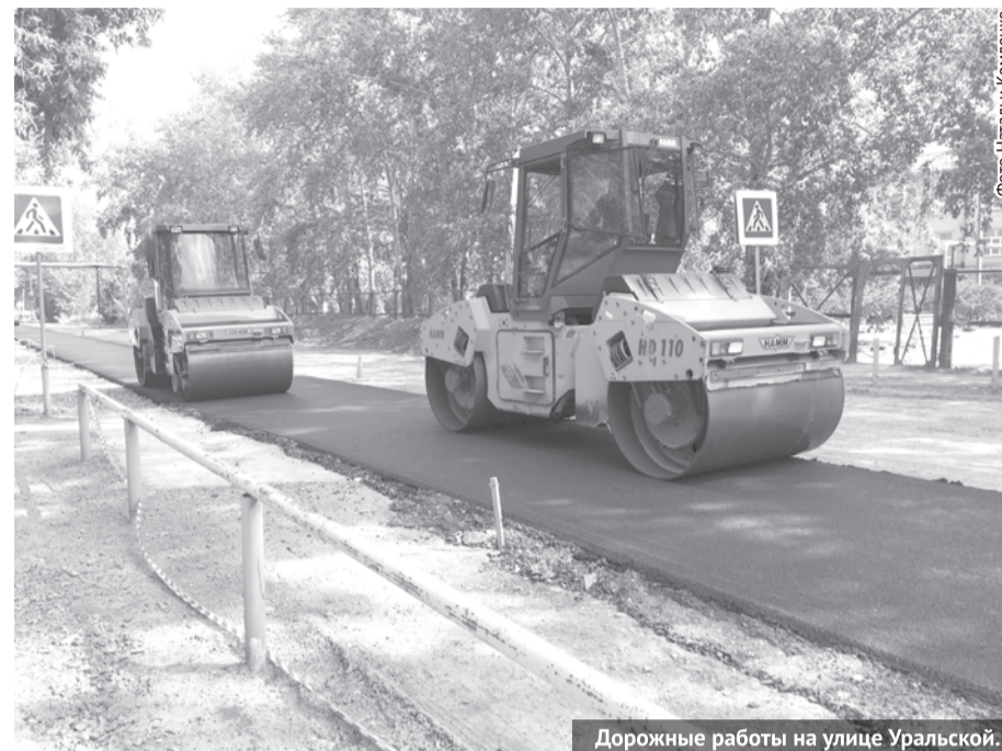
Дорожные работы на улице Уральской.

У образовательных организаций были выполнены новые парковки общей площадью 800 кв. метров на сумму 839 тысяч рублей, это школы №5, №3 и №10, детский сад №27 . Кстати, вскоре