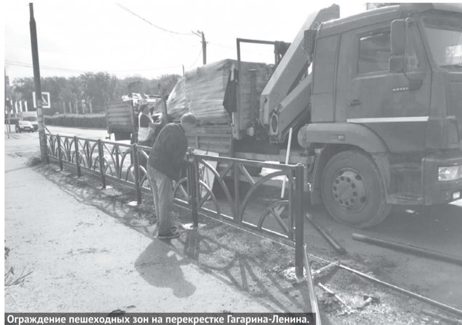
Ограждение пешеходных зон на перекрестке Гагарина-Ленина.