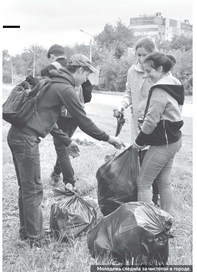
Молодежь следила за чистотой в городе.

Впрочем, подросткам все-таки удалось трудоустроиться. Желающих подзаработать летом было достаточно много, поэтому работали ребята всего по две недели, чтобы дать шанс заработать другим. Традиционно молодежь от 14 до 18 лет получила работу при УКМПИИ. В этом году ребята трудятся еще в МУП «Благоустройство», в Волковской школе и в парке культуры и отдыха. Помимо этого, подростки занимаются благоустройством территории в парке за ДКЦ, а также на площади Мира и территории около СК «Колорит».