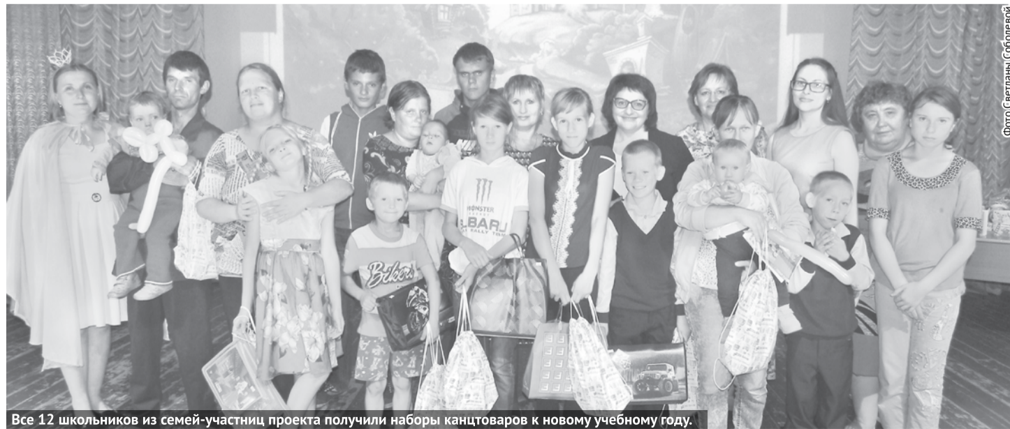
Все 12 школьников из семей-участниц проекта получили наборы канцтоваров к новому учебному году.

Проект продолжается. Вместе мы можем многое!