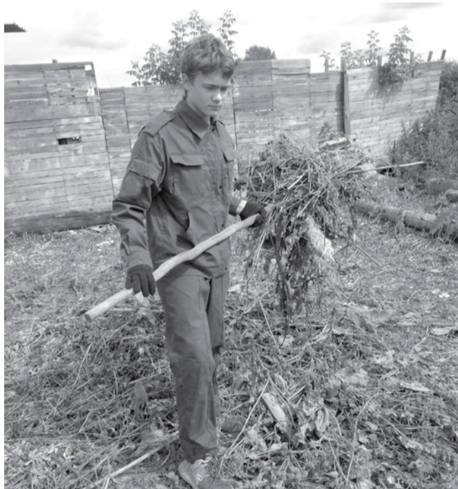
Практически всё лето трудоустроенные подростки работали на благоустройстве.