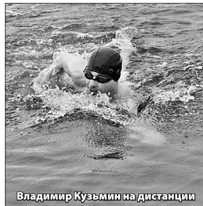
Владимир Кузьмин на дистанции