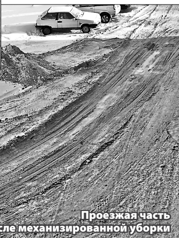
Проезжая часть после механизированной уборки

ставлять качественные услуги по содержанию и ремонту общедомового имущества. На деле мы видим другое – управляющие компании «Ассоль», «Атриум», ТСЖ «Надежда» и другие качественно выполняют принятые на себя обязательства по уборке дворовой территории. Каждый день их дворники под скребок очищают территорию, не допуская образования наледи и накопления лежалого снега. В помощь дворникам привлекается и техника. Многие горожане видят эту разницу и хотели бы иметь такое обслуживание своих дворов.