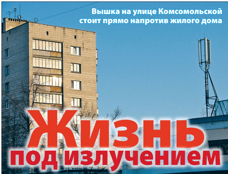
Вышка на улице Комсомольской стоит прямо напротив жилого дома