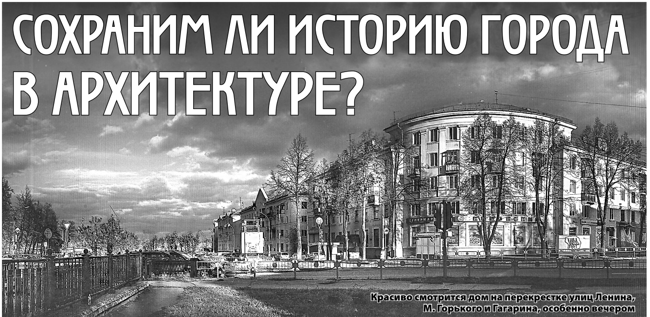
Красиво смотрится дом на перекрестке улиц Ленина, М. Горького и Гагарина, особенно вечером

Я не восхищаюсь и не вдохновляюсь Сталинским ампиrom. Но это достойно