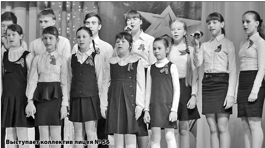
Выступает коллектив лицея №56

пели дети и подростки, вызывая у зрителей слёзы.