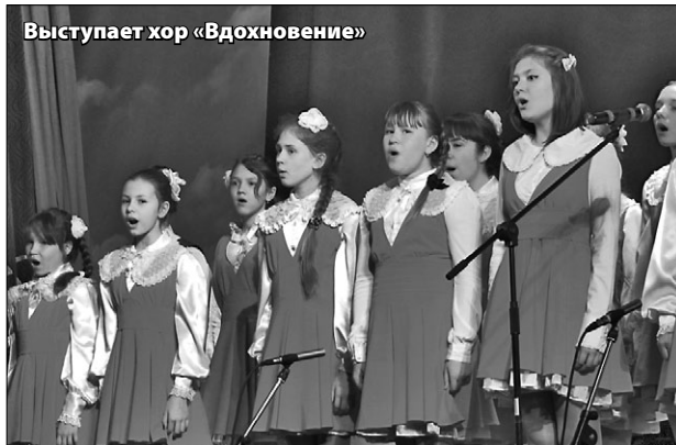
Выступает хор «Вдохновение»