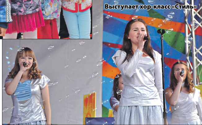
Выступает хор-класс «Стиль»

рила и расшевелила уже изрядно подмёрзших горожан и поставила весёлую точку в празднике.