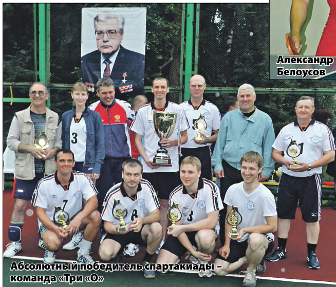
Абсолютный победитель спартакиады – команда «Три «О»