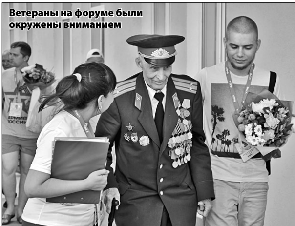
Ветераны на форуме были окружены вниманием