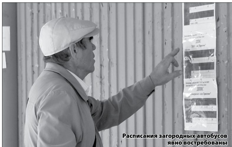
Расписания загородных автобусов явно востребованы