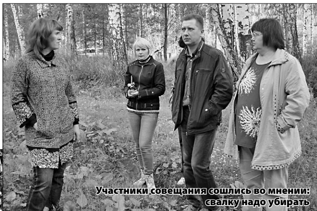
Участники совещания сошлись во мнении: свалку надо убирать

Собравшиеся у карьера специалисты оценили ситуацию и согласились с тем, что проблема есть и её надо решать, поскольку свалка является источником загрязнения окружающей среды и пожарной опасности. Способ решения: ликвидировать, то есть засыпать карьер, чтобы не было соблазна бросать туда мусор. Грунт для засыпки можно взять со строительных объ-