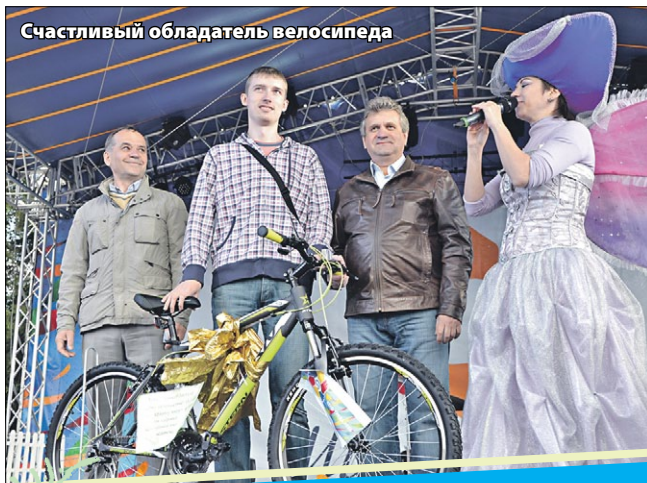
Счастливый обладатель велосипеда