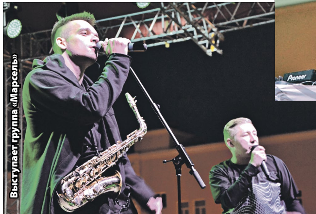
Выступает группа «Марсель»

Многие форумчане-завсегдатаи с ностальгией вспоминают «Утро-2013», когда две тысячи молодых людей жили в палатках и, пользуясь полученными знаниями и навыками, создавали проекты в экстремальных условиях. Участники преодолевали насекомые, поливал дождь, но все они прошли этот захватывающий квест благодаря своей сплоченности и выносливости. В этот раз условия для форумчан были комфортнее: нас разместили в корпусах Тюменского президентского