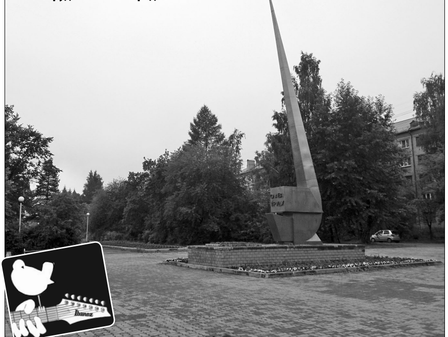
Аллею трудовой славы предложили обновить