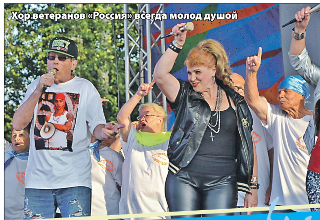
Хор ветеранов «Россия» всегда молод душой