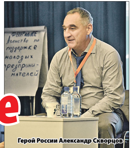
Герой России Александр Скворцов

ником одновременно очень полезно: это даёт возможность рассмотреть событие с разных сторон, внедриться в молодежную тусовку и самому оценить качество организации форума.