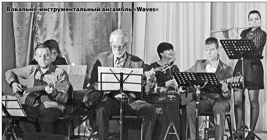
Вокально-инструментальный ансамбль «Waves»

– Огромное спасибо Новоуральску, огромное спасибо Уральскому электротехническому комбинату, администрации поселка Верх-Нейвинского. Большое