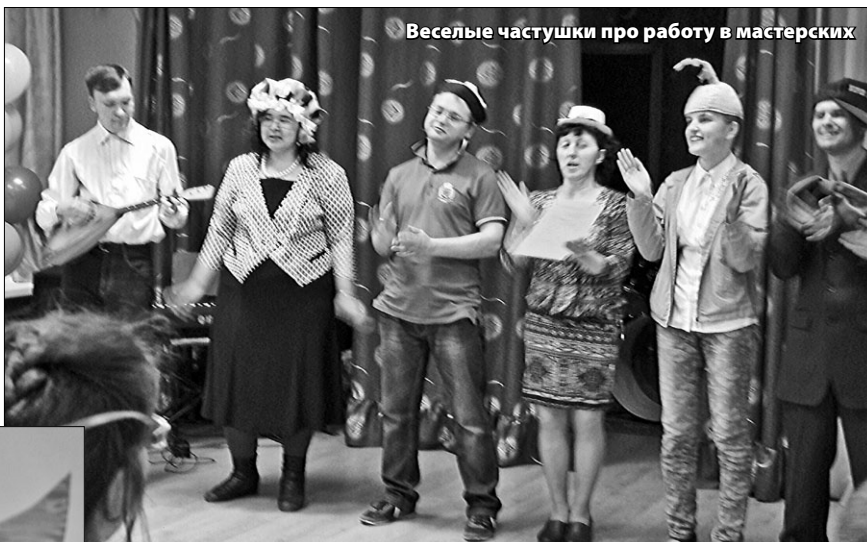
Веселые частушки про работу в мастерских

Затем состоялась презентация производственных мастерских «Благого дела»: бумажной, столярной, керамики, шерсти