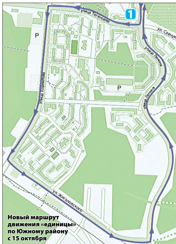
Новый маршрут движения «единицы» по Южному району с 15 октября