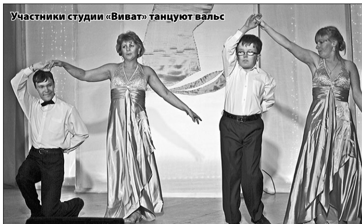
Участники студии «Виват» танцуют вальс

– Хочу сказать, что «Благое дело» входит в большую группу некоммерческих организаций, которые работают у нас в регионе. Такие проекты делают наше общество немного добрее. Они заставляют тех, кто бежит по жизни,