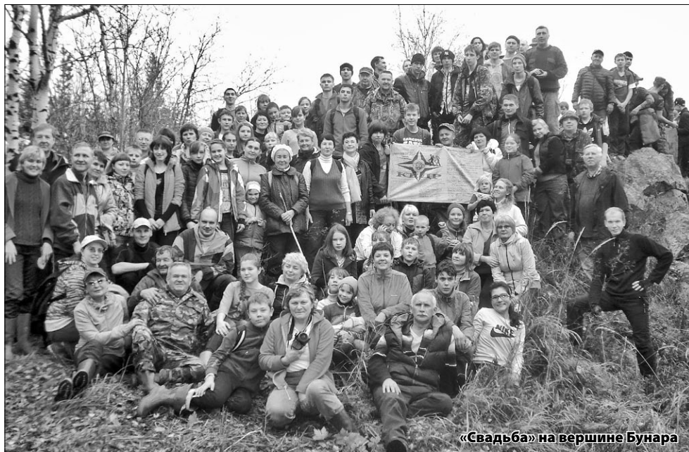
«Свадьба» на вершине Бунара

Покинув карьер, наша экспедиция дружно двинулась по лесной дорожке в гору, к ЛЭПке. Мужественно преодолев этот нелегкий участок пути, вышли к Бунарским скалам. Карбкаться наверх решились не все, так как камни были покрыты мокрой слизью. Подъем на вершину каменного останца оказался весьма рискованным, но любителей экстрима это не отпугнуло. Потом мы с большим удовольствием сфотографировались все вместе на фоне скалы. Прощались с Бунарскими скалами и двинулись дальше. По запутанным тропкам и дорожкам нас