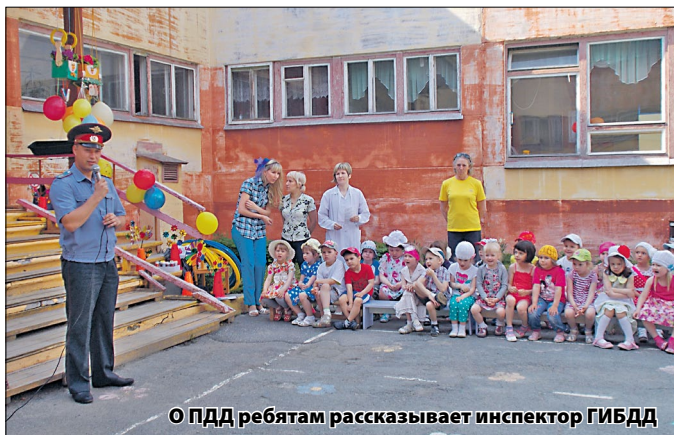
О ПДД ребятам рассказывает инспектор ГИБДД