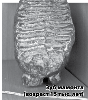
Зуб мамонта (возраст 15 тыс. лет)