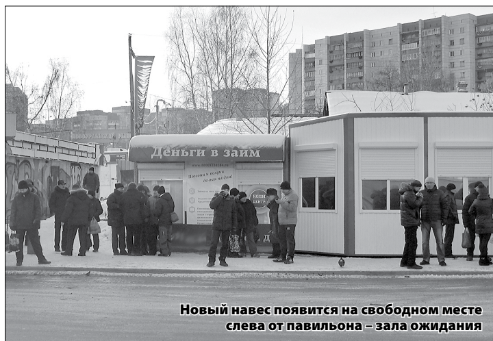
Новый навес появится на свободном месте слева от павильона – зала ожидания

Но не забыло предприятие «ИП Ефремов» и о пассажирах других маршрутов: рядом с тёплым павильоном в скором времени будет поставлен навес, которым, как и раньше, смогут пользоваться все ожидающие транспорт.