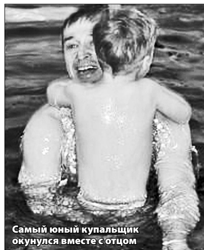
Самый юный купальщик окунулся вместе с отцом