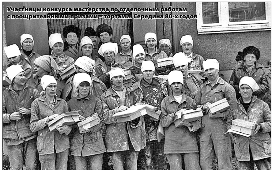
Участники конкурса мастерства по отделочным работам с поощрительными призами – тортами. Середина 80-х годов