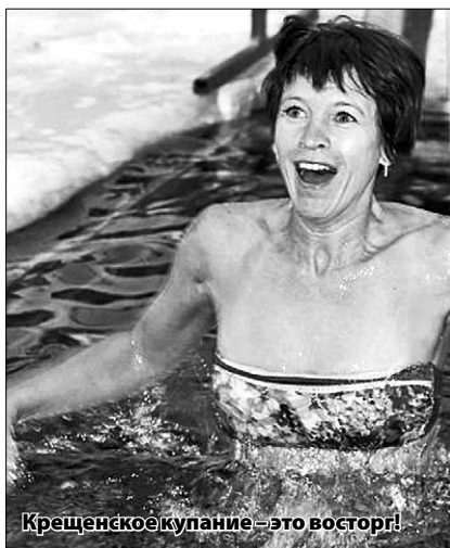
Крещенское купание – это восторг!

Владимир ПАВЛОВ